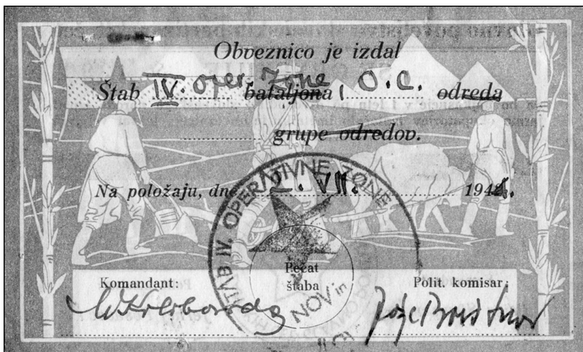
Sprednja in zadnja stran obveznice Glavnega poveljstva slovenskih partizanskih čet za 1000 reichsmark (AS 1116, Ministrstvo za finance RS, podfond Komisija za registracijo dajatev za NOV, š.k. 26, a. e. 181).

Prva registracija dajatev za NOV po okrajnih ljudskih odborih je potekala leta 1946. Takrat so bile registrirane vse dajatve, tako dajatve v naravi kakor v gotovini. Namen takratne registracije je bil ugotoviti približno višino dajatev za NOV. Registracija sama po sebi ni bila popolna predvsem zato, ker ni zajela vseh posojilodajalcev, ki so za-