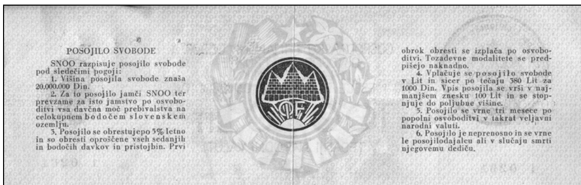
Sprednja in zadnja stran obveznice 5% posojilo svobode za 10.000 lir (AS 1116, Ministrstvo za finance RS, podfond Komisija za registracijo dajatev za NOV, š.k. 27, a. e. 182).