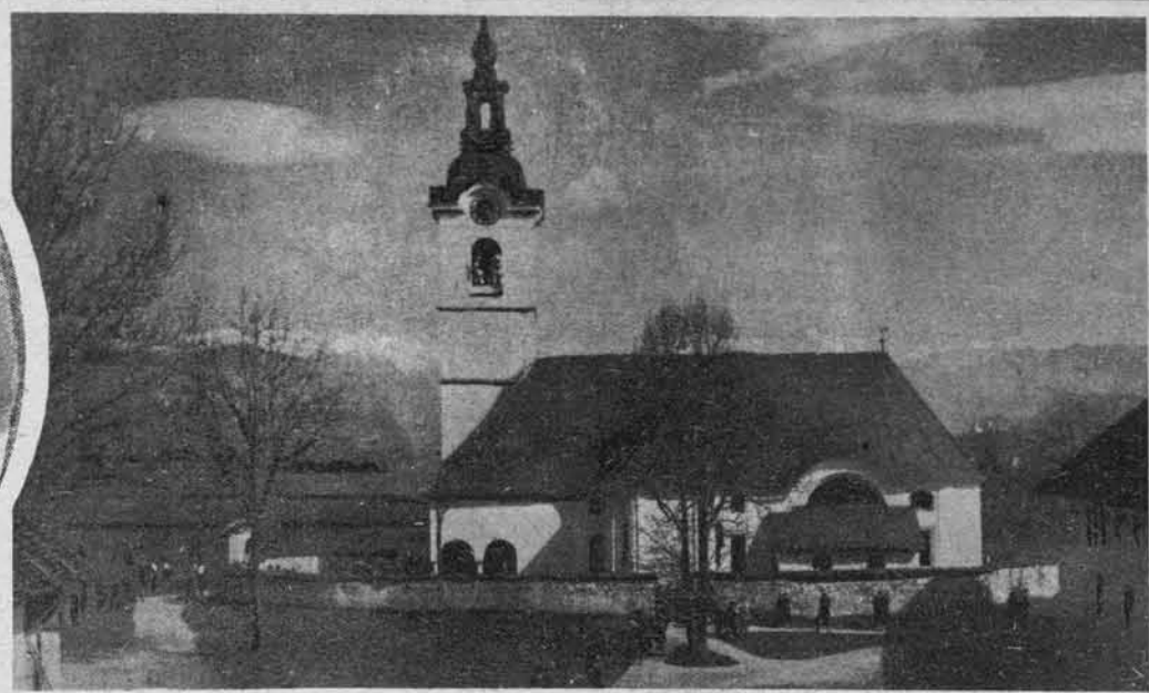
Značilna slovenska cerkva.