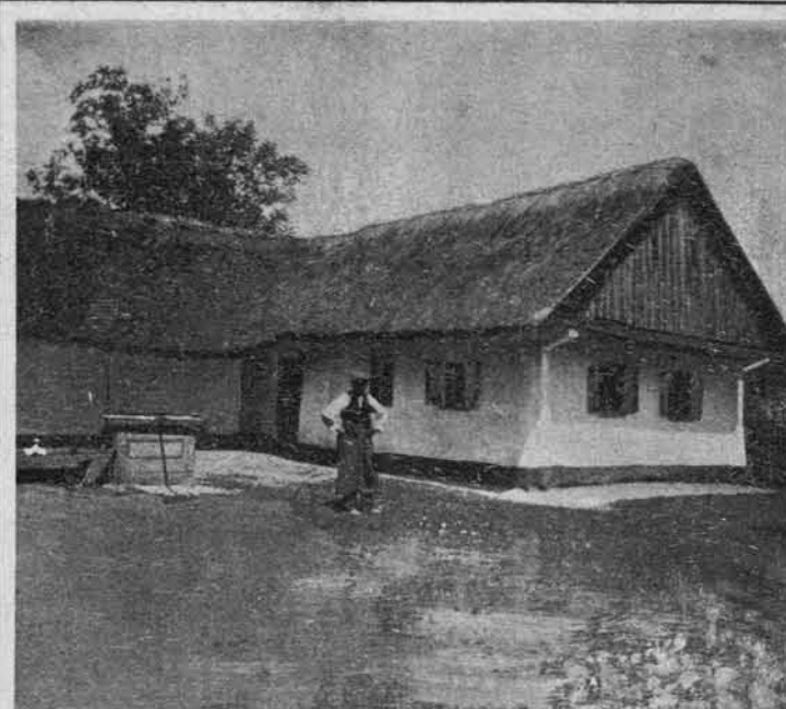
Tipična slovenska hiša v Prekmurju z dvorom v obliki podkve (Melince).