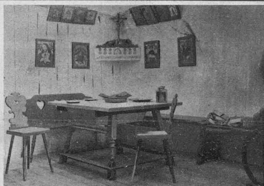
Notranjščina slovenske hiše:

tako zvana »hiša« na Gorenjskem, to je glavna soba.