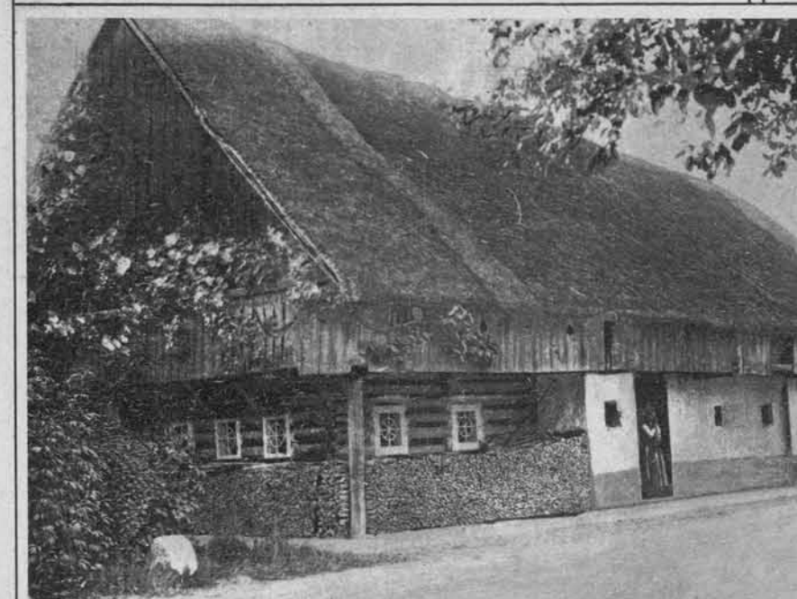
Naš kmetiški dom iz kamniškega okraja.