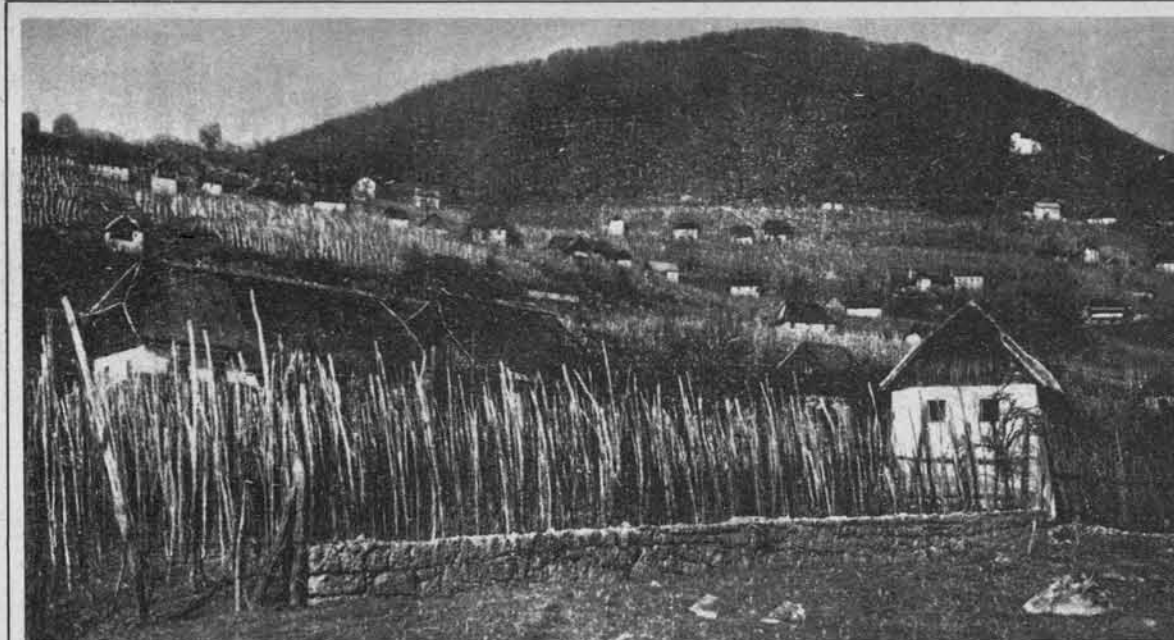
Pogled na belokranjsko vas (pri Semiču): hiše so raztresene po vinogradih.