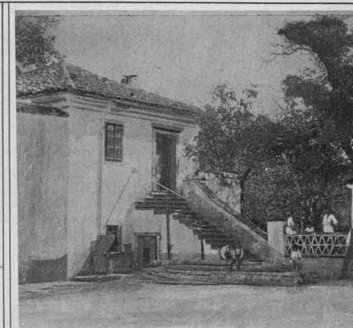
Slovenska hiša na Krasu.