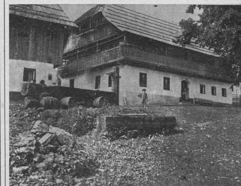
Slovenska hiša na Koroškem. (Gor. Ziljska dolina.)