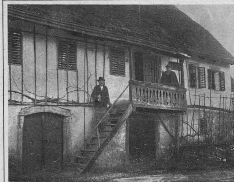
Tipična slovenska hiša z Dolenjske, ki ima v pritličju kleti, v prvem nadstropju pa stanovanjske prostore.