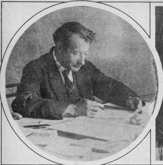
Kmet — pisatelj.