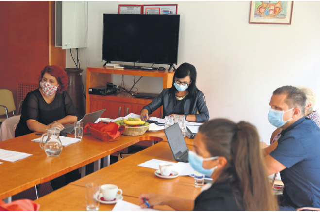
Svet zavoda ima končno novo sestavo, konstitutivna seja bo najbrž še ta mesec.

Vlada RS je 21. aprila končno imenovala svoje predstavnike v svet Doma upokojencev Ptuj. Po pričakovanjih so trije člani, ki so bili imenovani že lani jeseni, nespremenjeni, le dva predstavnika države sta nova.