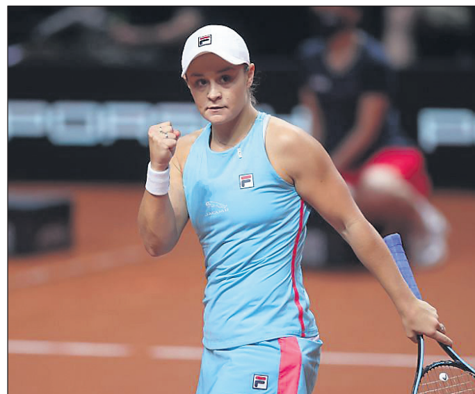
Prva igralka sveta Ashleigh Barty se je morala pošteno potruditi za zmago proti Tamari Zidanšek v drugem krogu mastersa v Madridu.

takoj prišla do break priložnosti na servis Bartyjeve. Ta se je iz zagate rešila z dobrim servisom, nato pa v naslednji igri sama izvedla break – 0:2. Samo dve ali tri minute nezbranosti so bile dovolj, da je najboljša igralka sveta odvzela servis Slovenki, iz tega položaja pa rešitve več ni bilo. Pri izidu 1:3 je Tami še zapretila (15:40 na servis tekmice), a je vedno