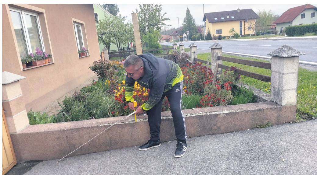
Pri Pekarjevih bo kolesarska steza le slaba dva metra od kuhinjskega okna.

Tudi glede pogodbe in ustanovitve služnosti je pojasnil, da je to bila najkrajša pot, ki jim omogoča pridobitev gradbenega dovoljenja in samo gradnjo. Gre namreč za utečeno prakso, ki se je poslužuje tudi v drugih občinah. Pogodbe je sicer podpisalo že okoli 85 odstotkov lastnikov (vseh je okoli 150), nekaj lastnikov je tudi takih, ki jih ne najdejo, so pogrešani oz. se sploh niso odzvali na njihove pozive.