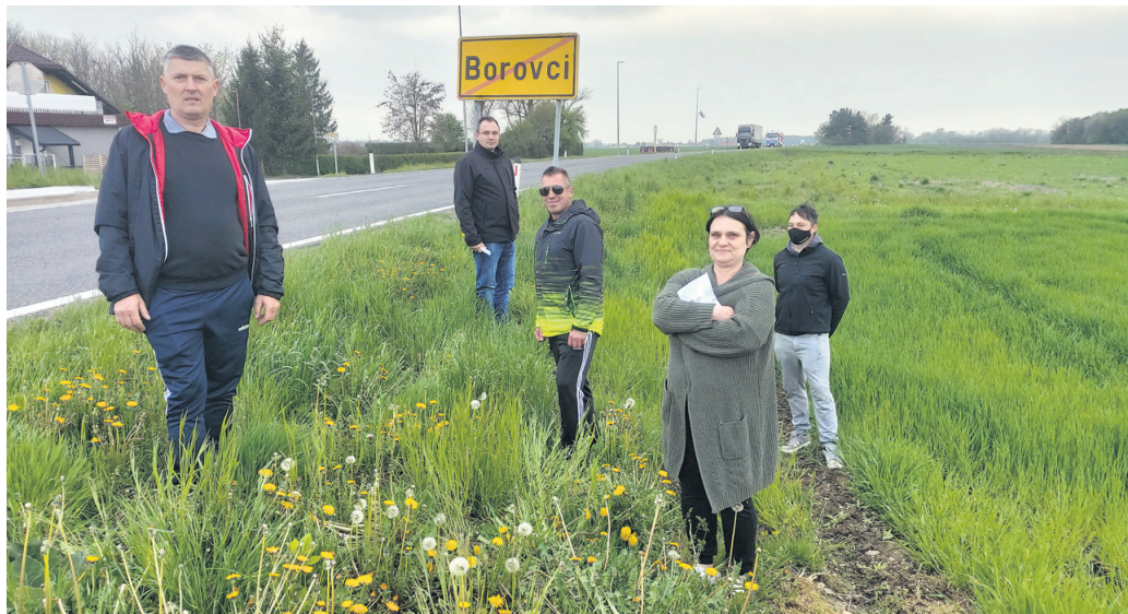
Vaščani Borovcev so prepričani, da bi za potrebe kolesarske steze lahko manj posegali v notranjost zemljišč.