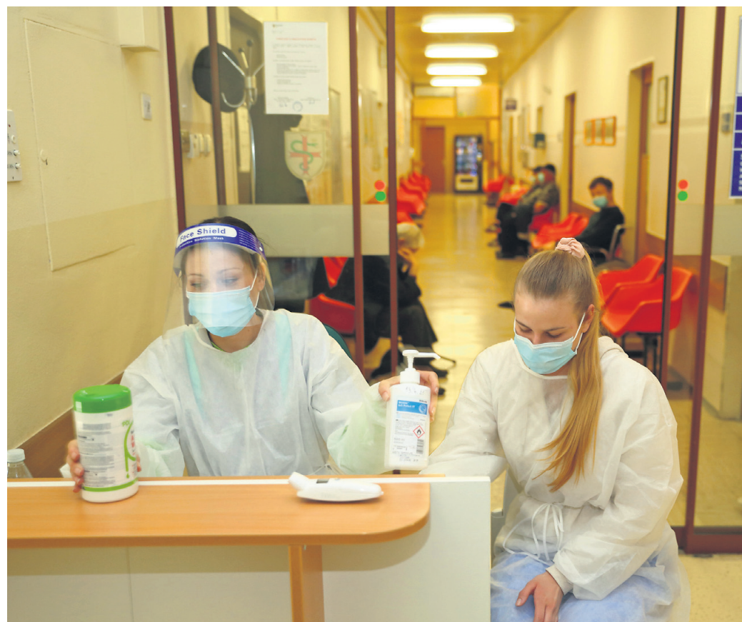
Zadnje tri mesece so vse posteljne kapacitete (60 postelj) ptujskega internega oddelka nenehno polno zasedene. Na covid oddelku je trenutno 20 pacientov, še pet na intenzivni negi.