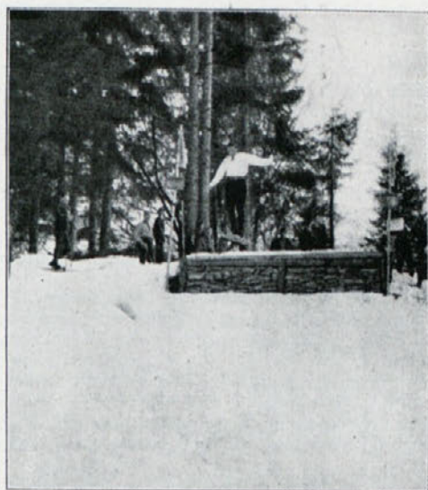
Skakalna tekma v Bohinju: Lep odskok.

jilo delovanje le na ta edini klub, ki je priredil prvi javni skupni izlet v juliju na Koroško ter združil z izletom prvo avtomobilno vztrajnostno tekmo, ki je sorazmerno jako dobro izpadla. V Sportnem tednu je bila nameravana druga avtomobilna vztrajnostna tekma na 150 km, ki pa se je vsled nezadostnih prijav odpovedala. Velik vzrok je bil takrat neugoden čas, radi pomanjkanja obratnih sredstev in radi pozne sezone. Za bodočo sezono namerava