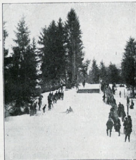
Skakalna tekma: Odskok s padcem.

Dirkalni odsek je v pretekli sezoni jako intenzivno deloval. Najdelavnejši klub, Ljubljanski dirkalni klub, si