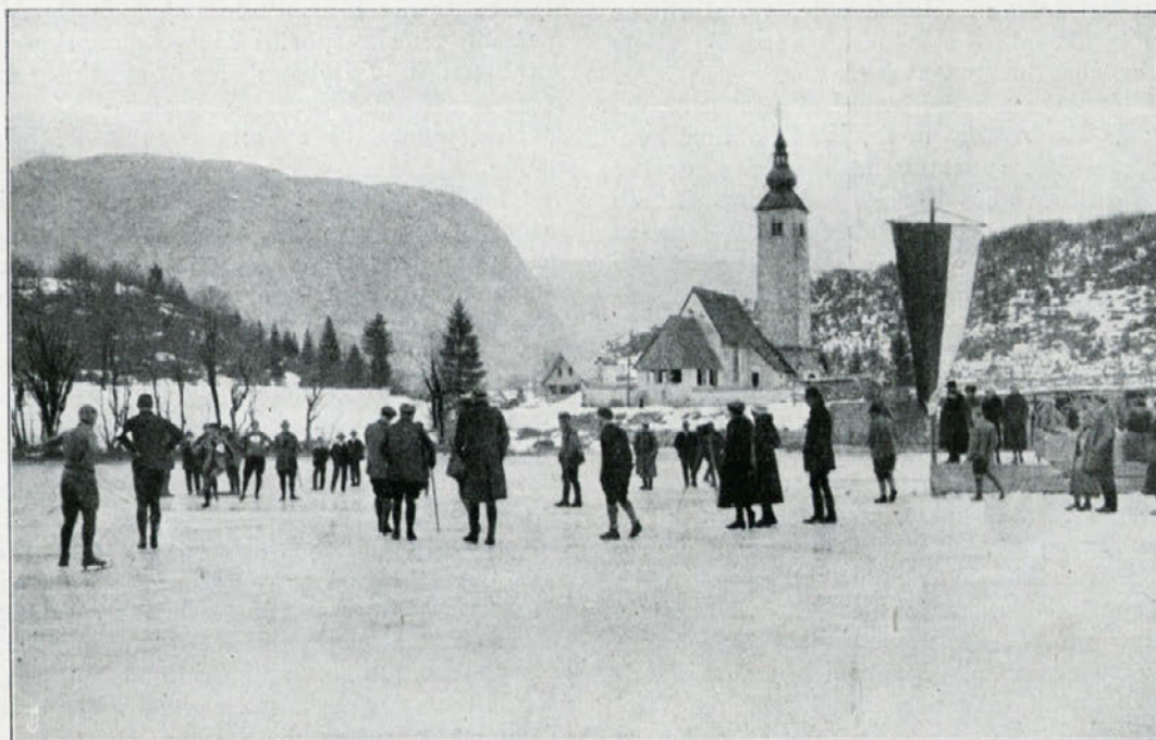
Vrvenje pred drsalno tekmo na Bohinjskem jezeru.

sicer v primeri s svetovnim sportnim življenjem pač kratka doba, vendar pa moramo resnici na ljubo izjaviti in dejstvo z veseljem pozdraviti, da je v tem letu na polju sporta poganjalo, brstelo in zelenelo na vseh koncih in krajih, pa ne samo to, še več — nekatere panoge našega sporta so se naneverjeten način razvile, imeli smo v preteku tega prvega leta prireditve, ki delajo tako na obsegu kakor na efektu, na poglobitvi in preobrazbi dotične panoge sporta slovenskemu narodu vso čast. Ni