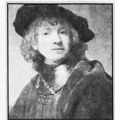
Rembrandt, oče holandske grafike, mladostni avtoportret, 1634