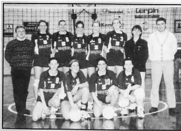
Ženska ekipa Olympia Kmečka banka, uspešna v C ligi

Ne. Razloga sta dva: preobremenjenost zaradi službenih obveznosti in želja, da bi na predsedniškem mestu prišlo do zamenjave, kar bi društvu vneslo novih svežin.