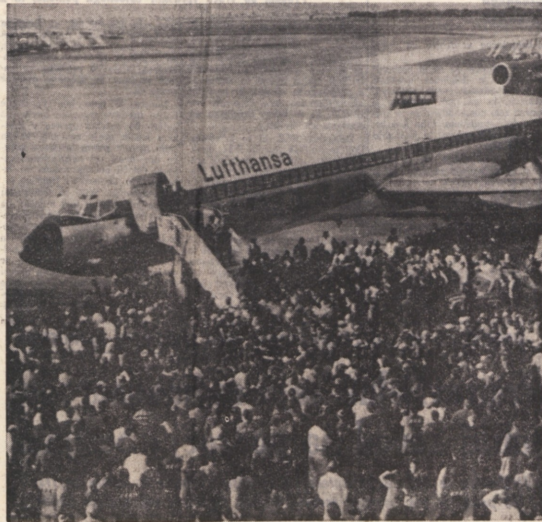
Velika množica, ki je na rimskem letališču v Fiumicinu dočakala talce

zajamčenje njene učinkovitosti v konkretnih pogojih, v katerih se mora danes razvijati sindikalni boj. Tajnik CGIL je poudaril, da sindikalno gibanje ni pripravljeno sprejeti nobenih pozivov k varčevanju v eno samo smer. Delavci so pripravljene prenesti potrebne žrtve, vendar zahtevajo jasno, konkretno in takojšnjo protutež, in sicer družbene usluge in reforme. Prav tako sindikati ne morejo pristajati na predloge, ki bi privedli do zmanjšanja ravni zaposlovanja. Sindikat vrača tudi preozke kriterije, s katerimi se danes namerava izvajati proračunska politika, ter zahtevajo sproženje takojšnjega in širokega načrta javnih in zasebnih investicij, ki bi omogočale, po izbiri zainteresiranih krajev in sektorjev, dejansko preobrazbo gospodarskega mehanizma. Treba se je tudi lotiti najbolj nujnih problemov, toda ne le z nekimi emergencnim načrtom, pač o s programom investicij, ki naj bodo učinkovite v kratkem roku, istočasno pa usmerjene k spremembam mehanizma, ki bodo v bodo-