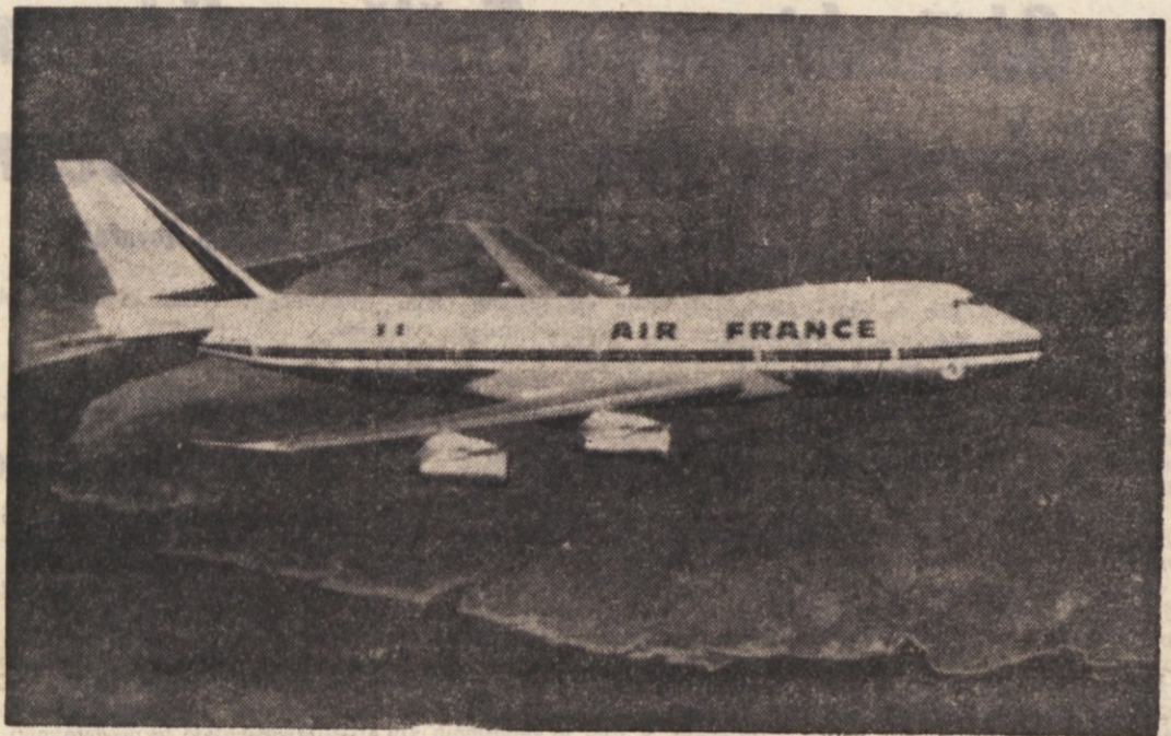
Zračni velikan — jumbo-jet — ki mora sprejeti na krov do 400 potnikov

Opoldne iz Milana, da bi bili opoldne že v Parizu - Čez Irsko in Grenlandijo do Montreala - Obseg jumbo-jeta - V Los Angelesu in Disneylandu