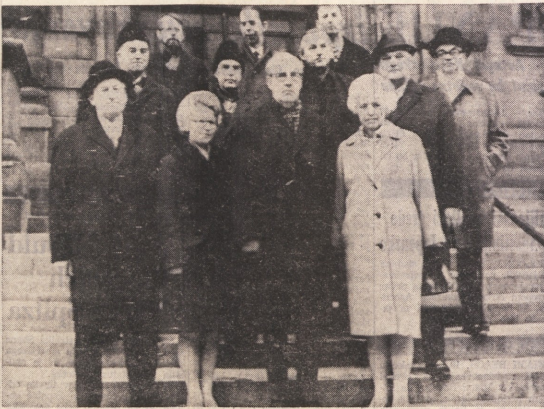
Včeraj je bila sestavljena nova danska manjšinska vlada (na sliki ministri na stopnišču grada Christiansborg), ki ima v parlamentu le podporo liberalcev in občasno podporo liberalnih demokratov