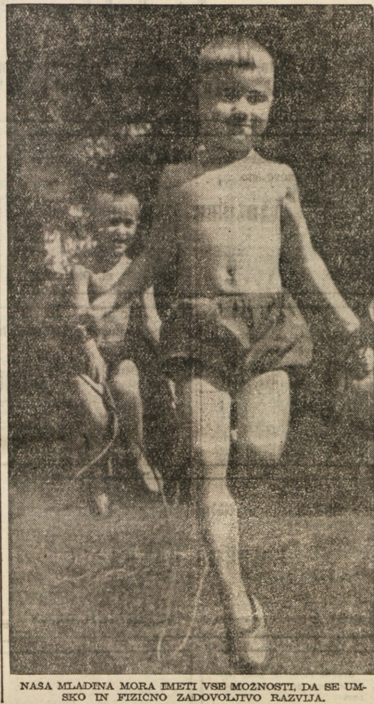
NASA MLADINA MORA IMETI VSE MOŽNOSTI, DA SE UM-SKO IN FIZICNO ZADOVOLJIVO RAZVIJA.

Kljub temu zaznamujemo na zadružnem sektorju tega ozemlja v preteklem letu razmeroma velik uspeh. Zadružna aktivnost je posegla v območja obeh gospodarskih funkcij — potrošni ter kmečki in obrtno-produkcijsko. Nabavno-prodajne zadruge v Kopršnici in Buzičnici zajemajo nad 6000 članov, kar pomeni na 65.000 prebivalcev ali okrog 14.000 gospodarjev zadovoljiv uspeh. Decentralizacija zadrug je pomenila korak k večjemu sodelovanju članstva, kar je glavni pogoj pravičnega delovanja zadrug. Razumljivo, da se morajo te zadruge, katerih naloga obstoji trenutno predvsem v preskrbi prebivalstva s predmeti široke potrošnje, boriti s raznimi težavami in ovirami. Ljudstvo ima velike potrebe, po drugi strani pa ne more vnovčiti svojih priredkov zaradi po Anglo-američanih umetno vzdrževane meje, in to v škodo vsega prebivalstva Tržaškega ozemlja.