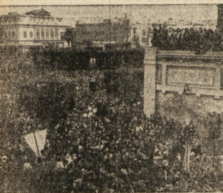
ARABSKI VODJE SO NAGOVORILI V KAIRU MNOŽICO, KI VZKLIKA VOJNI ARABSKI VODJE S SREDNJEGA VZHODA. KI SO SE UDELEŽILI KONFERENCE ARABSKE ZVEZE, SO NAGOVORILI Z BALKONA HOTELA «CONTINENTAL» V KAIRU DNE 14. DECEMBRA VELIKANSKO MNOŽICO, KI SE JE TAM ZBRALA. KONFERENCA JE BILA ZAKLJUČENA 17. DECEMBRA S POZIVOM ARABCEM, DA: «NAJ SPREJMEJO BORBO, KI JIM JE BILA VSILJENA IN DA NAJ SE BORILJO DO KONCNE ZMAGE».