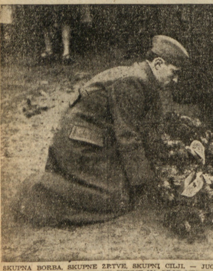
SKUPNA BORBA. SKUPNE ŽRTE, SKUPNI CILJI — JUGOSLOVANSKI VOJAK POLAGA OB ZALNI SVEČANOSTI CVETJE NA GROB NEKEGA TALCA V FRANCIJI.