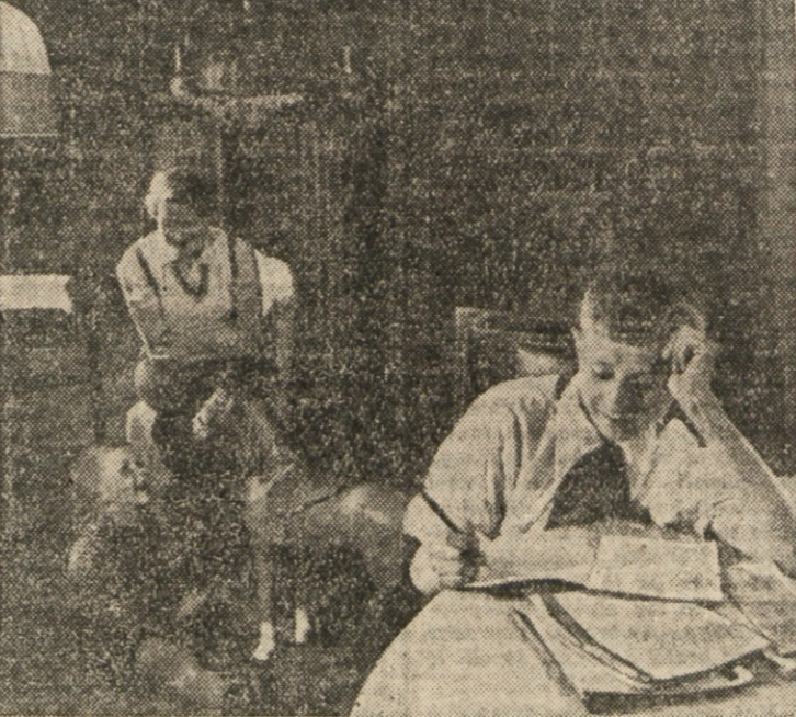
NASIM DRUŽINAM NAJ BO OMOGOČENO SREČNO ZIVLJENJE OB DOBREM ZASLUŽKU. NE SME SE NIKOLI VEČ DOGAJATI, DA SE ZARADI BEDE RAZBIJAJO NASE DRUŽINE.