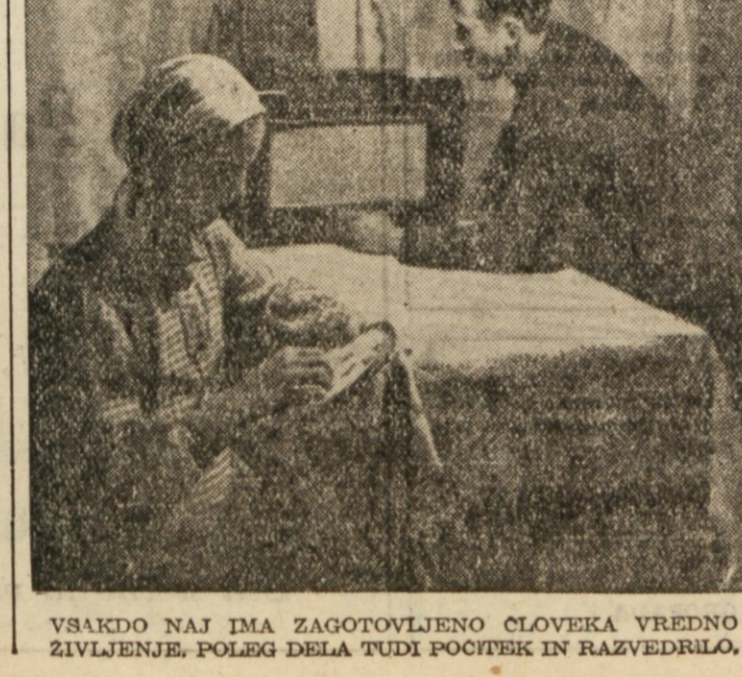
VSAKDO NAJ IMA ZAGOTOVLJENO ČLOVEKA VREDNO ZIVLJENJE. POLEG DELA TUDI POČITEK IN RAZVEDRILLO.

Sporazum o vzajemnih dobavah blaga kakor tudi o sovjetskih naročilih v Veliki Britaniji je samo prva faza pogajanj za razvoj trgovine med obema deželama. Stranki sta se sporazumeli, da se bodo predstavniki obeh vlad sestali pozneje maja 1948, da se sporazumejo o razširjenem programu vzajemnih dobav blaga za daljšo dobo na osnovi ustanovitve uravnovešene trgovine. Obe stranki mislita, da bo sporazum, ki je bil pravkar sklenjen, prispeval k razvoju sovjetsko britanske trgovine v medsebojnem interesu. V imenu Sovjetske zveze je zbirnik podpisal minister za zunanje trgovino Mikojan, v imenu britanske vlade pa izredni veleposlanik v Moskvi Peterson.