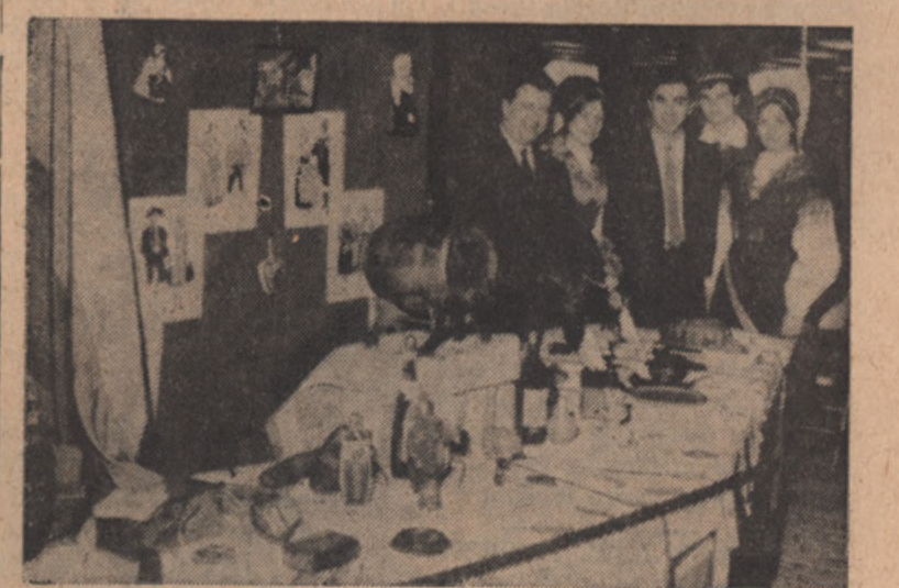
"Slovenska velikonocna miza" v torontski mestni hiši (na cvetno nedeljo letos), kot so jo pripravili člani inčianice to-rontske S.A.V.A.-c.