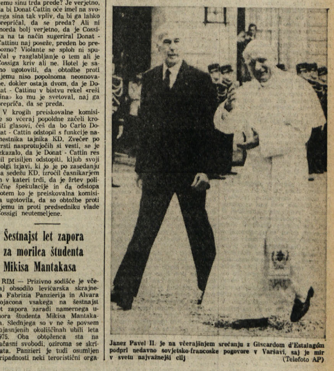
Janez Pavel II. je na včerajšnjem srečanju s Giscardom d'Estaingom podprl nedavno sovjetsko-francoske pogovore v Varšavi, saj je mir v svetu najvažnejši cilj.