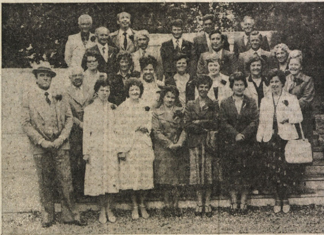
Tudi 40-letniki iz doberdobske občine so si nadeli eta nove gvante in se prejšnjo soboto zbrali na družabnem srečanju...