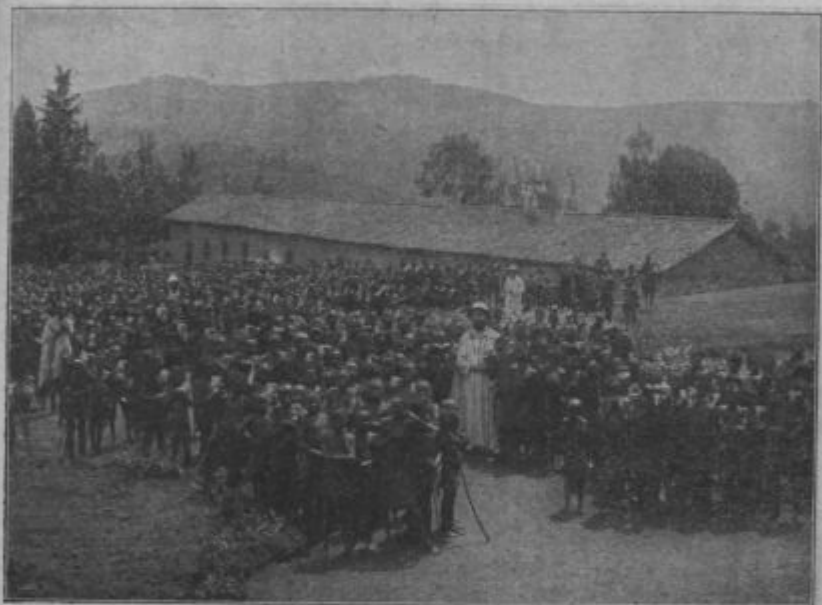
Prilravniki na sv. krst i novokrščenci pred misijonskov cerkvicov v srednjoj Afriki.

Prle kak je nastopo svojo zadnjo pot, sem bi šče pri njem. Zajtra sem njemi dvoce pri sv. meši i večer sem njemi šče voščo srečno pot. Jako me je bio veseli, potegno me je za brado i pravo: „Moli, moli dosti i goreče, da srečno prideva v Sinčao. Ze štiri leta težko odlašam, a