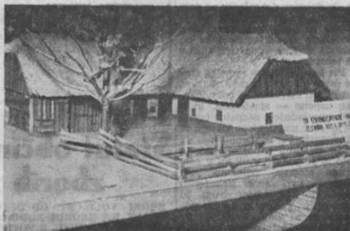
Maketa domačije iz bližine Ptuja