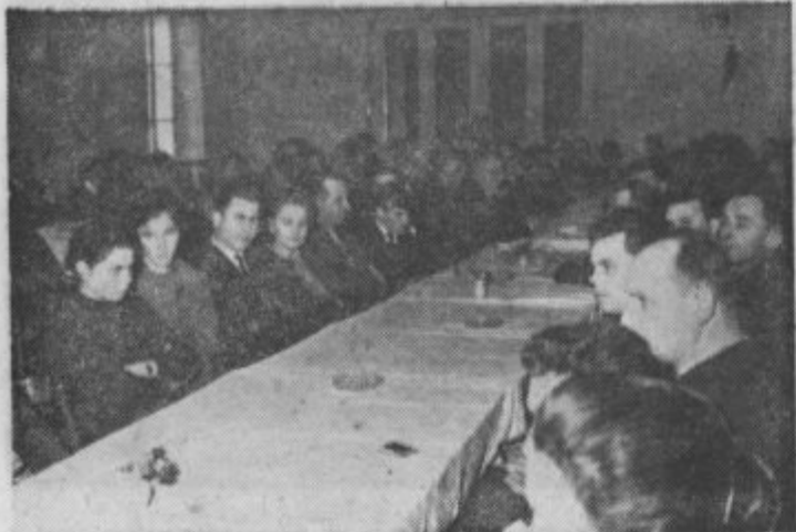
Zbran kolektiv »Panonije« na zboru in proslavi