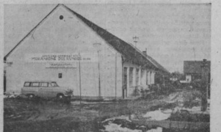
Novo poslopje mehaničnih delavnic kmetijskega kombinata Ptuj

Mehanična delavnica zamejuje motorje na traktorjih in lahko v nujnih primerih zamenjava opravi v osmih urah. Razpolaga že z dokaj dobro opremo, ki je nujno potrebna pri remontu. Med ostalimi stroji ima tudi stroj za nastavitve tlačik (diesel), ki je izredne važnosti glede na to, da takega stroja ni v bližnji okolici. Glede na primerne delovne prostore in specializiran kader, bo v bodoče Mehanična delavnica Kmetijskega kombinata Ptuj opravljala usluge za vsa kmetijska podjetja. L.