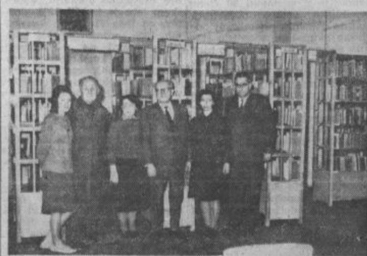
Kolektiv ljudske knjižnice v Ptuj ob koncu urejanja knjižnice

Priporočamo pa tudi knjižničarjem ljudskih in tudi strokovnih knjižnic delovnih organizacij, da si ogledajo naš oddelk ljudske knjižnice in se seznanijo