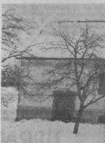
Prazna stavba na Strmci

Morda je umestno pripomniti šeto: Intenzivne oblike pouka tujih jezikov so uspešne, so pa razmeroma drage. Mnogokje financirajo podjetja svojim članom te tečaje. Morda bi tudi pri nas šolala podjetja na tak način tiste svoje člane, ki jim je znanje tujih jezikov potrebno v vsakdanji praksi.