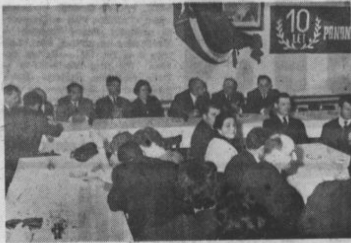
Povabljeni gosti in predstavniki ter funkcionarji »Panonije«