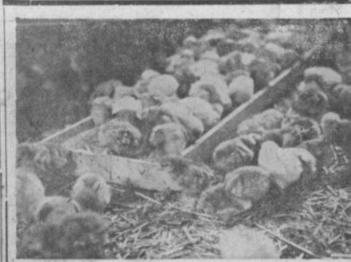
Za perutninsko vzrejo na farmi in za kooperante pripravljene piščančki

*Tednik* izhaja pod tem skrajšanim imenom od 24. nov. 1961 dalje na predlog Občinskih odborov SZDL Ptuj in Ormož. — Izdaja: zavod *Tednik*, Ptuj — Odgovorni urednik: Anton Bauman — Uredništvo in uprava: Ptuj, Lacoška 8 — Tel. 156 — Št. tek. računa: NB Ptuj 604-19-603-72 — Tiska: časopisno podjetje *Mariborski tisk* — Rokopisov ne vračamo. — Celoletna naročnina za tuzemstvo 1000, za inozemstvo 2000 din.