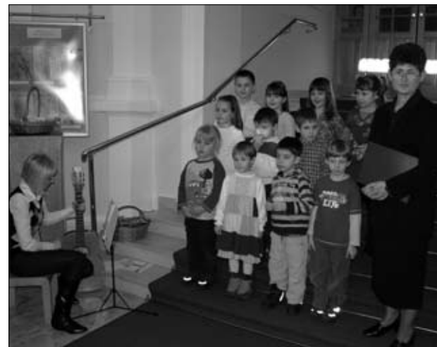
Nastopajoči iz Vrta Ormož

Ob slovenskem kulturnem prazniku sta VIZ Vrtec Ormož in Muzej Ormož v četrtek, 5. februarja, v prenovljeni avli Občine Ormož postavila na ogled razstavo »IMAM PRIJATELJA, IMAM DREVO!«. Razstavljeni likovna dela so plod doživljajskega izražanja predšolskih otrok skupine »Hermanovi prijatelji« Vrta Ormož, v okviru inovacijskega projekta »DREVESA UMIRAJO STOJE!«