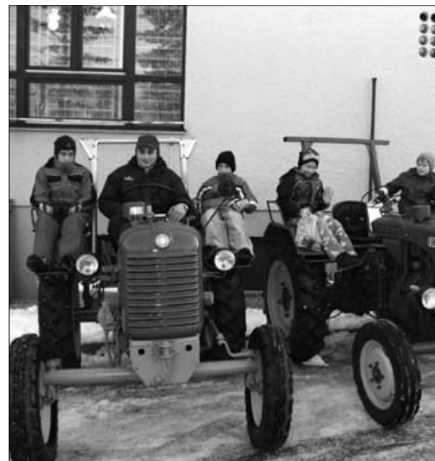
Staro in mlado

Za zabavo so tudi tokrat poskrbeli Künštni Prleki s svojo prisotnostjo in suho antonovo salamo v nahrbtnikih. Niso manjkale frajtonarice, na ogled so bili traktorji Kluba Steyr iz Lačavesi.