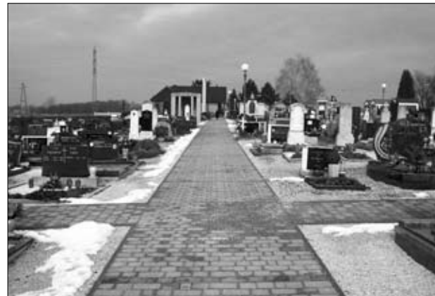
Nova pot na pokopališču v Ormožu

se tlakovale poti, na ormoškem se je uredila razsvetljava, na sredino pokopališča smo namestili fontano, uredilo se je ozvočenje po pokopališču ter štiri klopi, ki bodo nameščene ob glavni poti pokopališča. Prav tako sta postavljeni še dve nadstrešnici nad zabojniki za smeti. Za pokopališče na Humu imamo pripravljeno projektno nalogo za ureditev mrliške vežice. Z deli bomo začeli v pomladanskem času.