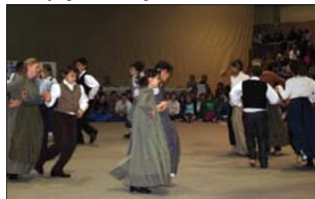
Na mladih svet stoji

Izvedeli smo tudi marsikaj novega o »gostujanju«. To je bil v tistih časih dogodek za vso vas. Naši folkloristi so se z veliko veselja spomnili starih ritmov in veselo vzdušje prenesli v ples.