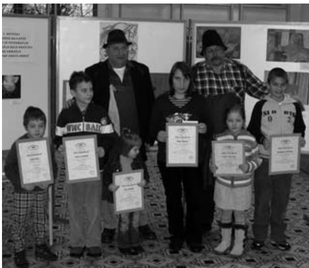
Dobitniki nagrad s Künštnima Prlekoma

Ob odprtju razstave je bil kulturni program, ki so ga izvedli mladi harmonikarji skupaj s »Künštnimi Prleki«.