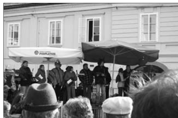
Ocenjevalna skupina in napovedovalec