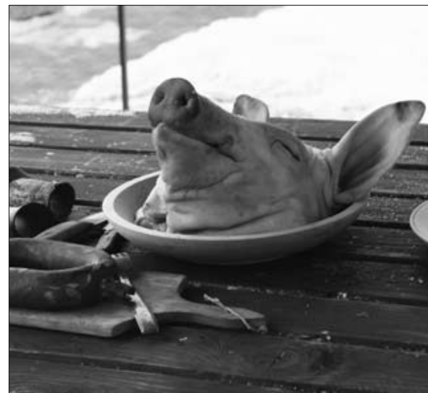
Brez komentarja

V zrak pa pa so se dvigale tople meglice nad kozarci kuhane vina. »Künštni Prleki« pa so še dolgo čez poldne pekli »čurk« in pečenice ter z vsemi ostalimi skrbeli za prašičkov pogrinjek.