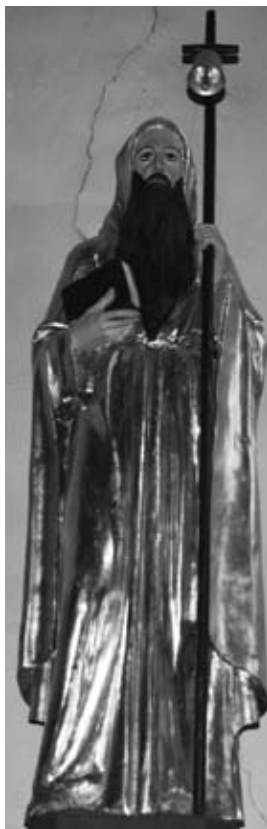
Kip sv. Antona

S v. Anton Puščavnik, ki goduje 17. januarja, je oče menihov in puščavnikov. Bog mu v njegovem puščavniškem življenju ni prizanašal s skušnjavami. Te naj bi predstavljal prašiček, ki ga vidimo na vseh njegovih podobah. Takšna podoba sv. Antona z zvončkom in s prašičkom je tudi v farni cerkvi sv. Bolfenka na Kogu in cerkev zaradi nje v bližnji okolici že dolga leta slovi kot romarska cerkev. Sredi zime doživi kraj enega svojih največjih praznovanj in na kogovski hrib se k svojemu zavetniku vsako leto ob vsakršnem vremenu napotijo številni romarji, zlasti pa rejci prašičev in drugih domačih živali.