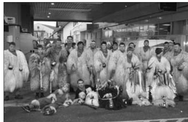
Ormoški kurenti

Organizatorji ormoškega »fašenskega« karnevala pa so bili zadovoljni tudi zaradi velikega števila obiskovalcev, ki so si ogledali pustno povorko. Tako je pustni torek v Ormožu minil v veselem in živahnem vzdušju, za kar so poskrbele številne pustne maske.