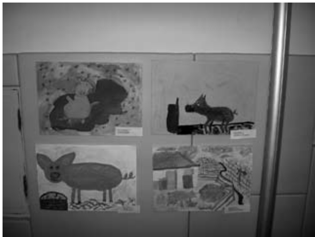
Razstava izdelkov

Prvi dan praznovanja, v petek popoldan, je bila v OŠ Kog odprta 1. razstava risb in fotografij na tematiko reje prašičev. Predstavljeni so bili izdelki 1. natečaja na to temati