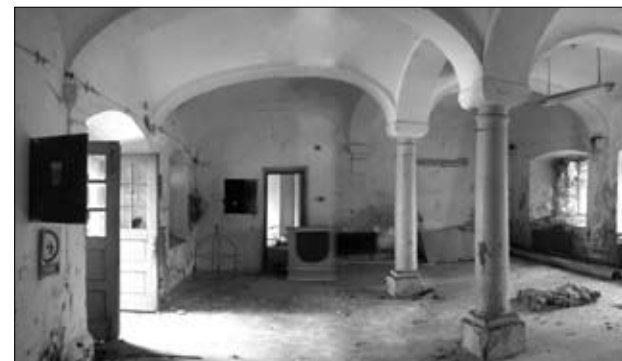
Obstoječi obokani prostori pritličja

Pristavo sestavlja več med seboj povezanih pritličnih gospodarskih poslopij, ki so nastala v različnih časovnih obdobjih od 18. stoletja naprej. Najstarejši del je na južni strani ob gradu, najmlajši pa nadzidan trakt nekdanje opekarne, ki s svojo podobo ne ustreza celoti. Vsi trakti ležijo na robu brežine parka in zaokrožajo skupno dvorišče. Pritlični prostori so z izjemo nekaterih manjših delov v celoti obokani. Oboki so dokaj dobro ohranjeni. Najlepši prostor v vzhodnem traktu kompleksa ima dva centralna prosto stoječa stebra z reprezentančnim kapastim obokanjem.