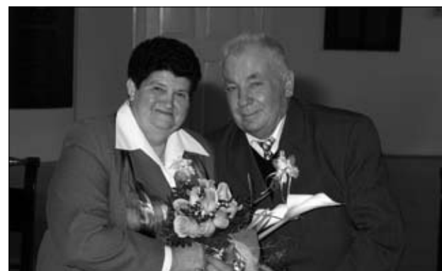
Zlatoporočenca