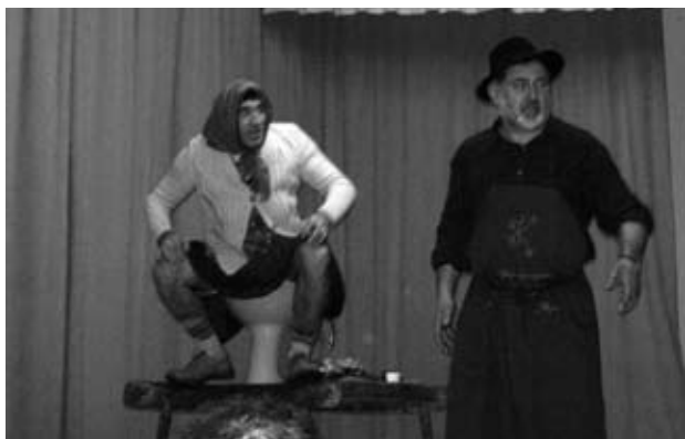
Pepek in Pepika