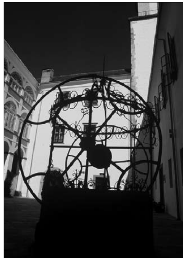
Ormoški grad (dvorišče).

Sicer pa je v letu 2008 v okviru muzejske dejavnosti še treba poudariti sodelovanje Muzeja Ormož (Nevenke Korpič) v mednarodnem projektu »Tradicionalne obrti - nove možnosti za razvoj turizma«. V okviru projekta je potekalo sodelovanje našega muzeja z muzejem Murska Sobota, PMP, ZRS BISTRA Ptuj, Muzejem Kumrovec,