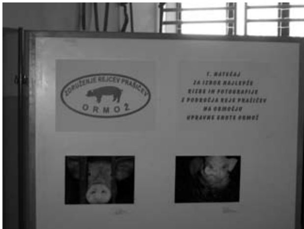
Kralj živali?