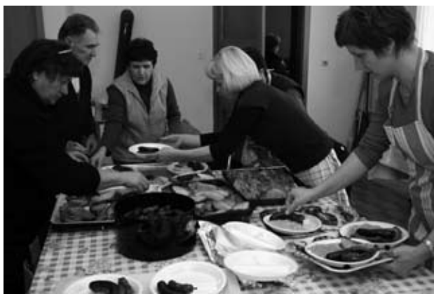
Priprava pojedine

Sklepni del tekmovanja se je odvijal v znamenju prašička in njegovih dobrot: vsi udeleženci tekmovanja so bili prisotni na Antonovi pojedini, na kateri ni manjkalo klobas, kisle repe, kislega zelja in »čurk«.