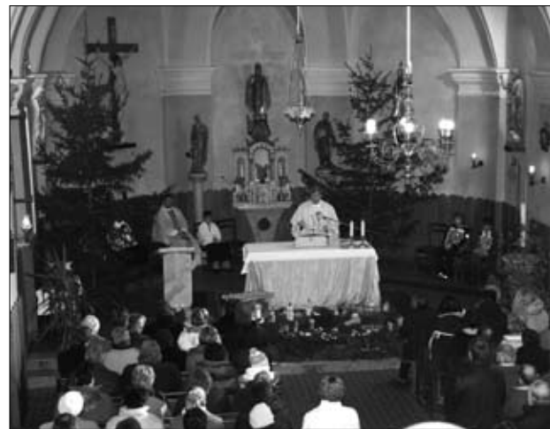
Praznična maša v farni cerkvi

Drugi dan praznovanja so začeli upokojenci, ki so organizirali dvoransko kegljanje za prehodni pokal KS Kog. Uvod v tekmovanje je popestril pevski zbor Društva upokojencev Zarja Kog, zunaj na stojnicah pa so bile že od samega začetka na voljo dobrote, ki so jih pripravili Združenje rejcev prašičev Ormož, Turistično društvo Kog in Aktiv kmečkih žena Kog.