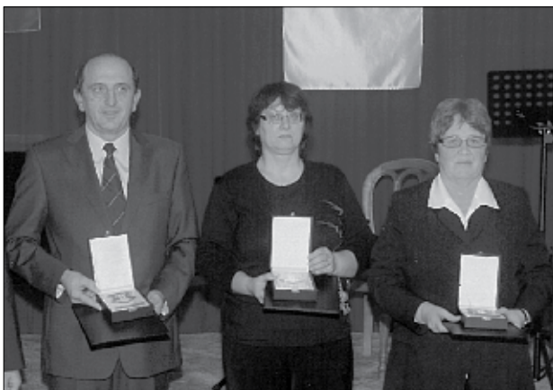
Dobitniki Občinskih priznanj za leto 2008