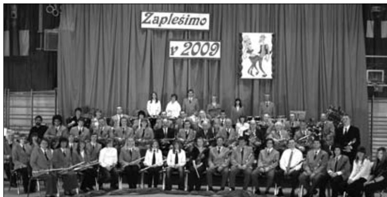
Pihalni orkester Ormož