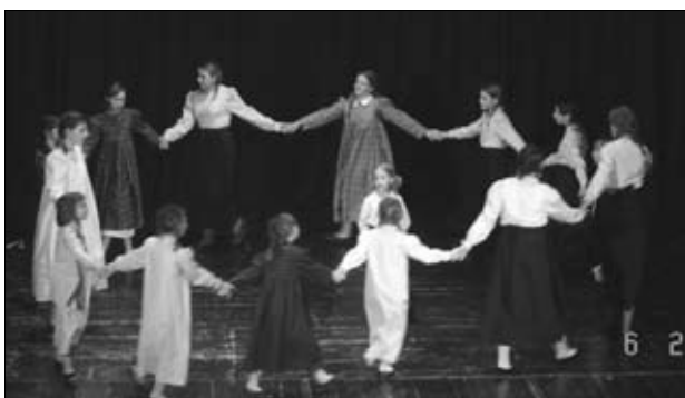
Krožek "Ljudski običaji" OŠ Ormož

Za nas je bila to lepa izkušnja in hkrati smo lahko pokazali, kaj smo se že naučili. Obenem pa so nas opozorili, na kaj moramo še bolj paziti in katera pravila moramo še osvojiti. Spoznali smo, da so za uspeh pomembne tudi majhne stvari.