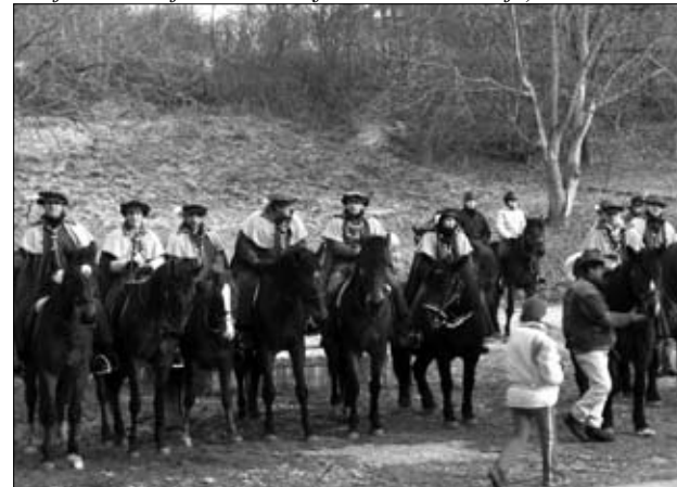
Konjeniki v svojih kostumih

Za pogostitev je poskrbelo in vse potrebno pripravilo Prostovoljno gasilsko društvo Miklavž pri Ormožu. Veselo vzdušje pa je ustvaril Ansambel Jeruzalem.