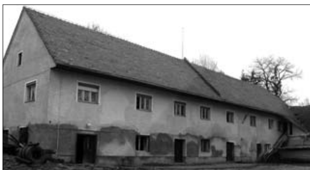
Pogled na obstoječi objekt z dvorišča