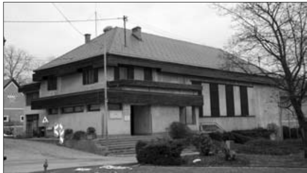
Kulturni dom z novo streho

Krajevna skupnost Ormož je v letu 2008 namenila okrog 160.000 € za investicije. Največ sredstev je porabila za ureditev pokopališča v Ormožu in na Humu, za dokončanje vaškega doma na Lešnici ter obnovo kulturnega doma v Ormožu.