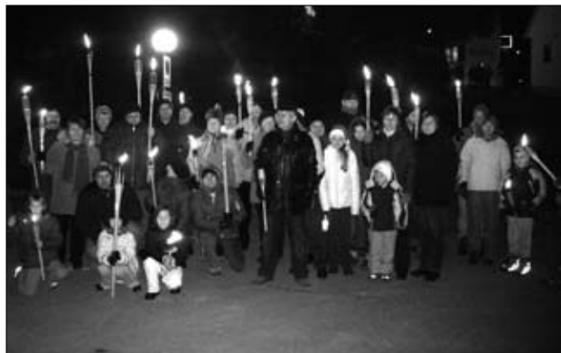
Udeleženci pohoda

Vsako leto nas je več, tako da je iz leta v leto živahnejše.