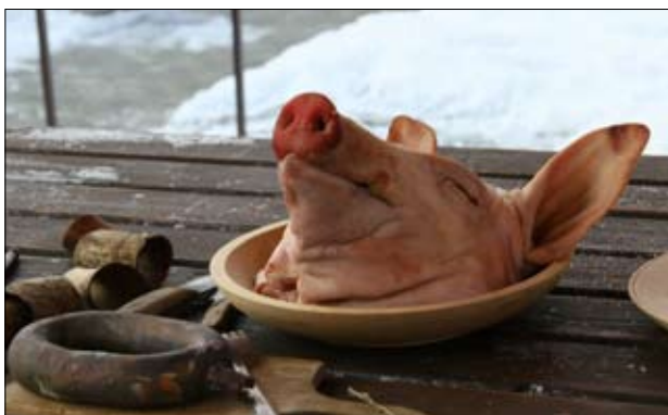
Stran 8-9: Antonovanje 2009