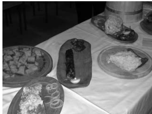
Ali se vam kaj cedijo sline?

Priprava tünke ter izdelovanje suhih salam in drugih suhomesnatih izdelkov. Predavanje je bilo hkrati tudi srečanje prašičerejcev, vsi prisotni pa so lahko ob pokušini, ki je sledila predavanju, tudi ocenili dobrote, o katerih je bilo govora.