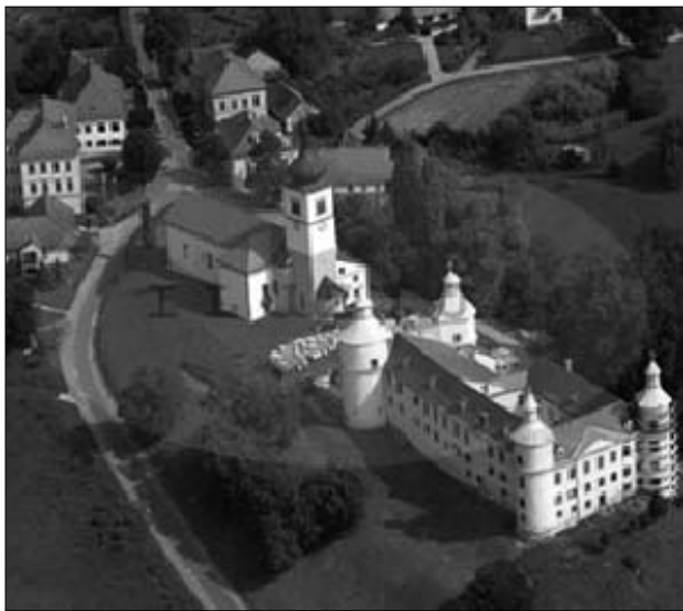
Velikonedeljski grad (iz zraka)