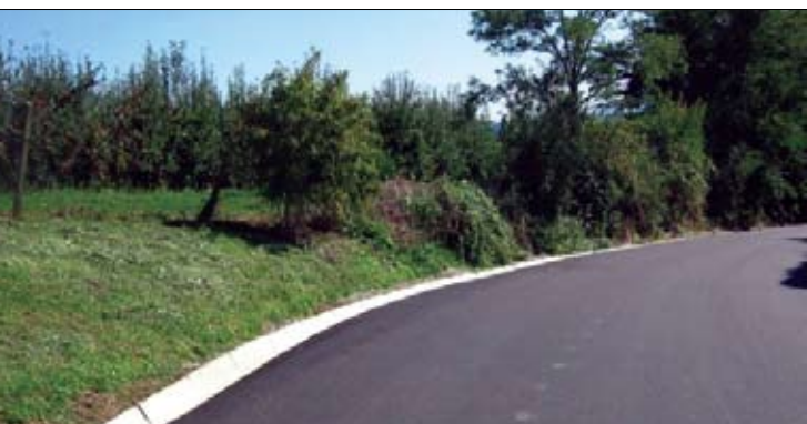
Stran 2 - 3: Iz občinske uprave: Realizirane investicije v Občini Ormož v letih 2007 in 2008