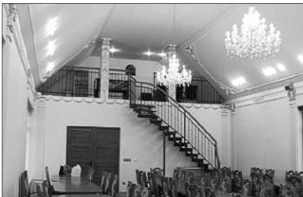
Notranjost dvorane

V zgradbi sta dve dvorani s spremljevalnimi prostori – med njimi tudi tri spalnice. Sicer pa sta najpomembnejši dvorani. V zgornji dvorani je 18 miz in 120 sedežev, spodnja - rdeča dvorana pa ima zaenkrat 300 sedežev. Dvorani bosta služili za različne namene. Tako je bilo v zgornji