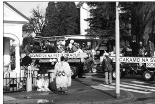
Skupinska maska na ormoškem karnevalu