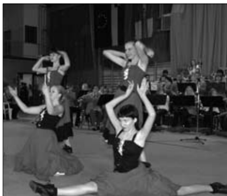
Plesalke iz dornavskega kluba