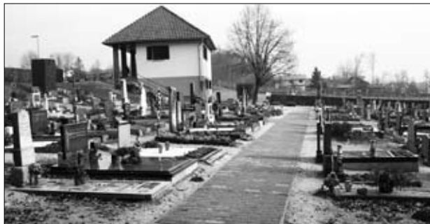
Tlakovana pot na pokopališču na Humu

Svet KS Ormož je na eni izmed svojih sej sprejel sklep, da se večji del sredstev za investicije nameni ureditvi pokopališč v Ormožu in na Humu. Junija 2008 sta bili podpisani pogodbi z IGD HOLERMUOS, d.o.o., ki je bila izbrana kot najugodnejši ponudnik. Na obeh pokopališčih so