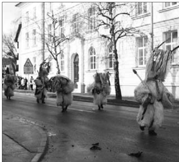
Ormoškega karnevala so se udeležili zgolj domači kurenti.