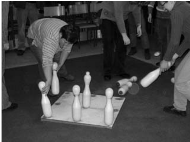
Tudi ženske so podirale