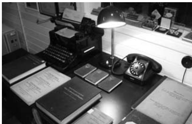
Delovna miza prometnika - nekoč