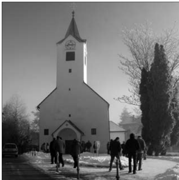
Farna cerkev

Antoniti so dolga leta v zgodovini skrbeli za bolne in obolele za boleznijo, ki jo je povzročala gliva rženi rožič. Zdravilo in zdravljenje sta vsebovala veliko izdelkov, ki so bili prašičjega izvora, in tako ima prašiček ob sv. Antonu tudi pozitiven predznak in ni zgolj prikaz nečistega duha, proti kateremu se je boril sv. Anton Puščavnik vse svoje izredno dolgo življenje.