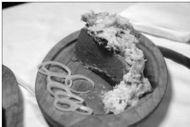
Domače, domače...

Zadnji dan, v nedeljo, se je odvijalo tisto glavno in pravo Antonovo žegnanje na Kogu. Že pred mašo so se proti sv. Bolfenku peš napotile skupine romarjev, nekateri celo iz kar precej oddaljenega Ljutomera. Kot vsako leto in že toliko let. Sproščeni pogovori na poti in sončno zimsko vreme so dali praznovanju poseben čar, marsikdo je lahko začutil energijo tistih starih romanj, ki jih je bil nekdaj deležen svetnik v farni cerkvi. Gostujoči duhovnik iz Veržeja je v zanimivi pridigi prikazal tudi drug pogled na antonovanje. Razložil je pomen sv. Antona Puščavnika, meniškega reda antonitov in vlogo prašička ob podobi svetnika.