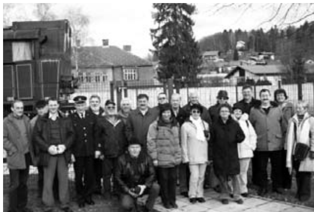
Udeleženci ogleda