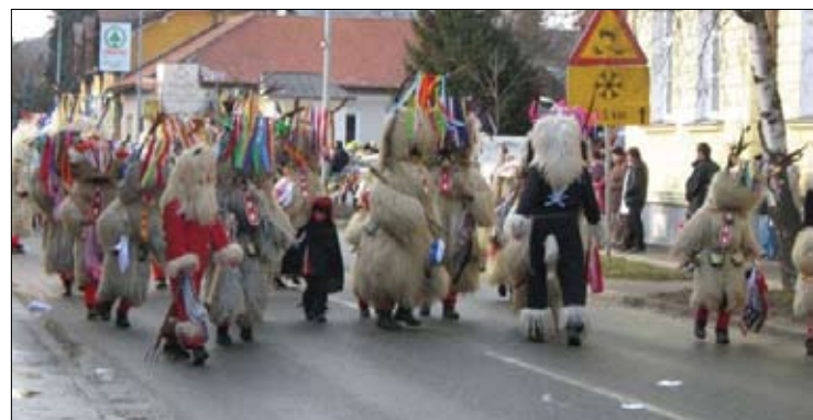
Stran 13: Tradicionalni ormoški »fašenski« karneval 2009