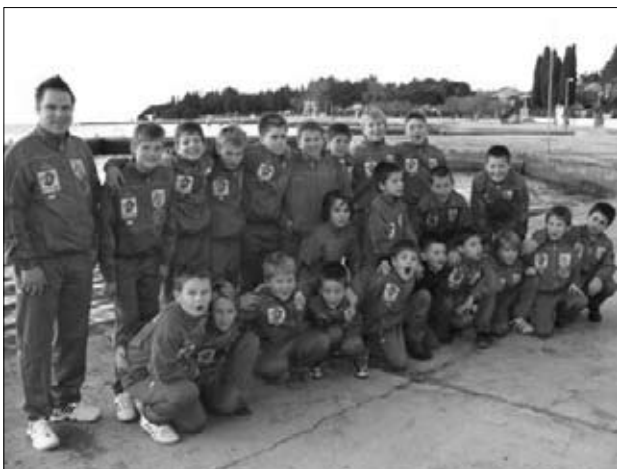
Poreč, december 2008.

V Rokometnem klubu Jeruzalem se v zadnjih letih zavedajo, da je treba posebno pozornost nameniti širitvi rokometu med mladimi. Tako pod okriljem RK Jeruzalem Ormož poteka organizirana vadba rokometu z mladimi. V želji, da bi zapolnili prosti čas naših otrok, so se v klubu