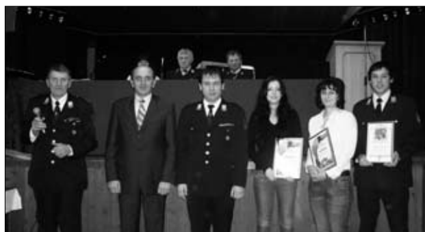
Dobitniki priznanj