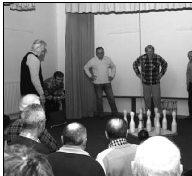
Glej, da bodo vsi padli!

Ženske ekipe pa so dosegle naslednje rezultate: