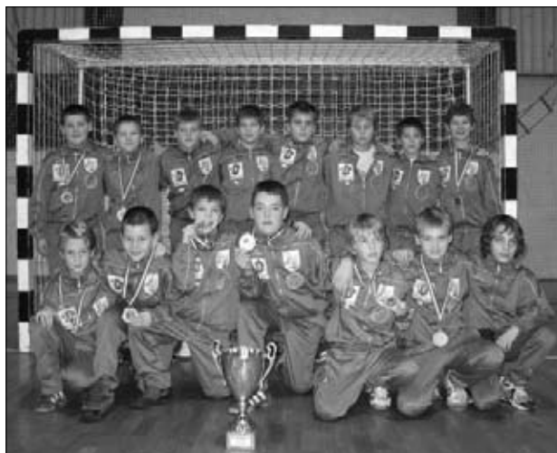
»Jeruzalemčki«, zmagovalci turnirja v Poreču, decembra 2008.