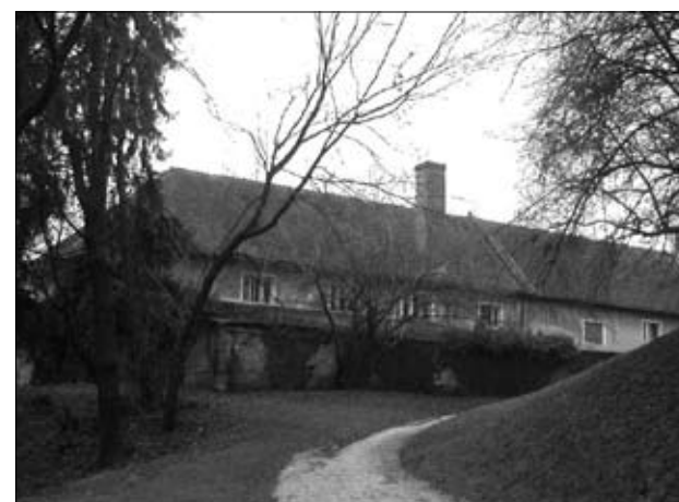
Pogled na obstoječi objekt iz parka

Nova glavna vhoda v muzej in glasbeno šolo povezuje nova skupna nadstrešnica, ki povezuje oba trakta in se navezuje tudi na zunanjo ureditev dvorišča pristave. Ta prostor je lep in izjemno pomemben za celotno zasnovo. Pristava ga s svojim razvejanim linearnim volumnom na vzhodni strani sklene, odpira pa proti naselju na zahodno stran. Proti jugu se prostor previje v glavno vstopno os gradu z lepo obstoječo krajinsko - spominsko ureditvijo. Dvoriščni prostor pristave bi s primerno zunanjo ureditvijo in z zasaditvijo lahko postal mesto druženja vseh uporabnikov in obenem omogočal izvedbo nekaterih letnih prireditev v zunanjem, amfiteatralno urejenem ambientu.