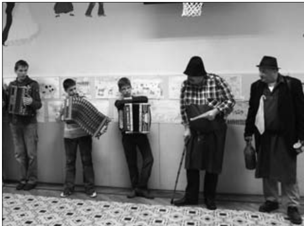
Na razstavi

nanj so bili povabljeni in so se odzvali vrtci, osnovne šole in Gimnazija Ormož.