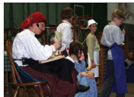
Babica pripoveduje...

Po miklavževanju se vsi pripravljajo na bo-