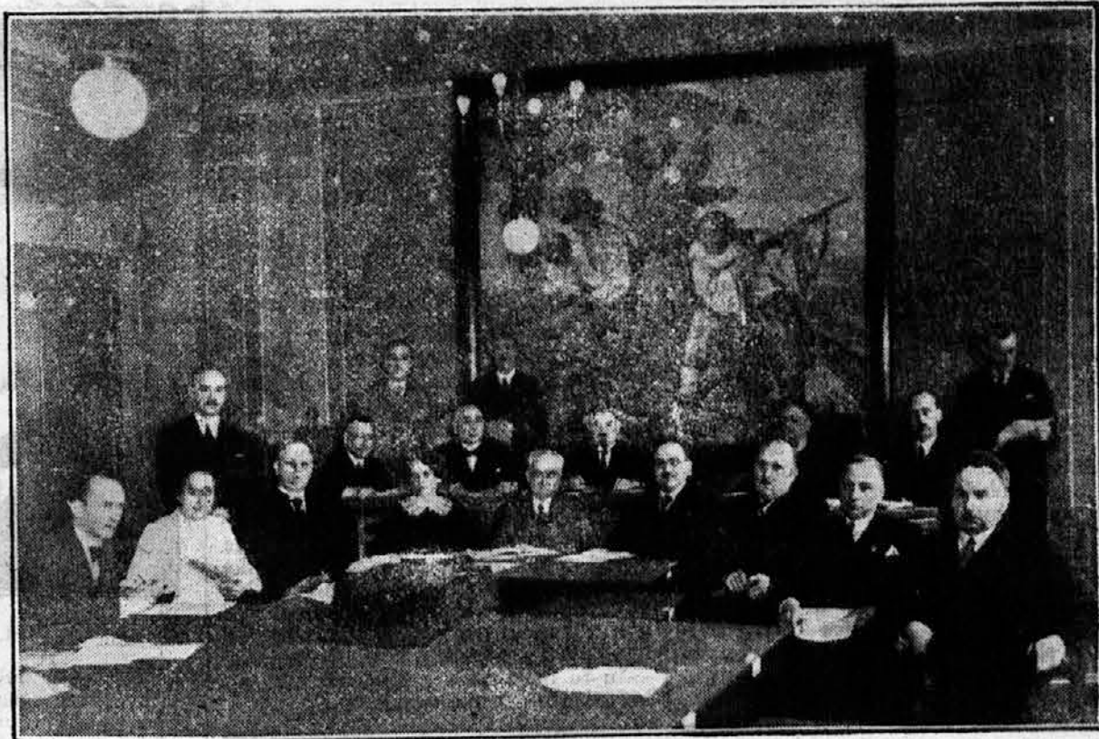
Sednica pretsedništva Saveza slovenskog Sokolstva u Tirševom domu u Pragu dne 9 o. m.