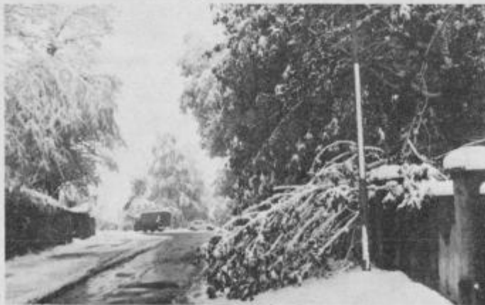
Ozelenelo drevje ni zdržalo teže mokrega snega

Takšno razdejavanje so za sabo pustili neznanci v Janžekoviči hiši v Zamušanih 77.