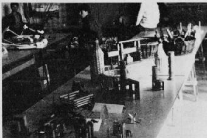
Z razstave izdelkov osnovnošolcev.

z novimi idejami izboljšati tehnologijo, s tem pa tudi samo proizvodnjo? Kajti le tako smo lahko v koraku z drugimi v svetu. To nas vse bolj sili, da moramo mladini, ki je v razvoju, nuditi,