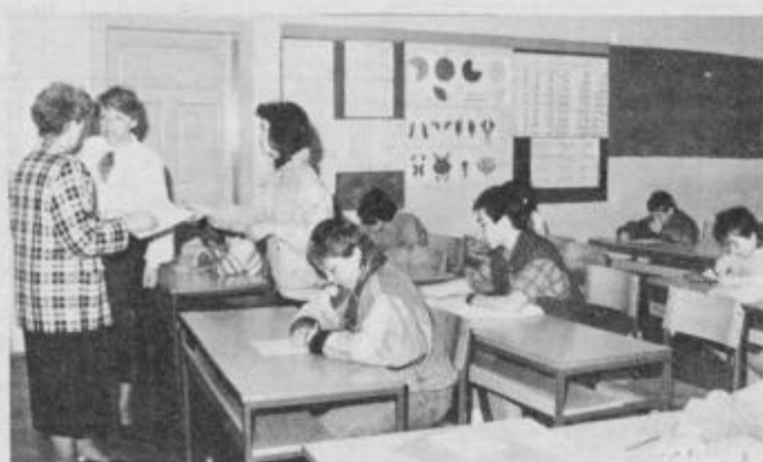
Med tekmovanjem vesele šole v enem od razredov na OŠ Olge Meglič v Ptuj.