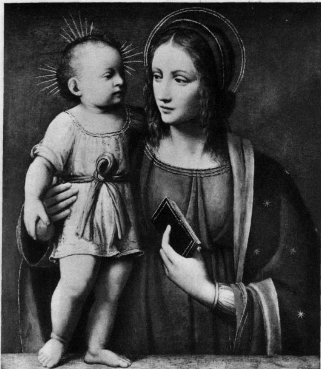
Mati lepe ljubezni.