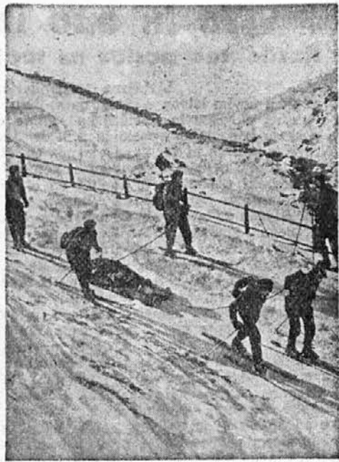
Smučarje, ki jih je zadnjič zasul plaz v Francoskih Alpah na pobočjih Palibiera, takole prevažajo v dolino.

Ministrstvo za telesno vzgojo ljudstva naj razdeljuje svoje podpore za razvoj športa po tehle načelih: