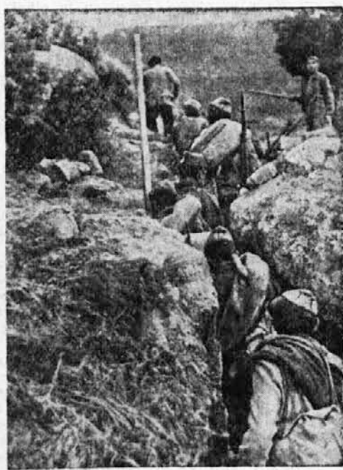
Francove čete, ki prodirajo nevzdržno proti Barceloni.

Ponedeljek, 16. jan.: Beograd: 20.10 Prenos evropskega koncerta iz Danziga — Praga: 21.10 Veseloigra — Sofija: 19.30 Beethovenove skladbe, 22.50 Koncert — Varšava: 22 Simfonični koncert — Budimpešta: 23 Salonski kvintet, 23.10 Cigani — Bukarešta: 21.20 Mozartove skladbe — Dunaj: 20.10 Opera glasba Torek, 17. jan.: Beograd: 20.30 Koncert komorne glasbe, 21 Narodna pesmi — Zagreb: 21 Koncert zabavne glasbe — Brno: 20.25 Koncert narodne glasbe — Praga: 19.30 Prenos iz opere — Sofija: 20 Beethovenove skladbe, 20.55 Rusko romanco — Varšava: 21 „Quo vadis — solisti, zbor in orkester — Budimpešta: 20.15 Koncert, 22 Klavirski koncert — Bukarešta: 21.05 Mozart: Requiem — Dunaj: 20.10 Pisan večer, 22.25 Brahmsove skladbe — Kölnsberg: 20.10 Pisan večer — Milan: 22.50 „Glami Schleich“, opera — Rim: 21 Simfonični koncert — Monakovo: 20.10 Veseloigra, 21.25 Godalni kvartet.