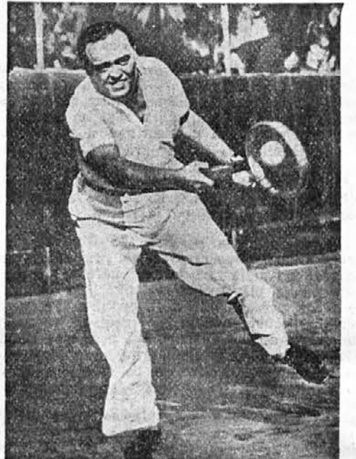
Šef ameriške policije Edgar Hoover, kadar se za trenutke otrese skrbi, kako bi ugnal gangstrske tolpe.