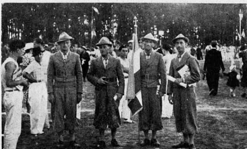
Naši zastopniki v Blois po sprevedu skozi mesto.

Nekaj čisto svojevrstnega so tekme godb, bobnarjev in trompet. Ker je bil telovadni in športni prostor zaseden, saj je tekmovalo v presledkih v vseh skupinah preko 8.000