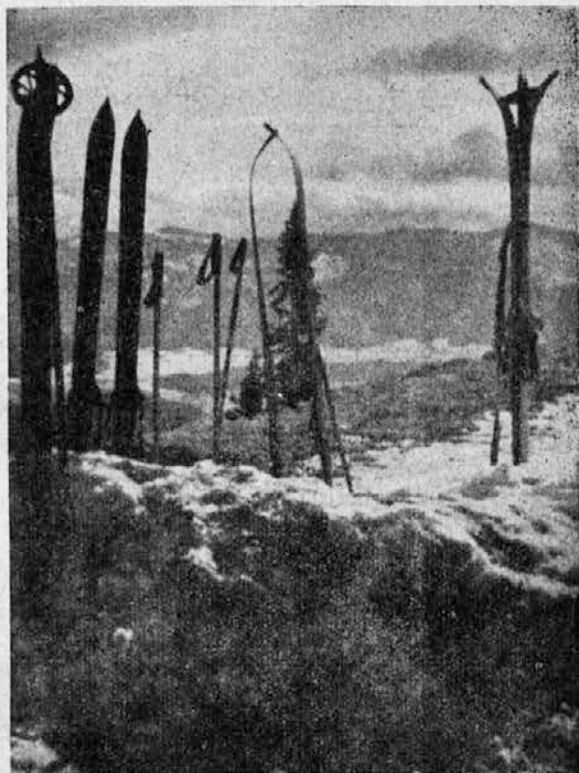
Smuk, smuk ...

Čez tri dni so tudi pri Bojančevih potrgali v obeh vinogradih, v onem pod Srobotnikom in tistem na Lipovcu. »Ne bodo se razsušili sodi,« je veselo uganil Bojanec po končani trgatvi. »Pijače za zmerno pitje bo dovolj za leto in dan.«