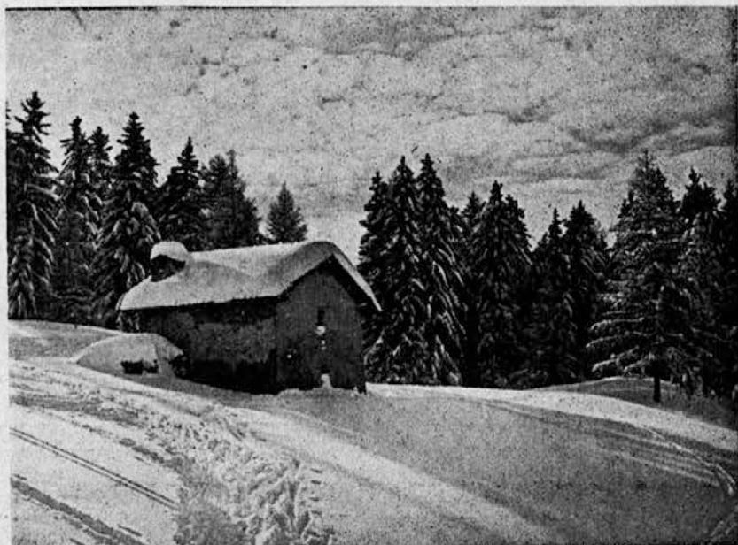
Gorska pokrajina v snegu.

Nadaljnje sadjarjevo delo v tem času je razredčevanje in obrezovanje sadnega drevja. Iz korenin in stebela sadnih dreves radi poženejo mladi poganjki. Odrežite jih tik ob korenini ali deblu, da spomladi ne poženo znova, kar bi slabilo rodno moč drevesa. Ozrite se nekoliko po krošnjah ali kronah! Ali niso morda preveč zarastle, pregoste? Za pravilno rast in dobro rodnost potrebuje drevo dovolj zraka, svetlobe in sonca. Pregosto zarastle veje povzročajo preslabo zračnost, pomanjkljivo razsvetljevanje in nezadostno obsevanje po soncu. V takšni mračni goščavi se rodi le pičel in malovreden drobiž. Seveda sadovnjak že sam po sebi ne sme biti pregosto zasajen, sicer je rodnost in donosnost vkljub dovolj razredčenim kronam slaba. — Torej sadjarsko žagico in oster nož v roke in na delo! Naj ti ne bo žal veje, ki je odveč. Preglej drevo od vseh strani in presodi, kje je krošnja pregosta in katere veje je najmanj škoda. Predvsem boš seveda odstranil vse suhe in poškodovane veje, pa tudi vse tiste, ki se drgnejo. Na takih mestih namreč nastajajo rane, kjer se naselijo razni sadni škodljivci, včasih se po-