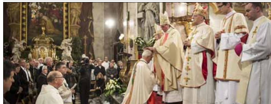
Polaganje rok in posvetilna molitev sta bistvena dela obreda škofovskega posvečenja in zakramenta sv. reda.