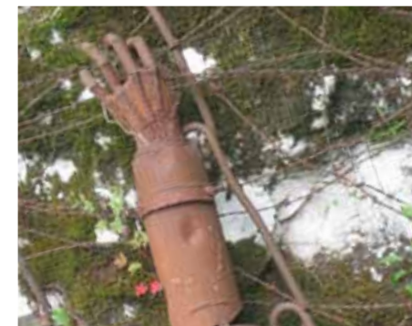
Roka iz ostankov granat, eden od spominov na prvo svetovno vojno