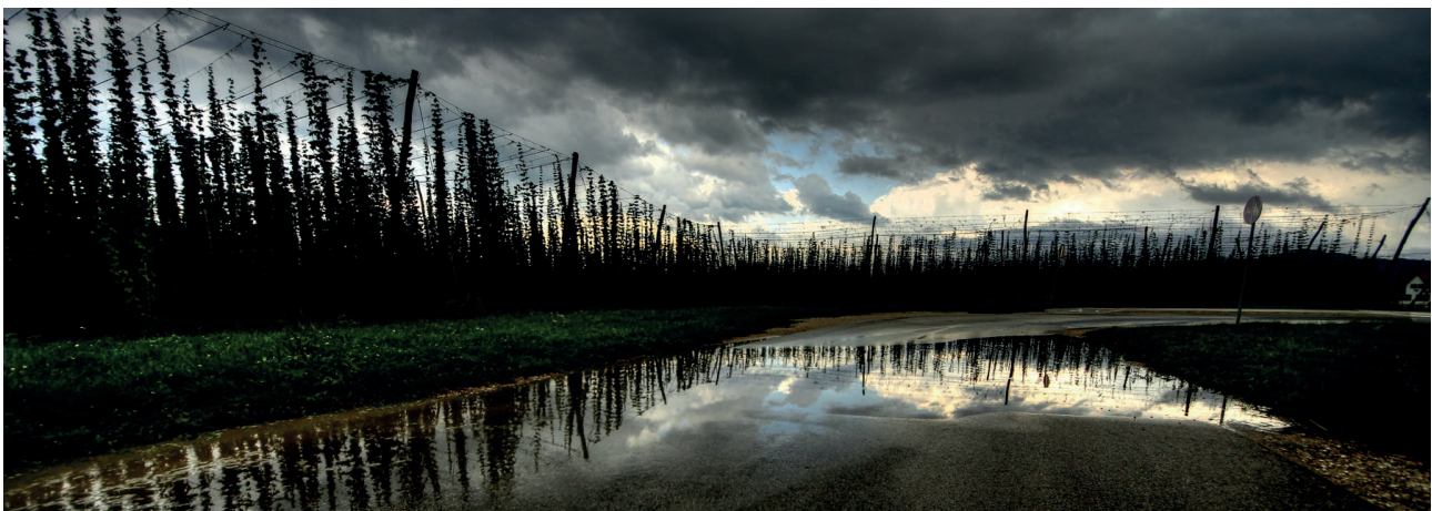
Med nevihto

Podrobnejše informacije iz tržnih poročil držav pridelovalk hmelja na jesenski seji IHGC so na voljo pri piscu članka.