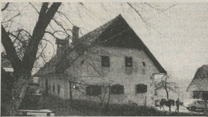
Vsem zavarovancem in bralcem »Kočevskih novic« želimo srečno novo leto 1990

Vse informacije boste dobili pri zavarovalnih zastopnikih, na predstavništvu v Kočevju ali na sedežu Območne skupnosti v Novem mestu.