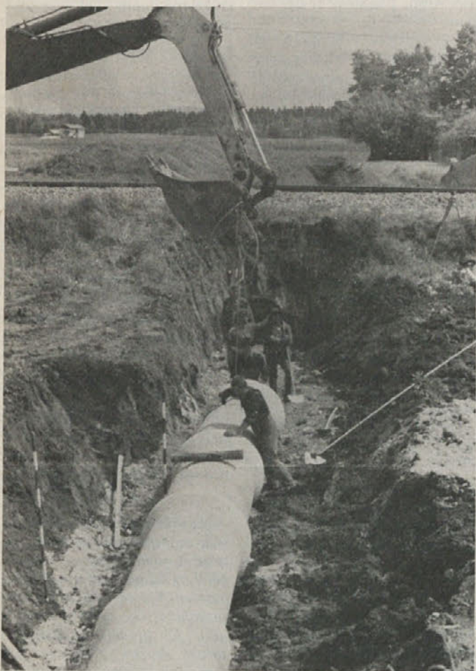
Izkop kanalizacije Stara cerkev—Kočevje