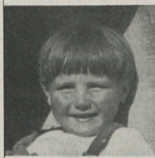
Objavljamo sliko novega občana za ugibanje.