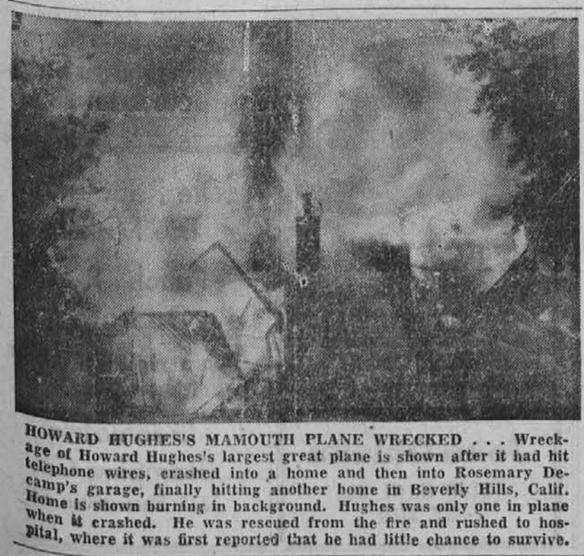
HOWARD HUGHES'S MAMMOTH PLANE WRECKED... Wreckage of Howard Hughes's largest great plane is shown after it had hit telephone wires, crashed into a home and then into Rosemary Demamp's garage, finally hitting another home in Beverly Hills, Calif. Home is shown burning in background. Hughes was only one in plane when it crashed. He was rescued from the fire and rushed to hospital, where it was first reported that he had little chance to survive.