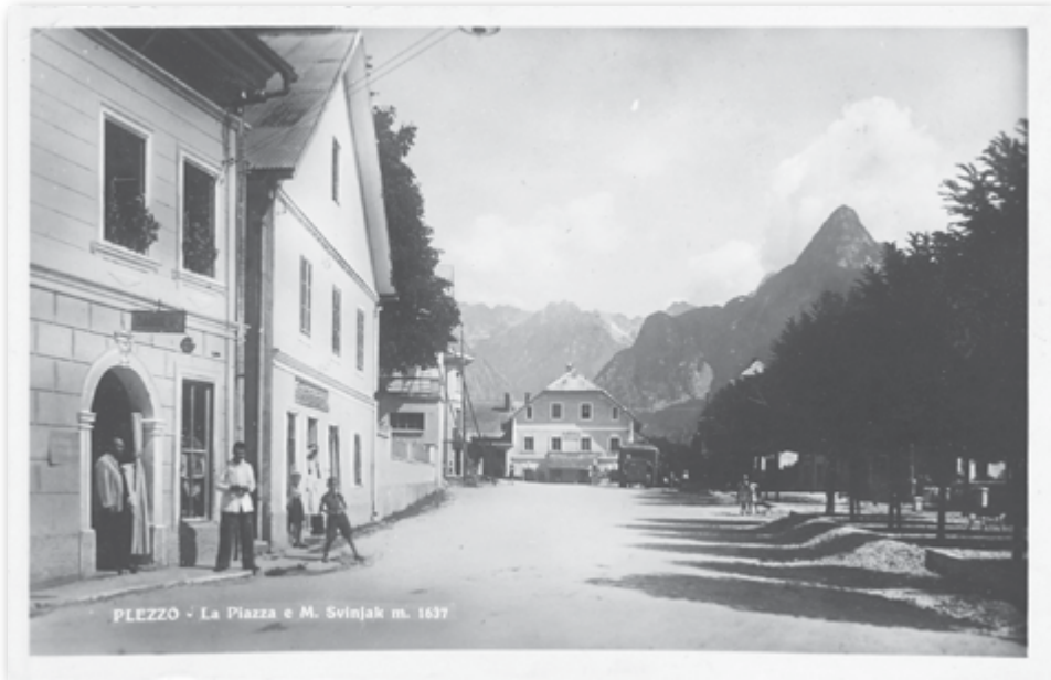
Slika 2: Bovec – glavni trg s parkom