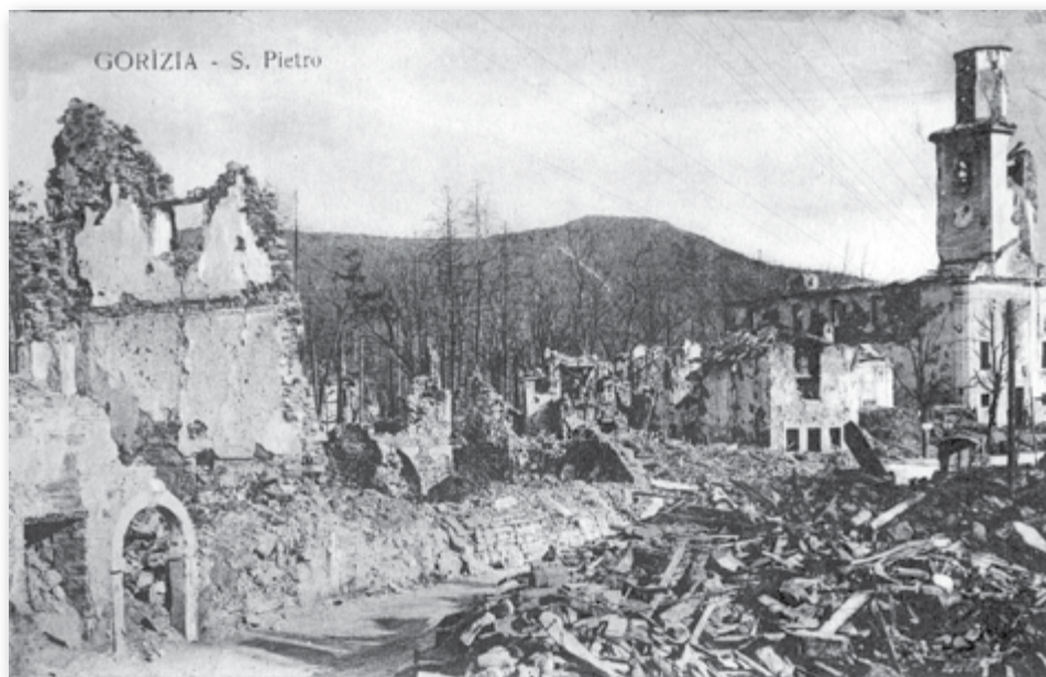
Slika 3: Šempeter pri Gorici - porušena glavni trg in cerkev Sv. Petra