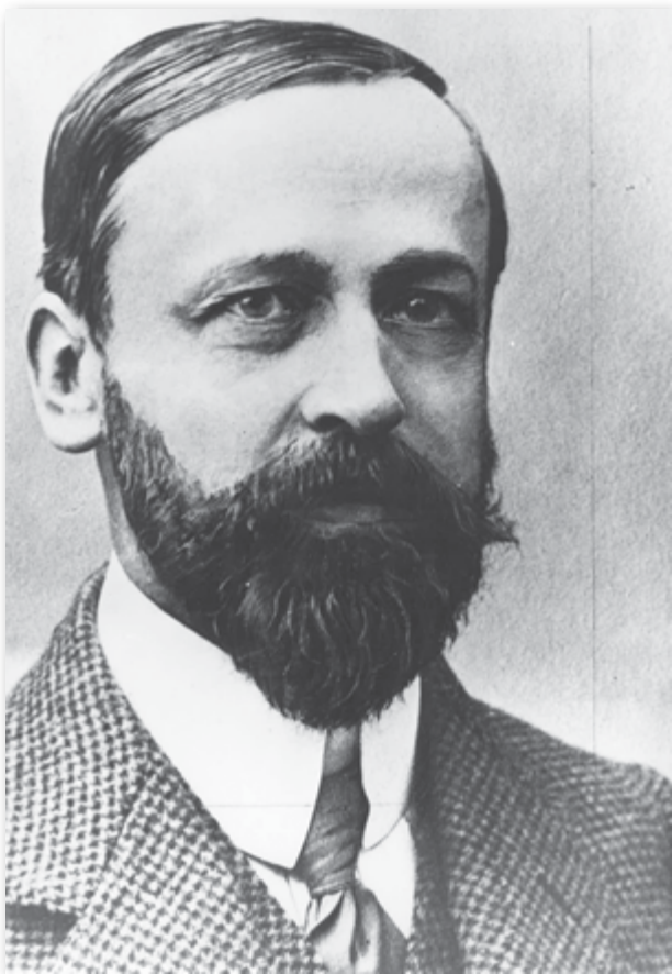
Slika 5: Maks Fabiani