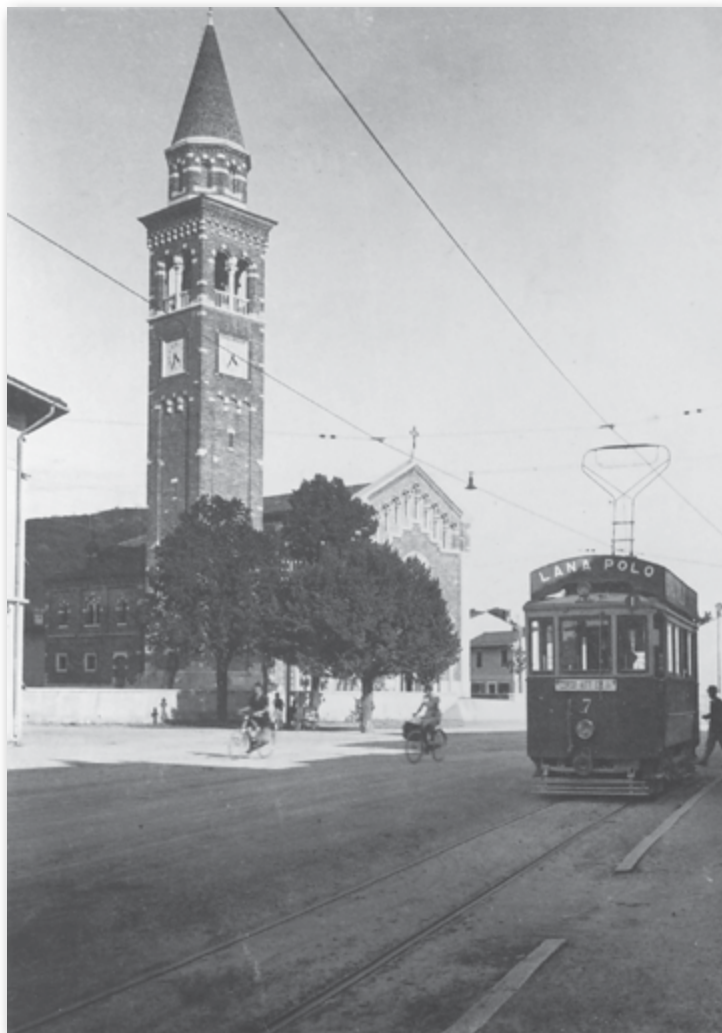
Slika 4: Šempeter pri Gorici - obnovljena cerkev in glavna ulica, 1933