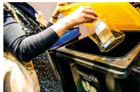
Ključni sta pravilna priprava in odlaganje odpadkov

Steklo je idealen material za recikliranje, ker se neskončno lahko uporablja za recikliranje in tudi po reciklaži obdrži barvo. Uporaba recikliranega stekla pomaga varčevati z energijo, pomaga pri izdelavi opeke, keramične proizvodnje, pomaga ohranjati surovine, zmanjša količino odpadkov, ki je poslana na smetišče. Steklo je običajno zelo enostavno reciklirati, ker je izdelano iz peska. S preprostim razbijanjem stekla in taljenjem lahko proizvedemo novo steklo, vsaka tona odpadnega stekla pa prihrani 315 dodatnih kilogramov ogljikovega di-