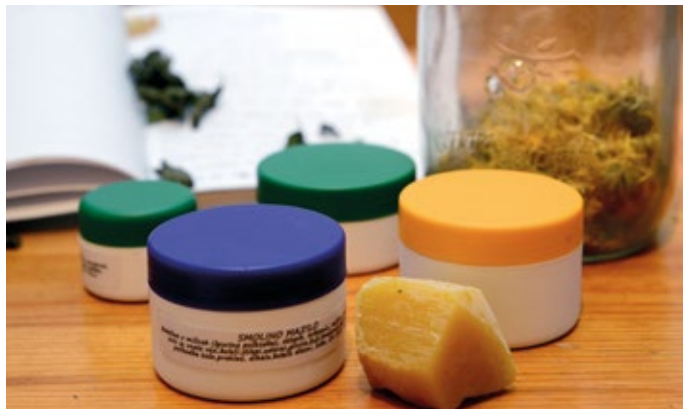
Rezultati domačega ustvarjanja

Kakovostno zeliščno mazilo vsebuje tri glavne sestavine: osnovno maščobo, utrjevalce in zdravilne rastline. V preteklosti so za osnovno maščobo uporabljali svinjsko salo ali sončnično olje, saj niso imeli tako obsežne izbire. Dandanes je ena izmed pogosto uporabljenih kokosova mast. Znano je, da se dobro vpija v kožo, jo mehča in v celični zgradbi vlaži in krepi tkiva. Pogosto posegamo tudi po oljčnem olju, saj se hitro vpija, vlaži kožo in zadržuje v njej vlago, ne da bi zamašilo pore, zato je primerno za suho in poškodovano kožo. Zelo cenjena so hladno stiskana olja, najboljše deviška, ki so za kožo še posebej blagodejna. Jojobino olje koži veča elastičnost,