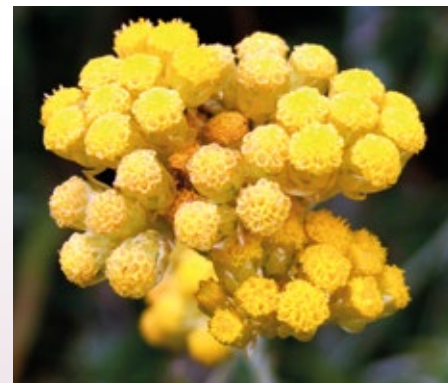
Cvet laškega smilja ( Helichrysum italicum ), ki so ga stari Grki imenovali »zlato iz sonca«.