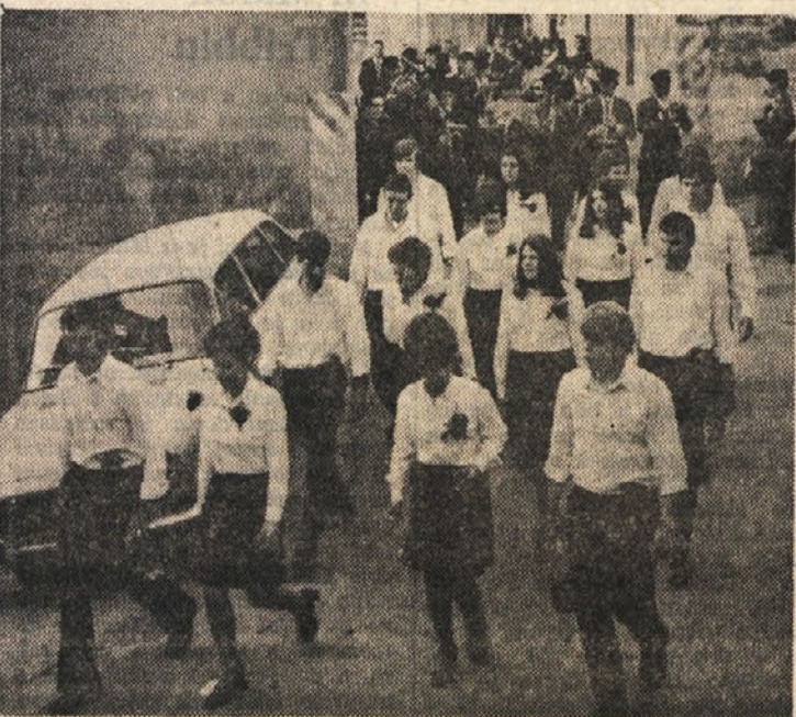
Parterji in partnerice korakajo z godbo skozi vas

Tudi letos so boljuncski fantje postavili «na Gorici» svoj «maj», dokaj malo enakega, ki je ob 15. zaigrala bogat program narodnih pesmi, koracnic in partizanskih udarnih. Takoj nato so se na drugem koncu vasi, na dolini, zbrali «partnerji» in «partnerice», osem fantov in prav toliko deklet. Posprenila jih je godba, ki je ob prihodu v središče vasi, kjer so igrala vesela koracnica.