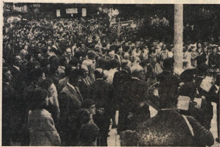
Velika množica na dolinskem trgu

V nedeljo se je v slovenskem Bregu obnovila starodavna tradicija «maja» v Boljuncu in dolinskih krajevih, praznik mladega rodu v najlepšem letnem času. Lepo vreme, sončni čepav ne preveč topli dan, je pridelalo v Boljuncu in Dolini veliko število ljudi s Krasa in iz mesta, da se je okoli vasi kar gnetlo avtomobilov in so bili dohodi vanje dejansko zaprti.