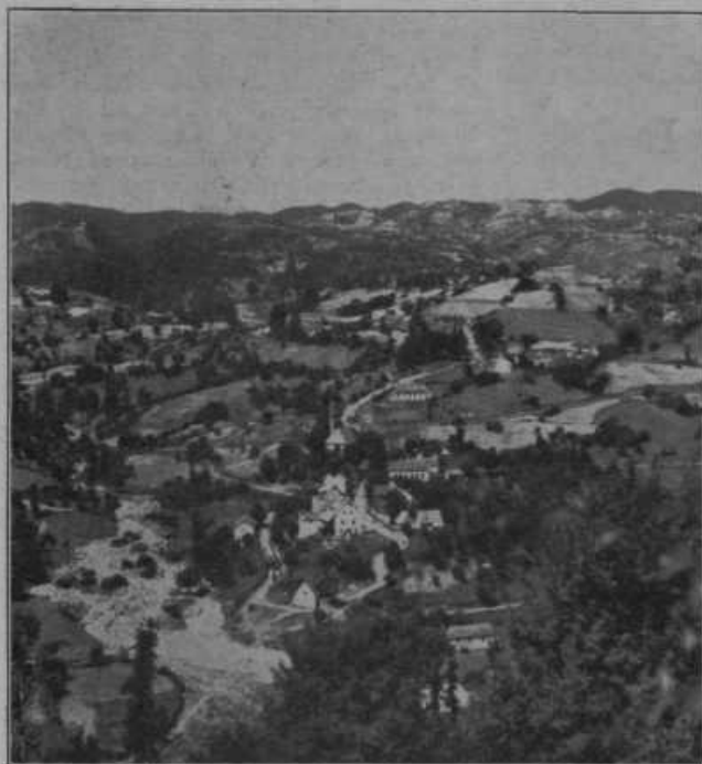
Ulog ob Neretvi v Hercegovini, lep in zdrav kraj v slikoviti dolini Neretve.

Prijateljstvo med živalmi. Če opazujemo živali, vidimo, da se iste vrste med seboj dobro marajo, različne vrste se pa sovražijo ali vsaj druga druge ne marajo. Povsod so to opazovali, pri vseh živalih in so skušali razne vrste živali vzgojiti tako, da bi vsaj druge drugo marale. Malokdaj se je to posrečilo. Le narava je tu pa tam sama poskrbela za to. V naših krajih taki primeri celo niso redki. Videli smo, kako so se mladi psi igrali z mladimi mačkami in niso redki taki primeri. Iz mladostnih skupnih igralcev so nastala živalska prijateljstva, ki so trajala mnogo let. Zgodilo se je nekoč, da je gospodar vrgel ostarelo in bolno mačko v vodo, da bi utonila, pa je pes skočil za njo in jo rešil. Pri psih in mačkah je prijateljstvo že vsakdanje. Malo nenavadno je prijateljstvo med psom in teletom. Nekaj nenavadnega pa je, da krava doji prasiče. In vendar je naša slika napravljena po resnični fotografiji.