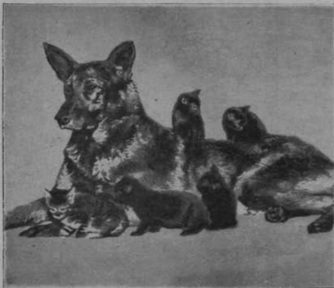
Pes z mladimi mačkicami, ki se igrajo in grejejo pri njem.

Prijateljstvo med živalmi. Če opazujemo živali, vidimo, da se iste vrste med seboj dobro marajo, različne vrste se pa sovražijo ali vsaj druga druge ne marajo. Povsod so to opazovali, pri vseh živalih in so skušali razne vrste živali vzgojiti tako, da bi vsaj druge drugo marale. Malokdaj se je to posrečilo. Le narava je tu pa tam sama poskrbela za to. V naših krajih taki primeri celo niso redki. Videli smo, kako so se mladi psi igrali z mladimi mačkami in niso redki taki primeri. Iz mladostnih skupnih igralcev so nastala živalska prijateljstva, ki so trajala mnogo let. Zgodilo se je nekoč, da je gospodar vrgel ostarelo in bolno mačko v vodo, da bi utonila, pa je pes skočil za njo in jo rešil. Pri psih in mačkah je prijateljstvo že vsakdanje. Malo nenavadno je prijateljstvo med psom in teletom. Nekaj nenavadnega pa je, da krava doji prasiče. In vendar je naša slika napravljena po resnični fotografiji.