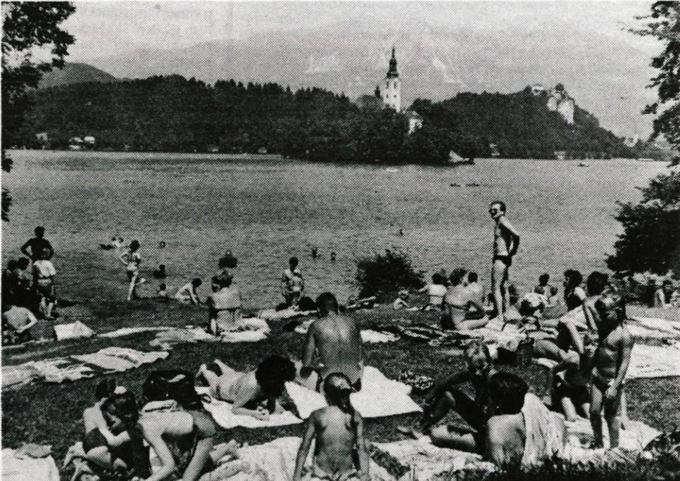
Bled, 26. julija - Pasji dnevi so minuli vikend na bregove Blejskega in Bohinjskega jezera, Šobčevega bajerja in drugih kopalšč po Gorenjskem privabili na desetisoče osvoboditve željnih kopalk in kopalcev. Naša fotografija je nastala predčerašnjim, motiv na njej pa je kot s katere od prelepih razglednic Bleda.