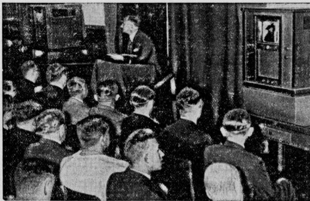
Gledanje na daleč. V Berlinu so te dni poskusili aparate, ki omogočajo, da ljudje v zaprti dvorani gledajo, kaj se godi v drugi dvorani, ki je 20 km daleč.

Brž so privlekli ciganske vozove in iz njih napravili štirikot. Nato so se na vozeh oglasile gosli in piščali, ki so igrale poskočne pesne melodije. V štirikotu med vozovi pa sta se začeli vrteti obe ciganki. Dvoboj je trajal celih šest ur, dokler se ena izmed zaljubljenk ni vsa onemogla zgrudila na tla. Takoj je pristopil poglavar, prijel »zmagovalko«, ki je tudi komaj stala na nogah, ter jo peljal ženinu. Poroko so kar po cigansko takoj opravili in slavili.