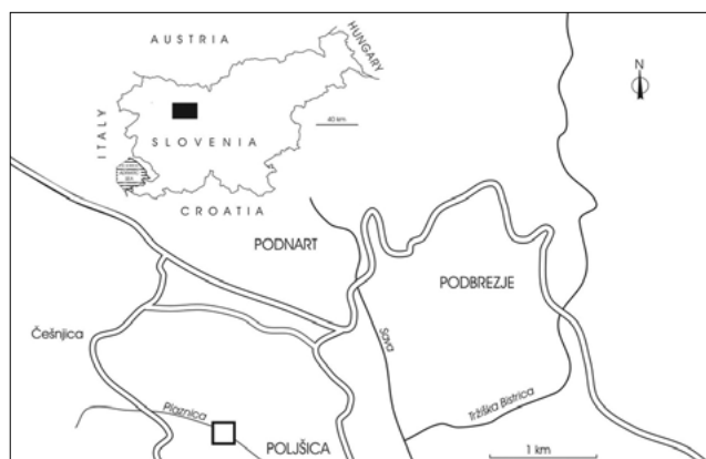
Sl. 1. Položaj najdišča zob morskih psov pri Poljšici Fig. 1. Location of site of shark teeth near Poljšica

MORLOT (1850: 393, Fig. 1) predstavlja geološki profil, ki poteka tudi skozi Rovte in Poljšico pri Podnartu. V profilu med omenjenima krajema pogledajo v podlagi poljšički »eocenski skladi«. MORLOT (1850: 397-398) znova omenja kraje Rovte in Poljšico ter z njima povezane peščene laporovce, peščenjake s koralami in poljšičke plasti s številnimi fosilnimi ostanki. Korale, školjke, polže in foraminifere vzporeja s fosilnimi ostanki Gornjega Grada. LIPOLD (1857: 223) poroča, da izdanjajo eocenske plasti z bogato fosilno vsebino v grapi med Poljšico in Rovtami. Večina organizmov