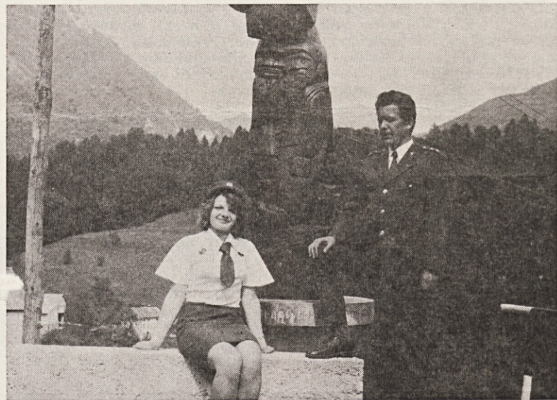
Člana naše gasilske organizacije pri spomeniku kjer je nastal prvi slovenski film »Na svoji zemlji«