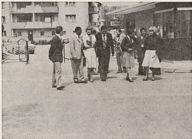
Sprejem gosta iz Tanzanije pred vhomom v tovarno

sam sistem poslovanja v novih pogojih gospodarjenja se je celotna delovna organizacija temeljito pripravljala že v teku meseca marca. Novi zakon predvideva stroge sankcije za nespoštovanje predpisov.