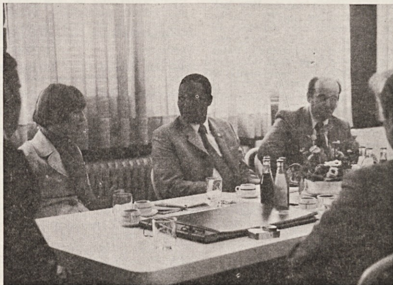
Razgovor gosta iz Tanzanije z organi upravljanja in vodilnimi delavci, kako pri nas uresničujemo delavsko samoupravljanje

Očitno je, da je splošna gospodarska situacija, tako v domovini kot tudi v tujini, še ve-