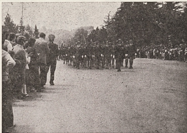
Gasilci iz Slovenije so na dan gasilskega kongresa v Novi Gorici manifestirali svojo masovnost in organiziranost

ki primeri, ko je naša država predmet napadov raznih reakcionarnih sil, ki hočejo razvednotiti naš narodno osvobodilni boj, politiko ZK, češ da naša pot v socializem ni prava, razglašajo, da ne more biti demokratičnega upravljanja v nestrankarskem sistemu, zagovarjajo politiko državne prisile, etatizma itd. Drugi spet ugotavljajo, da je samoupravljanje utopija, češ da naš človek zanj ni zrel in vsiljujejo znano tezo centralističnega vodenja gospodarstva kot edino učinkoviti sistem upravljanja v družbi. V našem nenehnem prizadevanju za uveljavitev vloge delovnega razreda se vsakodnevno srečujemo z ljudmi raznih barv in miselnosti. Nekateri so takšni, da ne želijo dobro našemu delovnemu človeku, ki je ustvarjalec družbenih dobrin. Drugi imajo za cilj razbiti enotnost naših narodov in narodnosti, še zlasti obrambno moč naše države in trdnost gospodarstva. Živimo v času, ko se zahteva odgovornejši odnos do vseh teh pojavov, ki so usmerjeni na izpodkopavanje našega gospodarstva in delavske samouprave. Za zaščito naše ekonomske in družbene ureditve ter krepitve vloge delavskega razreda nas kongresni dokumenti ZKJ obvezujejo, da se vse pozitivne sile postavijo po robu vsemu, kar je tujega socializmu. Za zaščito teh interesov imamo dve komponenti t. j. splošni ljudski odpor in družbeno samozaščito. O teh komponentah se mnogo piše in govori, toda še vse premalo se na tem področju konkretno dela.