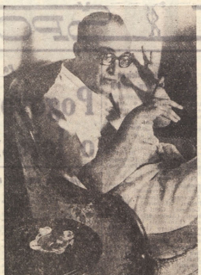
Ben Josef, ki kot tunizijski politik uživa azil v Egiptu, predstavlja srboljubno spornost med Egiptom in Tunizijo. Bil je vodja nepopolitizirane struge med Egiptom ter tako prišel nazvrat v Burgijo.