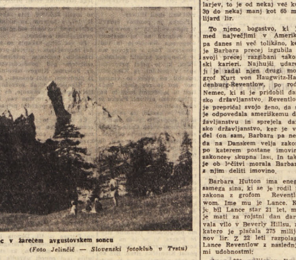
Jalovec v žarečem avgustovskem soncu