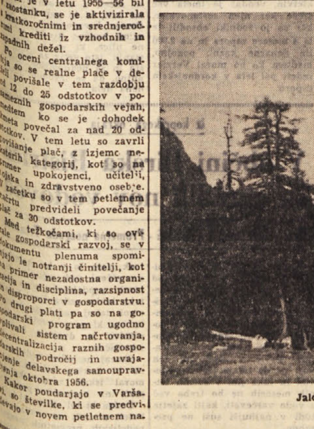
Jalovec v žarečem avgustovskem soncu