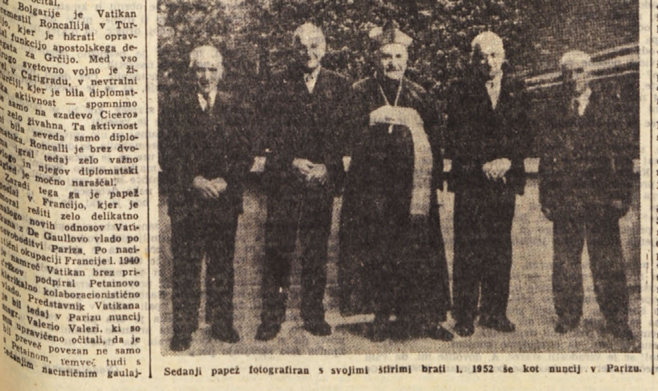
Sedanji papež fotografiran s svojimi štirimi brati l. 1952 še kot nuncij v Parizu.

LONDON, 29. - Edimburški vojvoda je odpotoval iz Londona v Kanado na letalu »Cometa«, letal, s katerim je odpotoval edimburški vojvoda, je odletelo iz Londona z 1. uro in 20 minut zamude, ker se je en motor pokvaril.