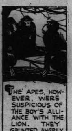
THE APES, HOWEVER, WERE SUSPICIOUS OF THE BOY'S ALLIANCE WITH THE LION. THEY GRUNTED ANGRILY.

Džungelsko življenje je v dečku ubilo omiko in razkrilo živalski nagon, ki spi v človeškem srcu.