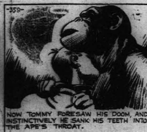
NOW TOMMY FORESAW HIS DOOM, AND INSTINCTIVELY HE SANK HIS TEETH INTO THE APE'S THROAT.