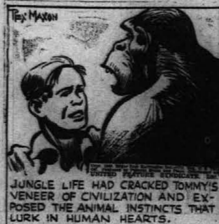
JUNGLE LIFE HAD CRACKED TOMMY'S VENER OF CIVILIZATION AND EXPOSED THE ANIMAL INSTINCTS THAT LURK IN HUMAN HEARTS.