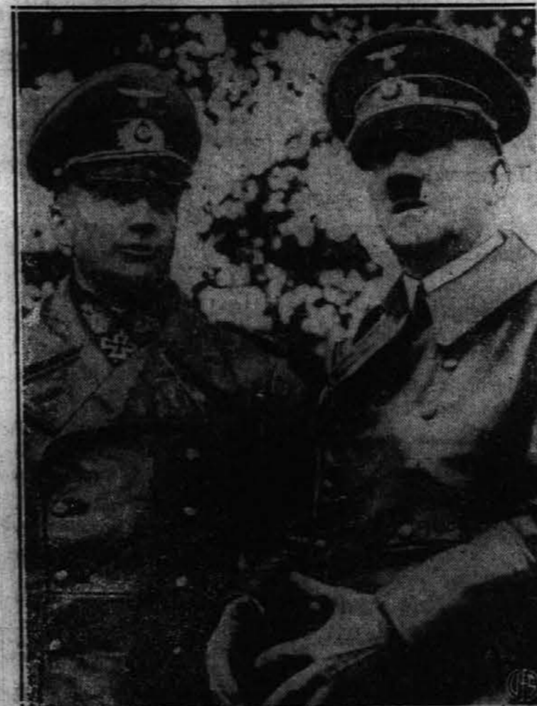
Hitler (na desni) je nedavno proglasil, da bo v naprej on sam, osebno, poveljeval nemškim armadarn. S tem je prevzel mesto generala von Brauchitscha, s katerim ga kaže gornja slika.