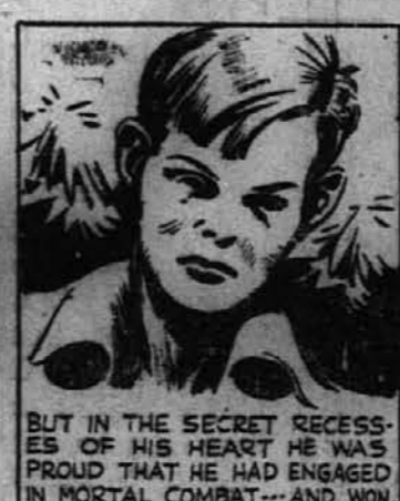
BUT IN THE SECRET RECESSES OF HIS HEART HE WAS PROUD THAT HE HAD ENGAGED IN MORTAL COMBAT--AND WON.