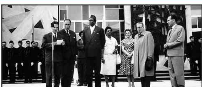
Modibo Keita