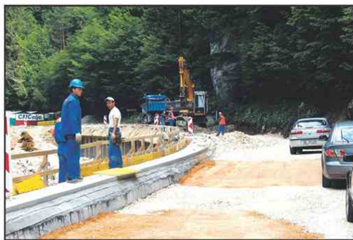
Cesto proti Lučam posodablja že več kot 10 let.

vsak dan vozi od 10 do 20 tisoč vozil in na katerih so težavna predvsem križišča. Na cesti Velenje-Arja vas so in bodo za zdaj izvajali samo dela, s katerimi bodo povečali varnost, saj bi bila večja vlaganja ob izgradnji 3. razvojne osi nesmiselna. Cesto Nazarje-Gornji Grad direkcija že nekaj let obnavlja po etapah, za letos je na njej predvidena obnova ceste v Bočni. Na območju občine Nazarje sta aktualna dva odcepa, ki ju