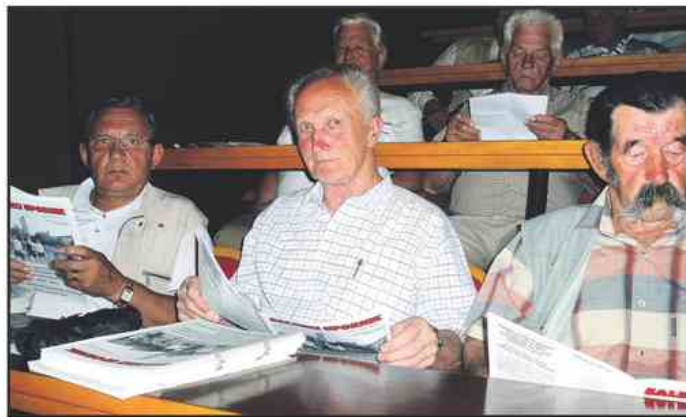
Utrinek z borčevske skupščine

plošč, 10 spominskih razstav, 9 doprskih kipov in en kenotaf. Nujno bi bilo treba obnoviti, kot je bilo rečeno, tri spominska obeležja, osrednjega v Vinski Gori, v Šmartnem v Velenju in v bližini cerkve sv. Jakoba v Podkraju.