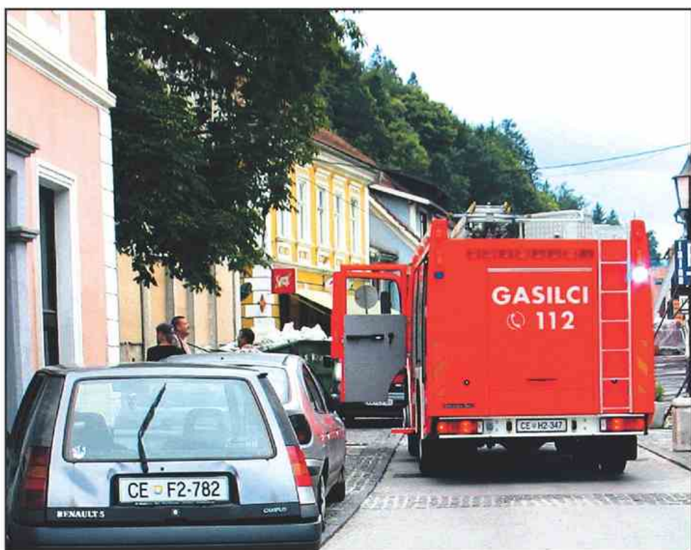
Gasilci so bili takoj na kraju požara