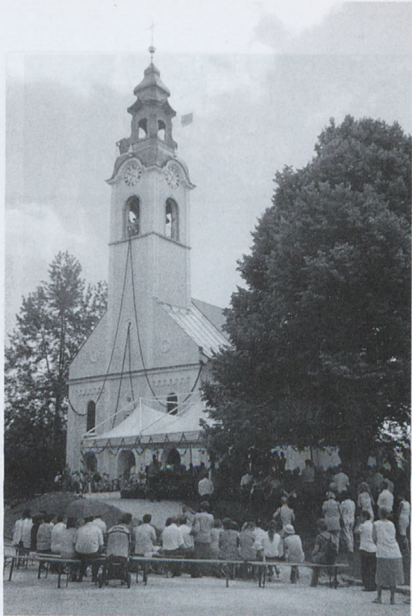
Obnova in blagoslovitev oskrunjene cerkve sv. Urha dne 17. junija leta 2007