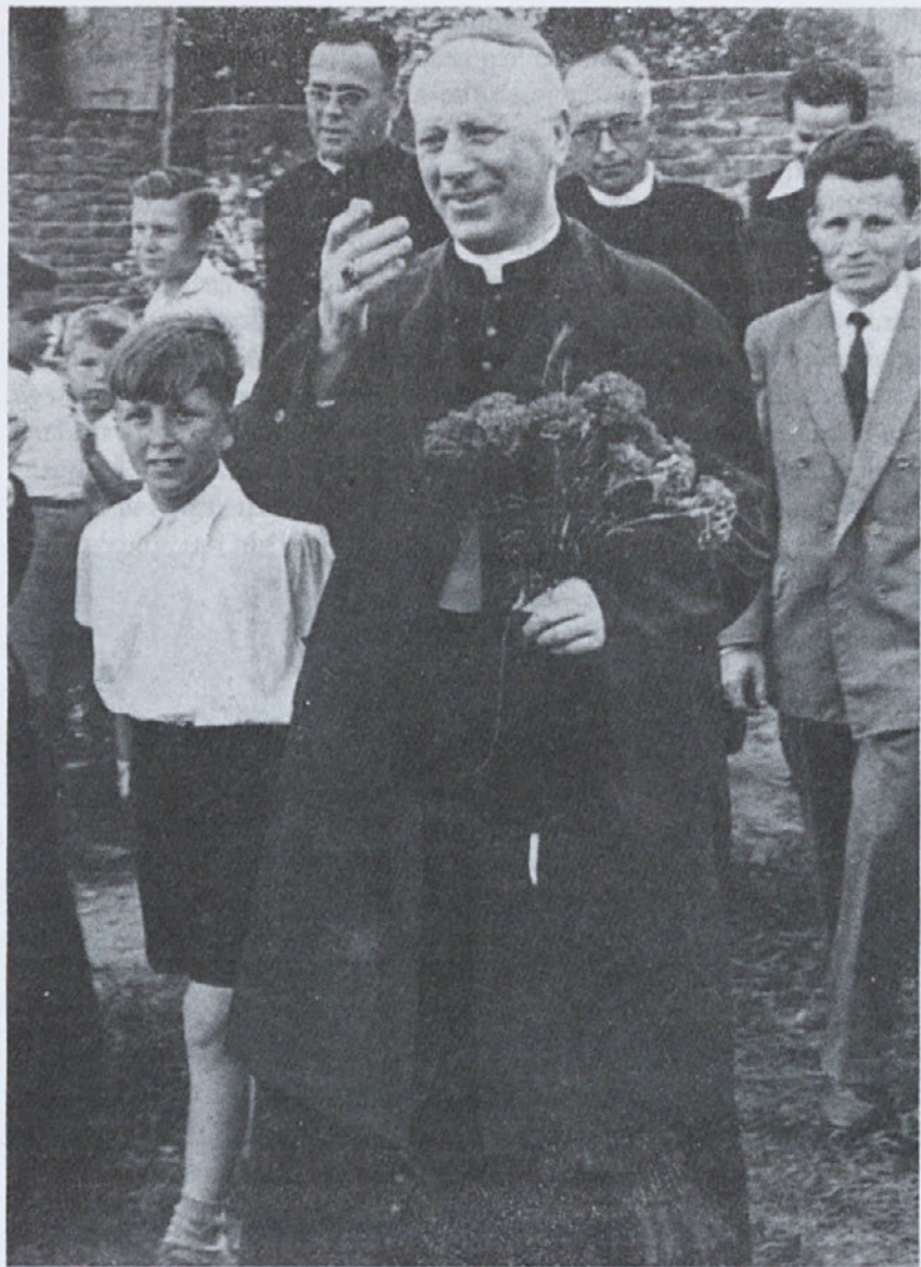
Obisk v Argentini