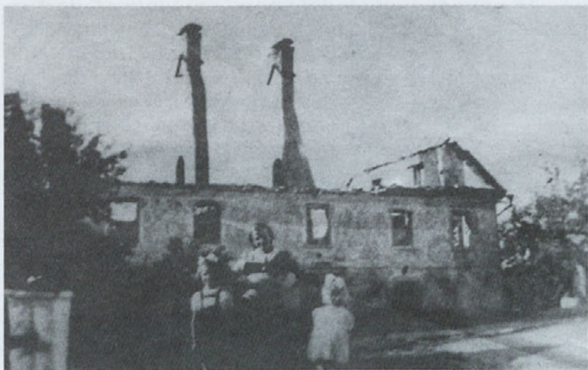
Župnišče v Stopiĉah so poŹgali partizani septembra 1943

Divjanje revolucije je v Źupniji povzroĉilo straŹno gorje.