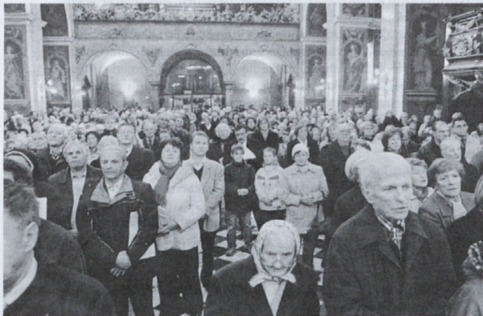
Spominu na škofa Rožmana so se prišli poklonit številni Slovenci