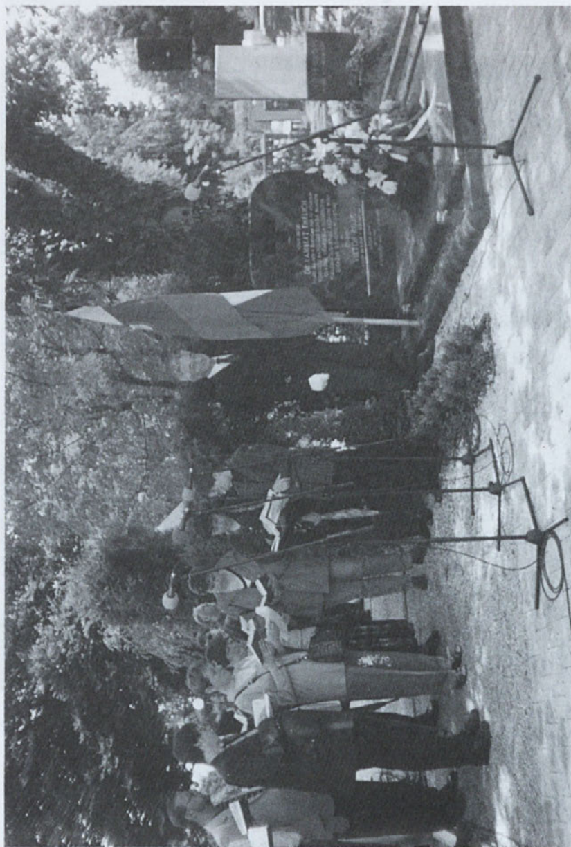
Ob Erlichovemu grobu, junij 2000