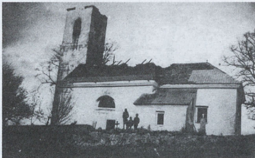
Cerkev sv. Kozme in Damijana v Dolžu so partizani (skupaj s šolo) požgali 5. decembra 1942

domoljubi. Komunisti pa so po zasedbi Slovenije te naše duhovnike strpali v zapore, nekatere pa so poslali v delovna taborišča. Če bi mogli govoriti stavbni bloki na Žalah v Ljubljani, bi povedali, kaj je bilo tam trpljenja, zaničevanja, ponižanja in zmerjanja teh ubogih trpinov duhovnikov. Vse zato, da bi vernike laže odvrnili od cerkve, ker bi prikazovali te bedne trpine.