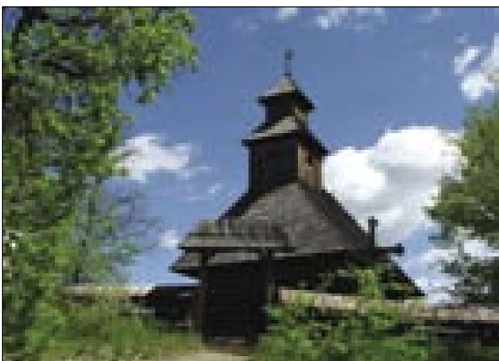
Cerkev z Mándoka stogi gnes v Szentendre

živejo, »Rusinko« tö zovejo. Devetstau gezero Rusinov žive med Polsko, Slovaško, Ukrajino pa Romanarsko, depa je najdemo na Vogrskom v županijaj Borsod-Abaúj-Zemplén pa Szabolcs-Szatmár-Bereg, pa na Rovačkom in v Srbiji tö. Prejk maurdja je geste šeststau gezero, najbolje eričen Rusin je venak moderni merkanarski molar Andy Warhol. Un se je že v Meriki naraudo, depa s svojov materdjov se je vogrski pa rusinski pogučavo.