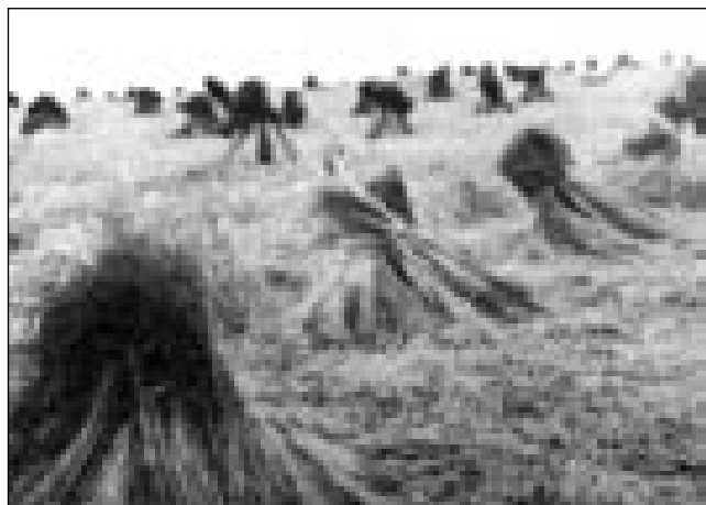
V taše püšle so len zvezali, gda so ga vöposkübli

»Ka pa ge tau vej. Vejn zato, ka zdaj je že vse bola moderno, dapa nam je te tistoga reda dobro bilau. Vejn zato, ka te drugo nej bilau. Ponjave plastične delajo, za lijen pa za gvant že bola fino blago nücajo. Z lenom je strašno dosta delo bilau, dočas ka ponjava ali lijen grato. Mlade bi gnesden ešče vrag nej nanjé vzejo, ka naj takšno kaj delajo, pa ranč bi nej znali. Dapa po mom pameti tisti svejt je baukši biu, kak je zdaj. Ka zdaj mladina dela, samo silo ma, pa v krčmau odi, nika drugo nega. Tau prvin nej bilau. Prvin so podje šli kauli po izaj. Pri meni so tō dostakrat ojdli. Moj oča je te več nej živo, pa podje so se v tašo mesto bola pokisili titi, gde nej bilau moškega, zato ka nej se njim je trbelo bojati. Mati, stara mati so spale, mi smo pa karte špilali ali kaj dru-