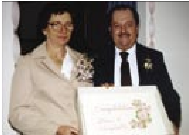
Takšno torto sva dobila, gda sva se zdavala.

Moj človek je odišo delat, kamion je vozo, zatok ga dostafart dva-tri dneva nej domau bilau. Tau je sreča bila, ka se je njegov starejša sestra tō v Bethlehemu držala, nej daleč od nas, pejški sam leko do njé išla. Ona je (u)devica bila pa že v penzioni, tak je dosta časa mejla. Po cejlom va-