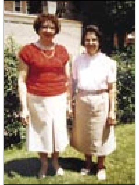
S šaugorcov v Bethlehemu