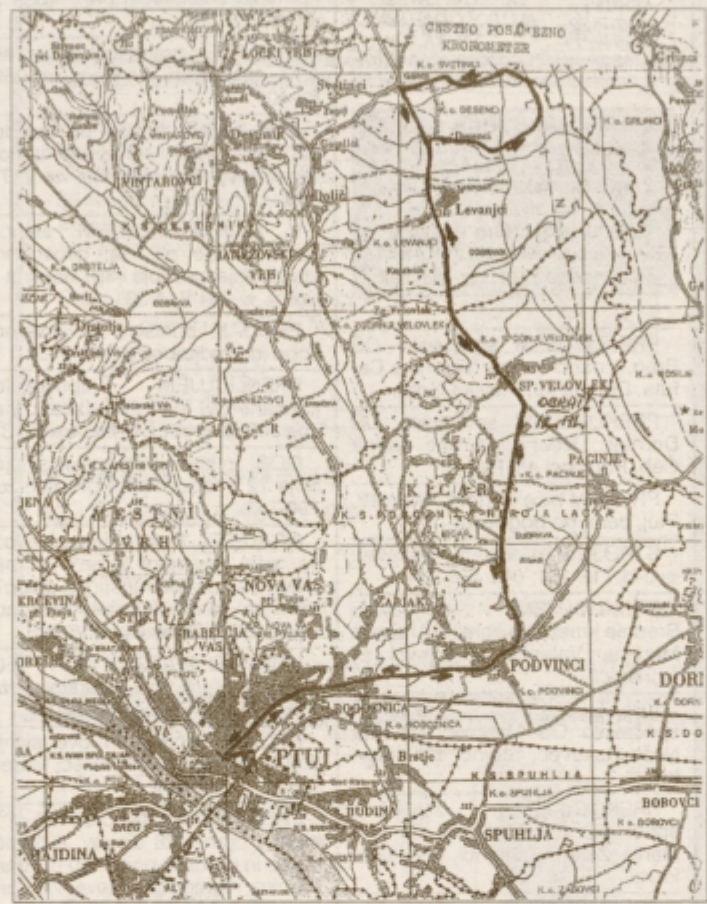
Skica dirke na kronometer