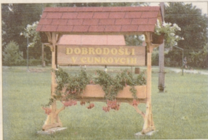
Urejenost Cunkovcev je dobra, vaški kozolec pa prijetno opozori nase