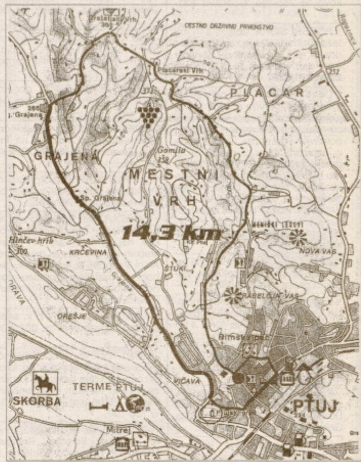
Skica dirke za državno prvenstvo