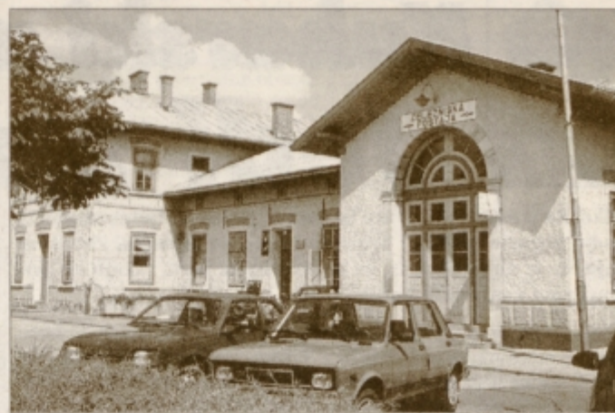
Poslopje ptujске železniške postaje s sprednje strani, kjer je tudi urejeno parkirišče za 52 avtomobilov.

spremlja ves obisk mesta in njegove okolice, zato se trudimo, da potnikov ne bi razočarali. Želimo si zadovoljnega potnika, zadovoljen naj bi bil od trenutka, ko je stopil na železniško postajo, pa do trenutka, ko jo zapušča. Z zadovoljstvom lahko povem, da smo, odkar sem na železniški postaji Ptuj, veliko naredili; prišel sem kmalu po vojni, v kratkem bom imel osem let dela na njej. Uredili smo park, parkirišče za 52 avtomobilov, to smo delali skupaj z občino Ptuj. Povsod na postaji je veliko zelenja in rož, posodobili smo prometno pisarno, moja pisarna sicer še čaka na preureditev tako kot tudi celotna železniška postaja, ki jo je vodstvo železnic napovedalo v lanskem letu, pri tem pa je bila obljubljena tudi podpora mestne občine Ptuj. Nekatere spremembe je doživela tudi okrepčevalnica, s katero upravlja Slovenijaturist in kjer prav tako napovedujejo posodobitev. Med prvimi postajami v Sloveniji smo prodajo vozovnic predali potovalni agenciji; v našem primeru je to prevzela agencija Zabasu. Zadovoljni smo tako mi, kot potniki. Nismo pa zadovoljni s tem, kar se dogaja v straniščih. Te prostore večkrat letno pleskamo in jih tudi sicer obnavljamo, vendar je vse zaman. Poškodbe in demontaža vsega, kar se da, se nadaljuje. Morda