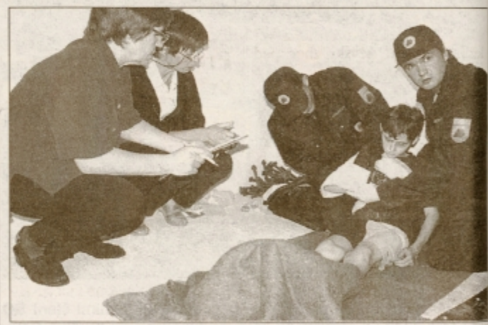
Oskrbno ponesrečencev so budno spremljali člani strokovne komisije.

Svoje znanje in sposobnosti v nudenju prve pomoči in oskrbi petih "ponesrečencev" je tokrat dokazovalo le pet ekip. Najuspešnejši so bili člani ekipe Ptuj 2 in se bodo udeležili državnega preverjanja. Drugi so bili člani ekipe mestne občine Ptuj I, tretje je bila ekipa občine Gorišnice, 4. občina Ormož, 5. mesto pa je dosegla domača ekipa iz občine Kidričevo. Po končanem tekmovanju so najbolje uvrščenim izročili pokale in priznanja, zatem pa so svoje izkušnje, morebitne pomanjkljivosti in napake pretehtali v pogovoru s člani strokovne komisije.