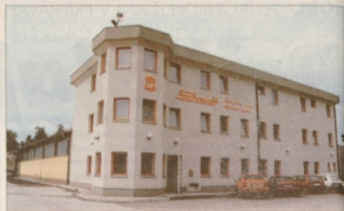
Najhitrejši razvoj v občini je v zadnjem času doseglo podjetje Schmidt šiviljstvo.

TEDNIK: Trenutno je najbolj vroča tema odprtje poletnega kopališča.