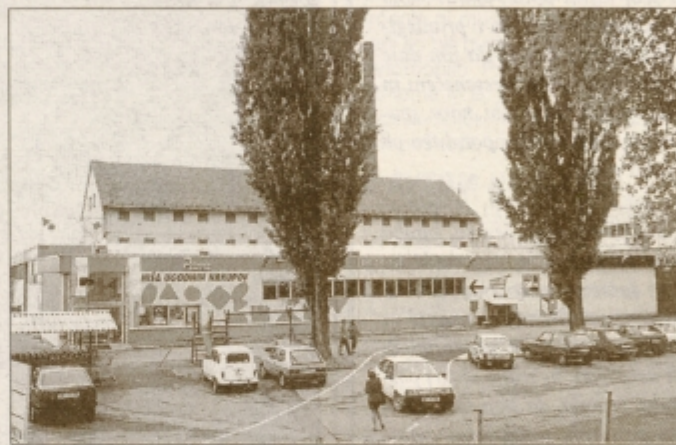
Prodajni center Petovia ob Dravi.

Petljin dan je zahvala kupcem za njihovo zvestobo podjetju.