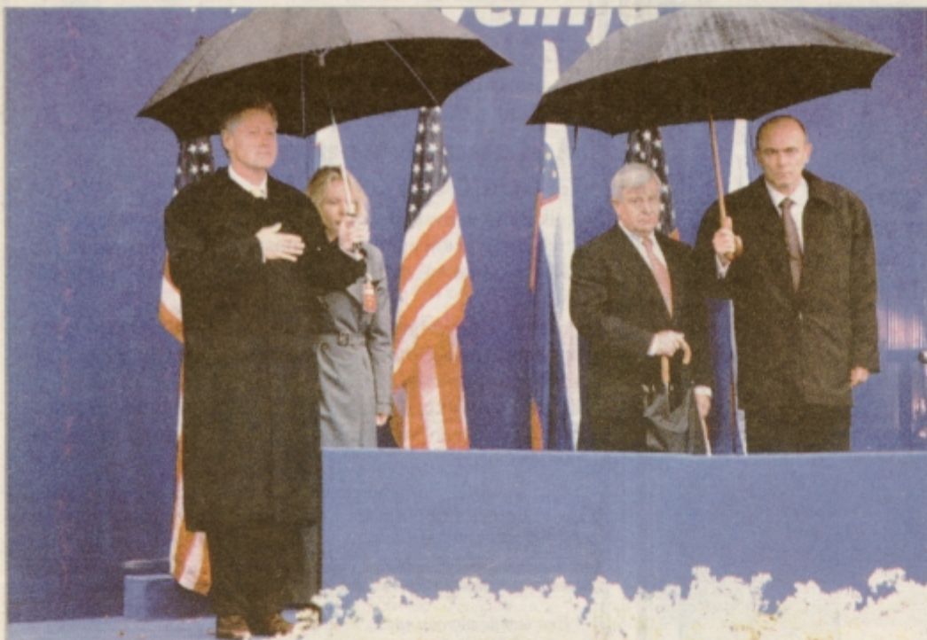
Ameriški predsednik William Jefferson Clinton s predsednikom Milanom Kučanom in predsednikom vlade Janezom Drnovškom na Kongresnem trgu v Ljubljani

Ljubljana, 21. junij 1999, prvi poletni dan. Močan dež ni pregnal nekaj desetisočglave množice Ljubljančanov in drugih Slovencev, ki so po nekaj ur in do kože premočeni čakali - in dočakali prvi obisk predsednika Združenih držav Amerike Williama J. Clintona v naši domovini.