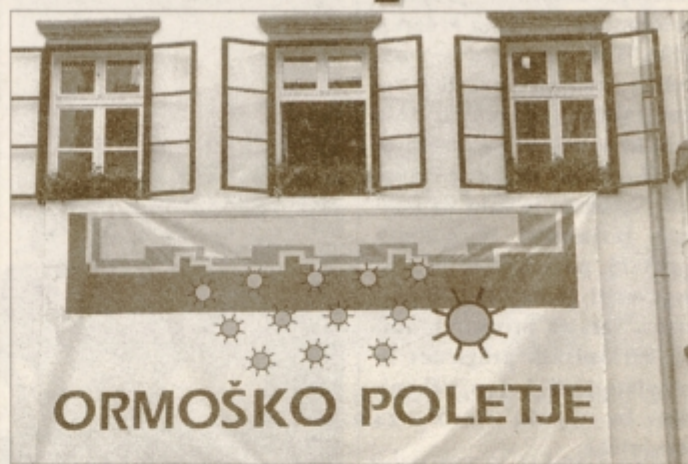
Poletje se je pričelo, koledarsko in kulturno.

Organizatorji so poskrbeli tudi za dobro obveščenost. Vsako drugo gospodinjstvo v občini bo prejelo zloženko s programom Ormoškega poletja, ta pa bo predstavljen tudi v zadnji številki Ormoških novic. Na trgu v mestu ter pred gradom bo