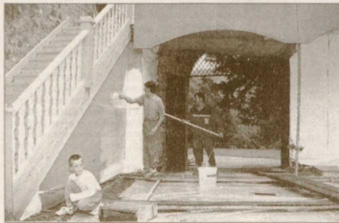
Sceno je treba dobro pripraviti