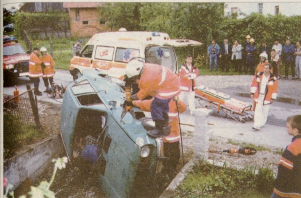
Na gasilski vaji so prikazali tudi reševanje iz poškodovanega avtomobila