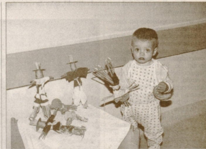
Na otroškem oddelku ptujske bolnišnice odprli razstavo del otrok.