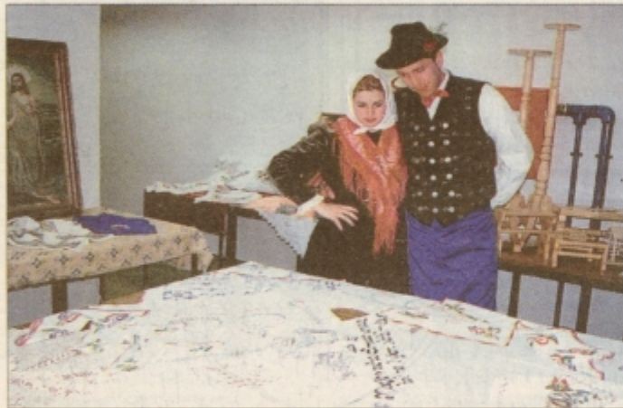
V dvorani so pripravili zanimivo razstavo ročnih del.