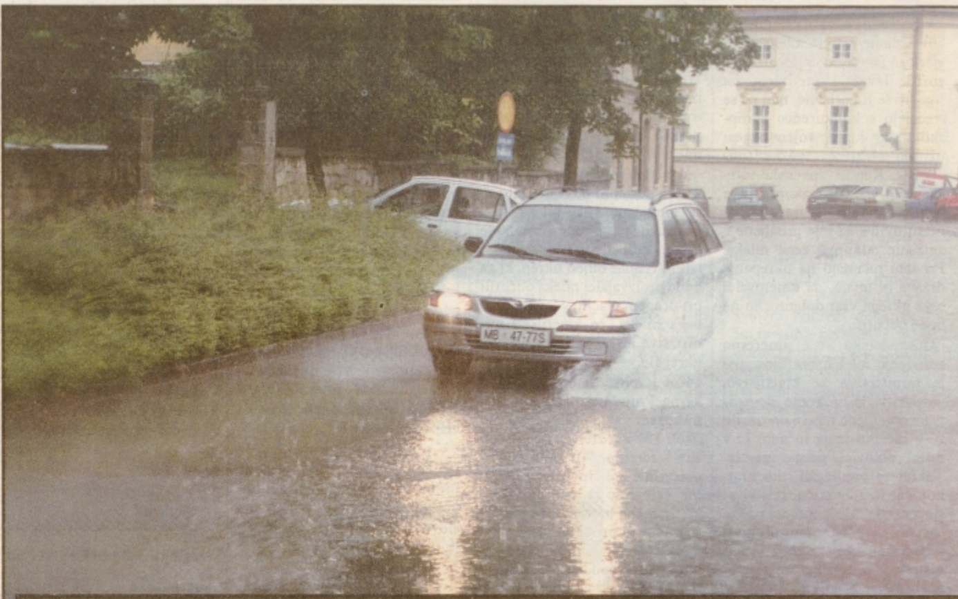
Poletje '99.

PTUJ / OSEM NOVIH ZASEBNIKOV V ZDRAVSTVU