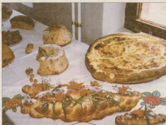
Članice sekcije podeželskih žena pri KD Sela so pripravile zanimivo razstavo domačih dobrot