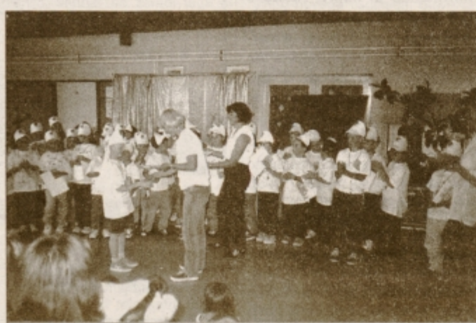
Ob slovesu so si zapeli: "Mi smo minimaturanti ..."