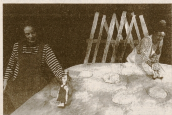
Klovn sreča klovn

Edini in edinstveni pokrovitelj vseh predstav je Gledališče Ptuj. Predstave poklanjamo otrokom in jih v prihodnji sezoni vabimo na ciklus sobotnih lutkovnih matinej. Od septembra do aprila - vsako prvo soboto v mesecu ob 11. uri - na odru Gledališča Ptuj - lutkovna predstava za najmlajše.