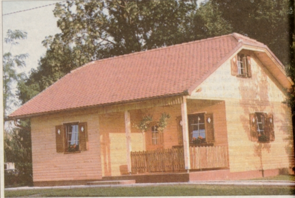
Tale prijetna lesena hiška je športno-vaški dom v lasti Cunkovčanov