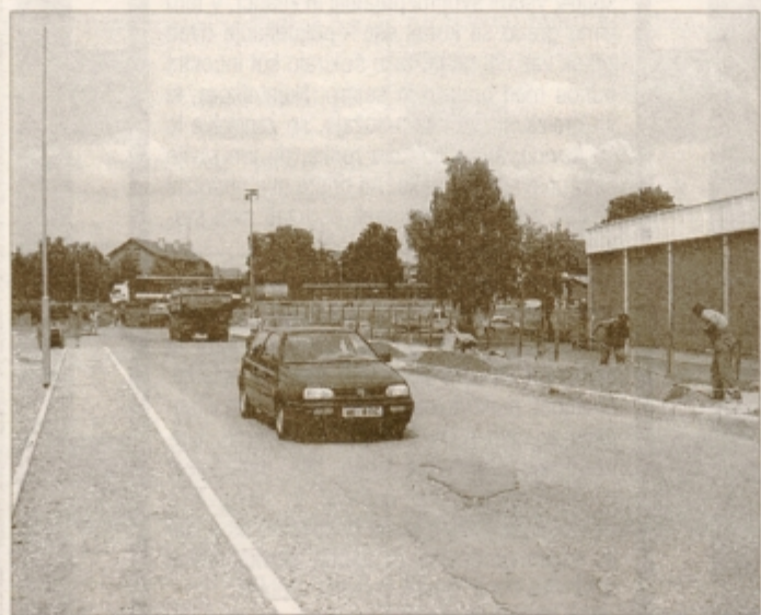
V Vegovi ulici urejajo pločnike.