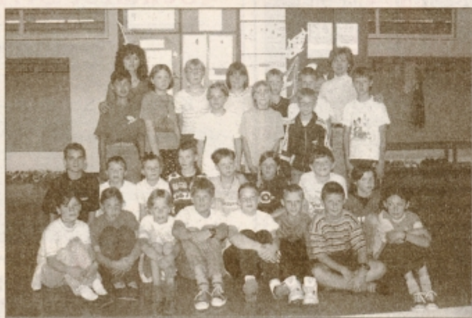
Podlehniški četrtošolci in njihovi mentorici v šoli v naravi

Šola v naravi je posebna oblika vzgojno-izobraževalnega dela. Ves oddelek za nekaj časa odide v obmorski kraj, kjer poteka pedagoški proces z drugačno vzgojno-izobraževalno vsebino, kot smo je navajeni pri vsakodnevnem pouku. Z vsebi-