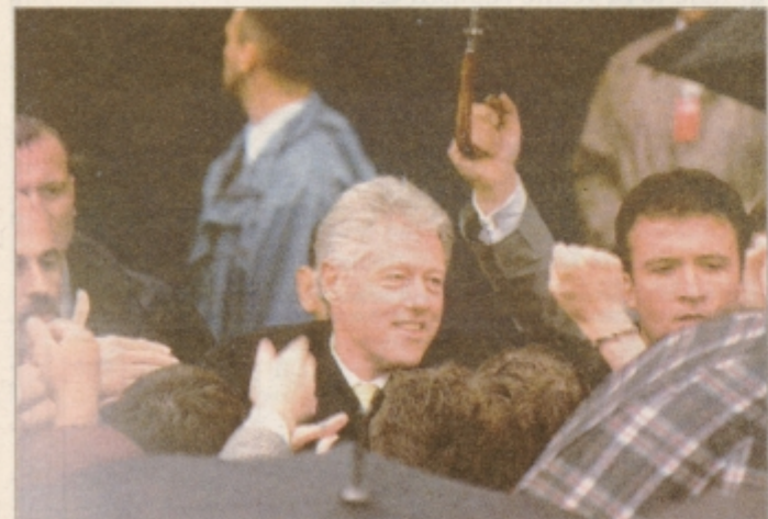
Nenapovedano in mimo protokola se je predsednik Clinton podal med navdušeno množico ter se z ljudmi rokoval in jih pozdravljal.

"Dober dan," je po slovensko zadelo po Kongresnem trgu iz ust ameriškega predsednika in množica se je navdušeno odzvala z vzkliki in ploskanjem. "Nikoli ne bom pozabil obiska v vaši deželi, saj ste mi pripravili nepozabno dobrodošlico," je dejal, se nasmeljal in pogled usmeril v dežnik in črne deževne oblake. Nasmejala se je tudi množica, zatem pa so v približno 20-minutnem govoru v svet odšli hvalospevi Sloveniji. Med pohvalnimi besedami Sloveniji in Slovincem je po mnenju poznavalcev bistveno sporočilo ameriškega predsednika: "Od vas pričakujemo ključno sodelovanje