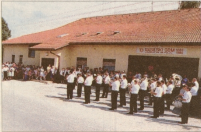
Pred prenovljeno večnamensko dvorano v Lovrencu se je zbrala množica domačinov in gostov

V počastitev 2. praznika občine Kidričevo se že dober teden dni vrstijo različne prireditve. O nekaterih smo že poročali. Prejšnjo soboto, 19. junija, popoldne so v Apačah odprli kulturno razstavo, ki so jo pripravile članice tamkajšnjega društva Podoželskih žena. Kmalu zatem so apaški gasilci svečano krstili prenovljeno gasilsko vozilo.