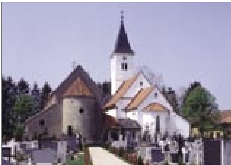
Stara pa nouva cerkev v Turnišči iz južne strani

gotiko. Okouli 1380 so staro cerkev, te že dolgo pod dolnjelendavskimi Hoholt-Bánfijami, prezidali v dvoednotni,