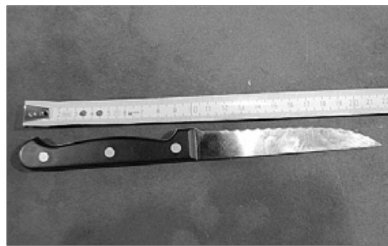
Nož so karabinjerji zasegli