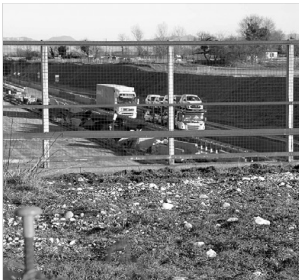
Območje nekdanjega sovođenjskega igrišča bodo preuredili z deželnim prispevkom

Občina pripravlja celovit načrt preureditve območja - Dežela bo namenila 300.000 evrov v 15 letih