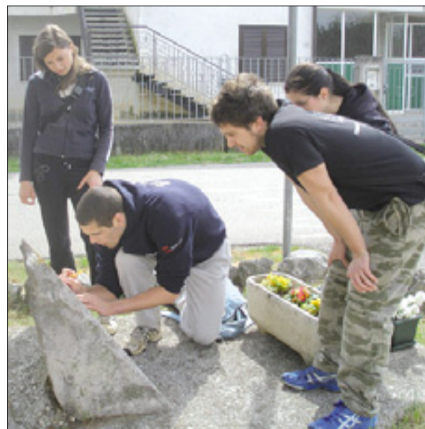
Medpredmetna pobuda: orientacijski pohod po Krasu