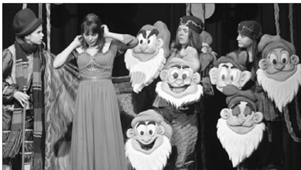
Zgodbo o Sneguljčici je podalo novogoriško Gledališče na vrvici

Zgodba je znana: na dvoru vase zagledane kraljice, ki je za to, da jo imajo vsi za najlepšo v kraljestvu, pripravljena storiti marsikaj in iti tudi v skrajnosti, živi njena lepa pastorka Sneguljčica. Zrcalo jo razglasi za najlepše dekle v kraljestvu, kar kraljico neznanosko razjezi, zato jo da zapoditi z dvora in pozneje poskuša tudi umoriti v hišici sedmih palčkov, kamor se je bila zatekla, na koncu pa se vse lepo izteče: Sneguljčica se prebudi iz spanja, v katerega je padla zaradi zastupljenega glavnika, ki ji ga je bila dala kraljica, in postane ona kraljica na dvoru.