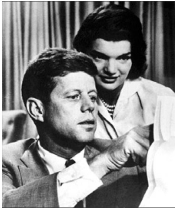
John F. Kennedy s soprogo Jacqueline

Zanimiv je tudi posnetek, ki utegne tiste, ki se zaupajo politikom, malce razočarati. JFK je namreč sodelavca