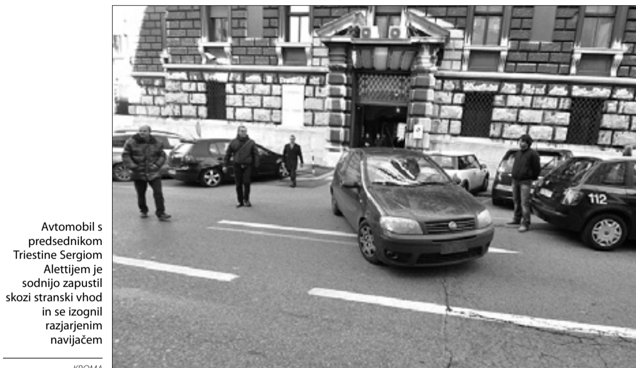
Avtomobil s predsednikom Triestine Sergiojem Alettijem je sodnijo zapustil skozi stranski vhod in se izognil razjarjenim navijačem