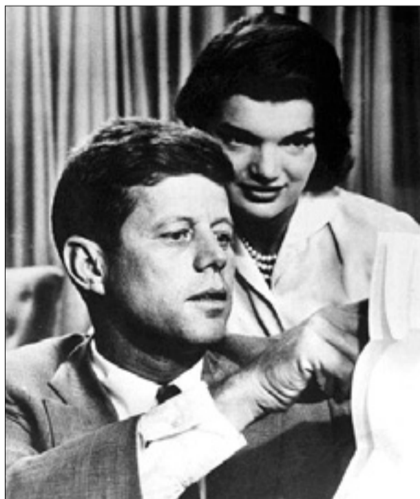
John F. Kennedy s soprogo Jacqueline

Zanimiv je tudi posnetek, ki utegne tiste, ki se zaupajo politikom, malce razočarati. JFK je namreč sodelavca