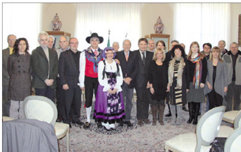
Prejemniki priznanj na goriškem županstvu