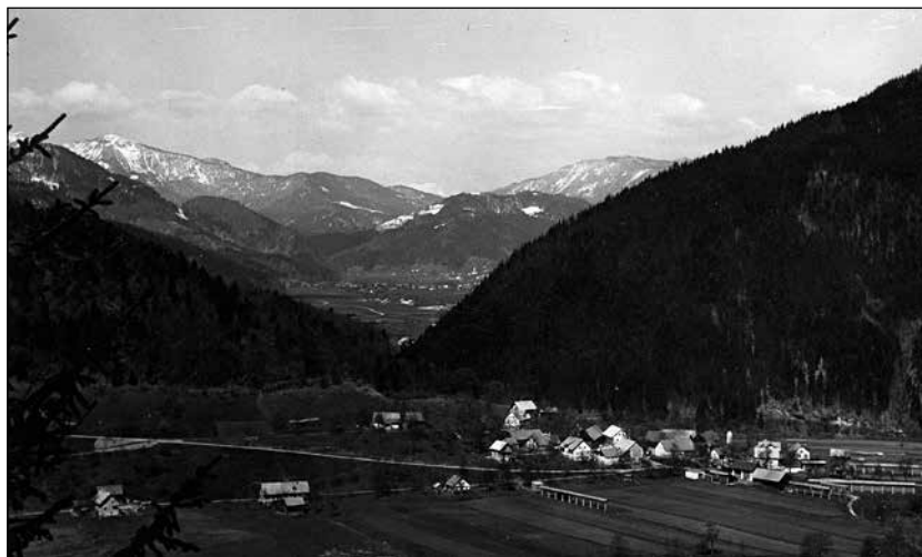
Praprotno leta 1960.

in jih pogosto ponavljal, do konca svojega življenja: "Če bomo ž'vel', bomo lahko naredili še to in ono." Naši družini so se te besede zarezale globoko v srce in so tako postale del bolečega spomina nanj.