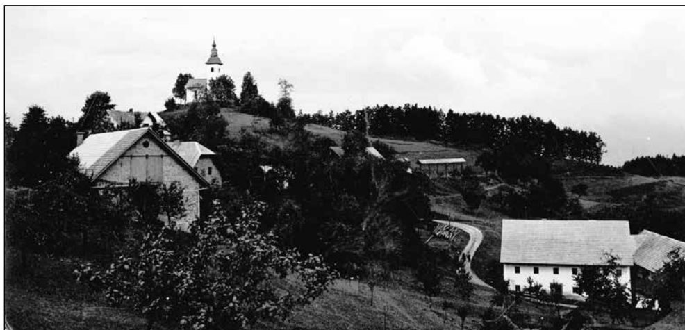
Sveti Tomaž nad Praprotnim (okrog leta 1960).