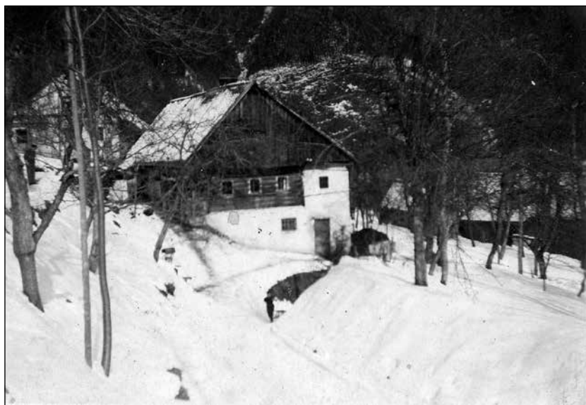
Domača hiša Pr' Grohc.