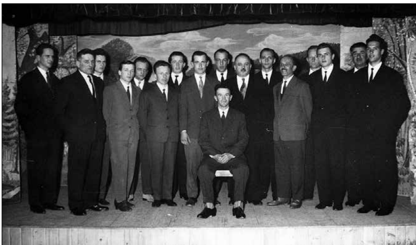
Moški zbor KUD Bukovica.