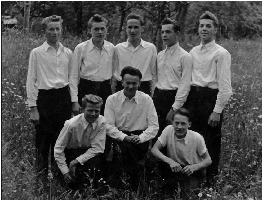
Prvi sestav Fantov s Praprotna.