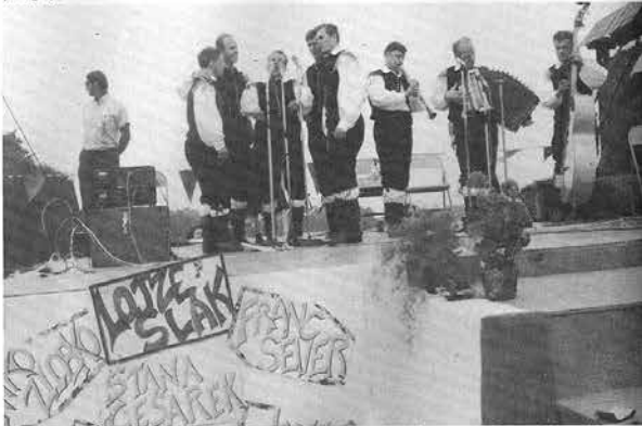
ZGORAJ: Na ALMA počitniškem centru Slovenske dobrodelne zveze v Leroy Townshipu, Ohio je poslušalo Slake okrog pet tisoč Slovencev.