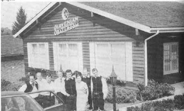
SPODAJ: V Pennsylvaniji imajo Slovenci tudi v Irwinu svoj dom in Slaki so bili povsod toplotno sprejeti.

Opis turnee po ZDA in Kanadi v družinski reviji Tovariš iz leta 1970.