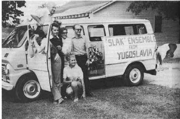
ZGORAJ: Avtomobil „Slak Ensemble“ so po vsej Ameriki vzbujali pozornost in privabljali fotografe.

Za nami je nekaj tednov popotovanja po Ameriki, hitenja od enega mesta do drugega in nabrala se mi je prava kopica vtisov. Ti me spominjajo na staro skrinjo, v katero so ljudje spravljali vse mogoče. V taki skrinji najde prostor malone vse in ko brskaš po njej, tudi najdeš skoraj vse, le težko je vse skupaj urediti in izbrati iz nje tisto, kar je najpomembnejše in najdražje. Kadar pomislim na našo turnejo po Združenih državah, se mi pred očmi zvrstijo dnevi in tedni, naselbine ameriških