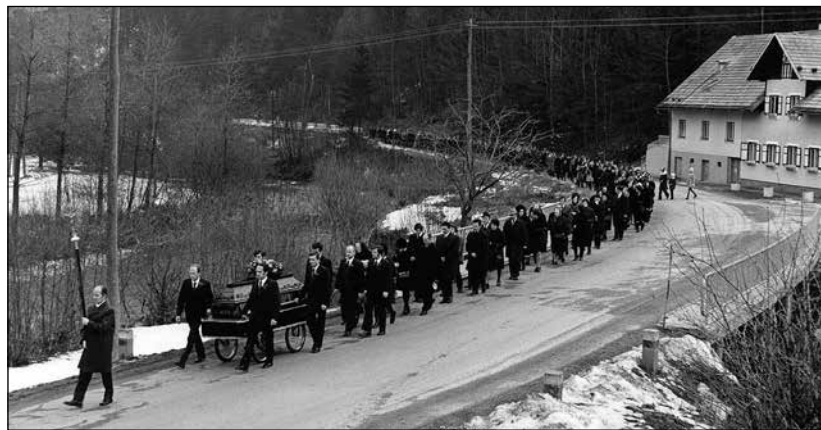
Pogrebni spreved od doma v Selca (mimo Birta).

Bim bam bom, bim bam bom, pojejo zvonovi, bim bam bom, bim bam bom, žalostno slovo, v zadnji dom spremljajo milega nam slavčka, glas njegov kot v spomin skrije se v srce.