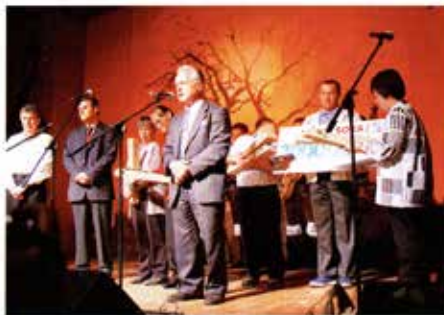
Prireditve z dobrodelnim predznakom.