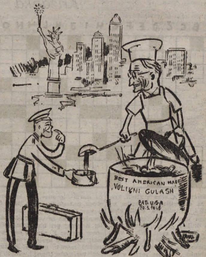
AIREY, TRUMANU: Dej, dej stric, zajamj globoko, sicer bomo v Ttu stu kmalu skrahirali.