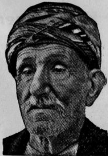
Zaro Aga, znani Turek, ki je o sebi trdil, da je star 160 let, je umrl. Zdravniki trdijo, da je bil star kvečjemu 111 let. Imel je 7 žena. V zadnjem času se je hotel vnovič poročiti. Ena izmed njegovih žena je stara 88 let. S svojo »starejšostjo« je nabral mnogo denarjev. Postregel je ljudem, posebno časnikařem, ki so željni senzacij.

V ozadju grozot in nasilja državljanske vojne na Kitajskem se dviga pred nami in vsem svetom slika onih slabotnih, a vendar tako močnih žen, ki se branijo bežati od tam, kjer bežijo možje, ki v svoji nesebični ljubezni prenašajo udarce in trpinčenje, da bi varovale uboge neboljane sirote.