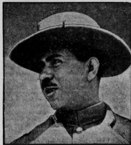
General Lazarov Cardenas, ki bo po splošnem mnenju izvoljen za predsednika Mehike. Kandidira ga narodna revolucionarna stranka.