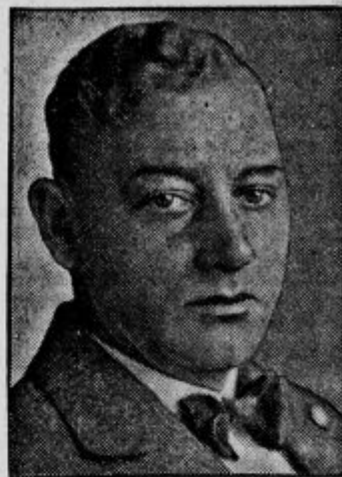
Novi šef štaba nemških napadalnih čet (SA) Viktor Lutze. Doslej je bil predsednik pokrajine Hannover in obenem načelnik SA za skupino severozapad. Tega je imenoval Hitler namesto Röhma, ki ga je dal po vsej verjetnosti ustreliti.

Šele zdaj so prispela iz Sofije podrobna poročila o vremenski katastrofi, ki je zadela okraj Plevno na Bolgarskem. V Brašlanici je voda poplavalila vso vas, porušila je šest hiš in druge močno poškodovale. Ljudje so se rešili na strehe. Neki starček je zakasnel in voda ga je pogoltnila. Na pomoč je prišlo vojaštvo s pionirji. Stvarna škoda je ogromna, ker je voda odnesla s seboj več tisoč glav živine. Iz okraja Plevno poročajo, da je strela ubila sedem oseb, utonile pa so tri osebe.