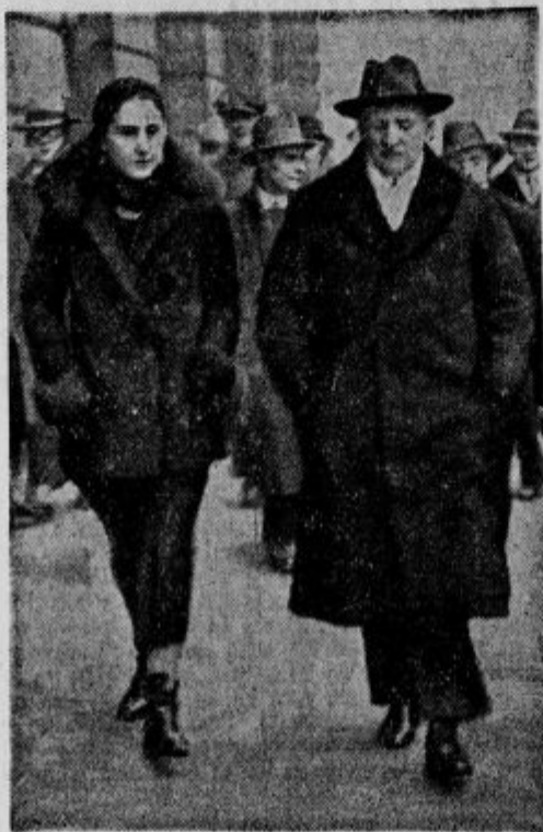
General Schleicher in njegova žena ubita

Hitler se je pred boljševiškim vulkanom, ki ga je odprl, šel skrivati v zatišje redne vojske Zavladali so generali, vrača se stari pruski militarizem — Na Bavarskem grme topovi