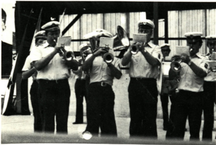
S srečanja gorenjskih pihalnih orkestrrov v Moravčah leta 1984