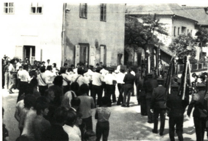
S proslave ob otvoritvi gasilskega doma v Moravčah 1975