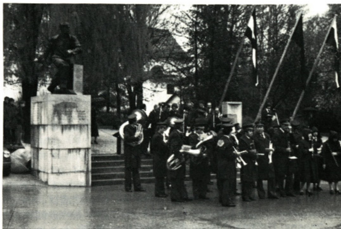
Nastop za 1. maj s spomenikom moravskega rojaka Tineta Kosa

V letu 1981 je godba med drugim nastopila tudi za praznik OF in 1. maj, za dan mrtvih, na proslavi Dneva republike, pri otvoritvi razstave ob kmečkem prazniku v Moravčah, pri otvoritvi vrtca, na proslavi 90-letnice Gasilskega društva Moravče, na Vinjah pri odkritju spominskega obeležja ob 45-letnici sestanka na tem kraju.