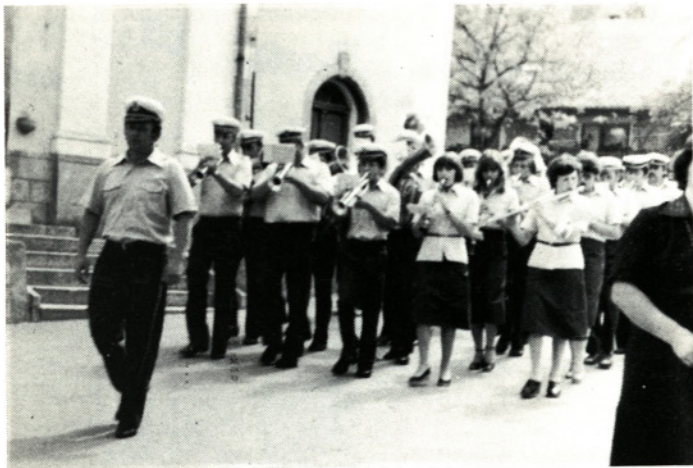
Z nastopa moravške godbe na Vrhpoljah