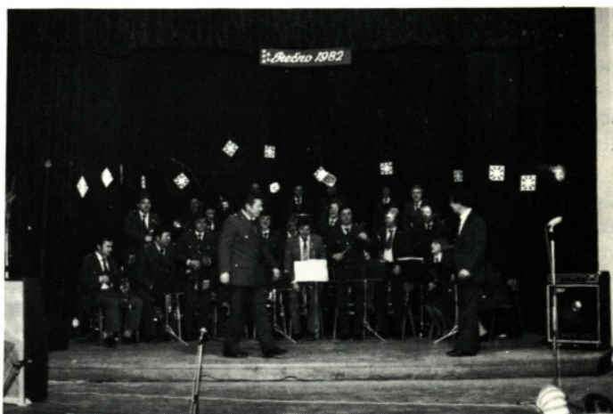
Z novoletnega koncerta v Partizanskem domu v Moravčah