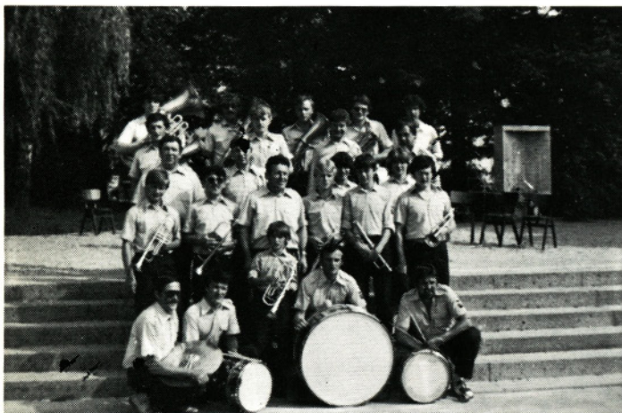
Največ nastopov je moravska godba imela v središču Moravč

uspelo srečanje gorenjskih pihalnih orkestrrov, ki je bilo v dvorani Kulturnega doma v Mengšu. Na srečanju so se predstavili Pihalni orkester Trzič, Godba na pihala DPD Svoboda Lesce, Pihalni orkester Alpina Žiri, Pihalni orkester Solidarnost Kamnik, Pihalna godba Moravče in Pihalna godba Mengeš.