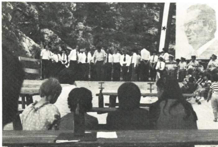
Nastop Moravske godbe v letnem gledališču Mengeš

Godba je v juliju sodelovala tudi na proslavi ob 20-letnici Gasilskega društva Jarše – Rodica.