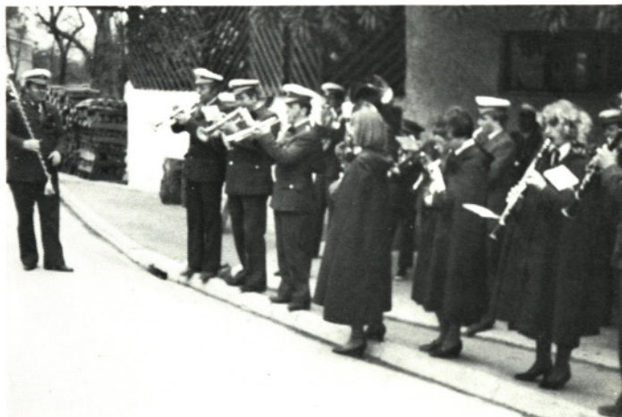
Kjerkoli se pojavijo moravški godbeniki, povsod jih radi poslušajo

O srečanju pihalnih orkestrrov Gorenjske v Moravčah sem zapisal v Občinskem poročevalcu z dne 29.6.1984: „V organizaciji ZKO Gorenjske, ZKO Domžale in Pihalne godbe Moravče je bilo v nedeljo 3. julija 1984 v počastitev občinskega praznika in 100-letnice menseške in domžalske godbe, srečanje pihalnih orkestrrov Gorenjske. K slovesnemu razpoloženju je prispeval lep obisk, prav posebno pa še lepo sončno vreme, kar je letos prava redkost.