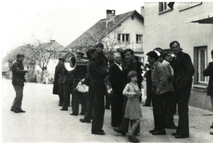
Prvomajska budnica pri Nadlogu v Moravčah