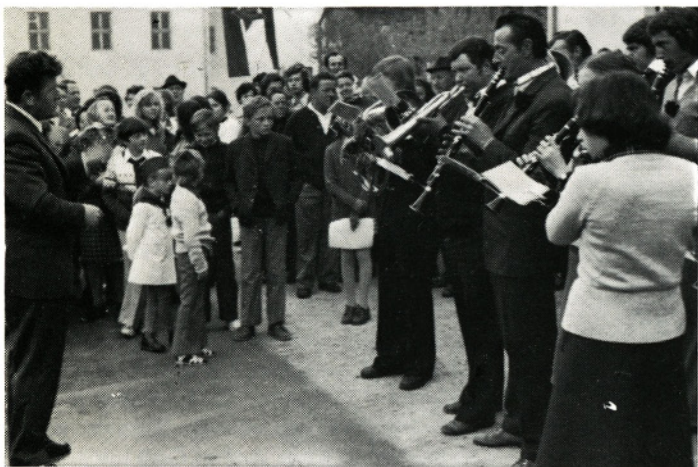
Prvi nastop ponovno ustanovljene Moravske godbe 1. maja 1975