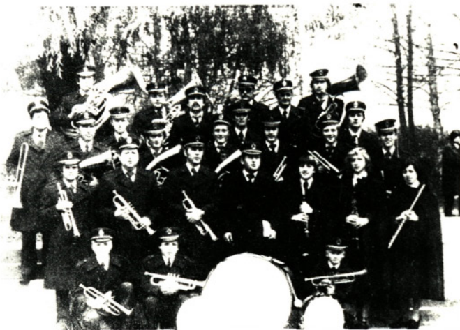
Pihalna godba Moravče leta 1978

V juniju je imela godba nastope v Lukovici, na Studencu, pri otvoritvi Mladinske delovne akcije Peče, v juliju je pa sodelovala na proslavah na Vačah in Moravčah, v septembru je pa nastopila v Lukovici ob sprejemu Maršala Tita.