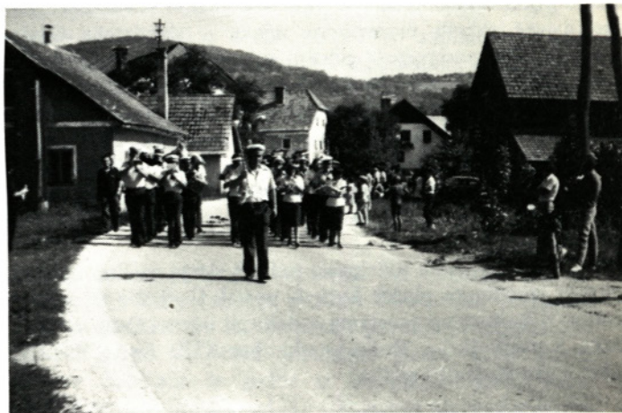
S praznovanja kmečkkih žena v Moravčah leta 1981