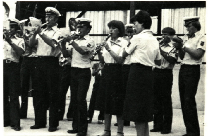
S srečanja gorenjskih pihalnih orkestrrov v Moravčah leta 1984

V Partizanskem domu v Moravčah je bila slavnostna proslava ob Dnevu JLA, kjer so v kulturnem programu sodelovali Pihalna godba Moravče, Otroški pevski zbor ŠKD Osnovne šole Jurij