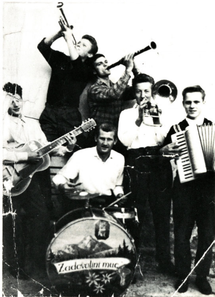
Prvi posnetek Ansambla Zadovoljni muc