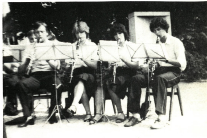
Mladi pihalci Pihalne godbe Moravče

Pri odkritju spominske plošče na osamljeni Osoletovi domačiji v Dešnu nad Moravčami, kjer je bila 18. in 19. februarja 1943 pokrajinska konferenca KPS za Štajersko, so 22. julija 1978 krajani med katerimi je sodelovala tudi Moravska godba, pripravili zelo lep, pa tudi zabavni program.