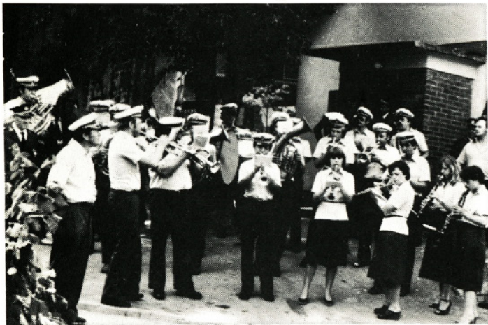
Z nastopa moravske godbe na Vrhopljah leta 1979

V letu 1979 je imela godba 20 nastopov, od tega dva izven občine.