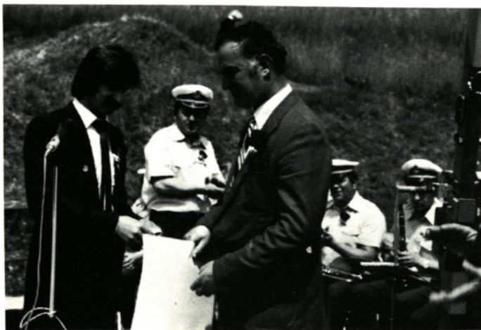
Ob otvoritvi moderniziranega TOZD-a Peskokopi v Moravčah