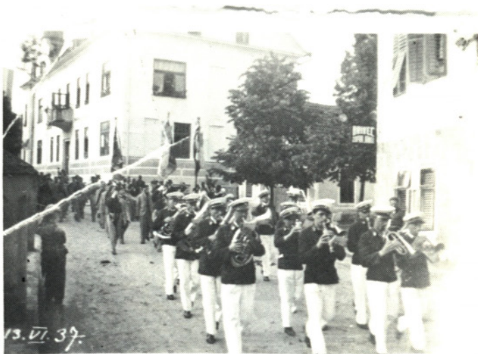
Nastop Moravske godbe na sokolskem zletu leta 1937