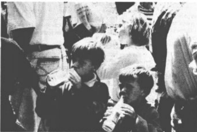
Kdo pravi, da na kmetljah ni mladih