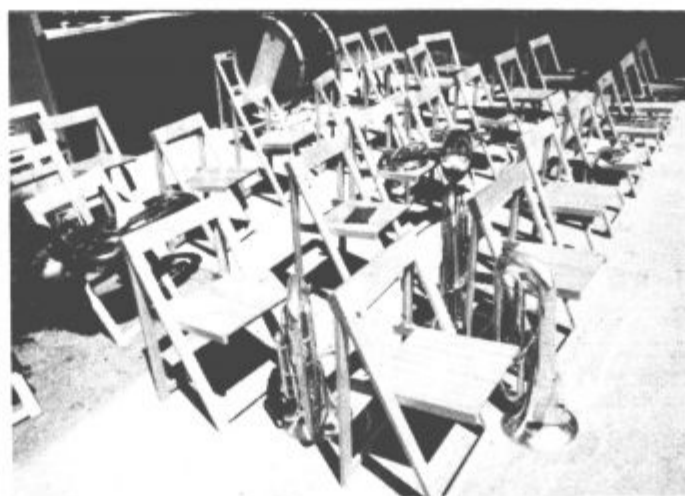
Buuu!!! Naj počivajo, zaslužili so. Do prihodnjega svetovnega prvenstva jih bomo ponovno ogreli. ■ foto: vos