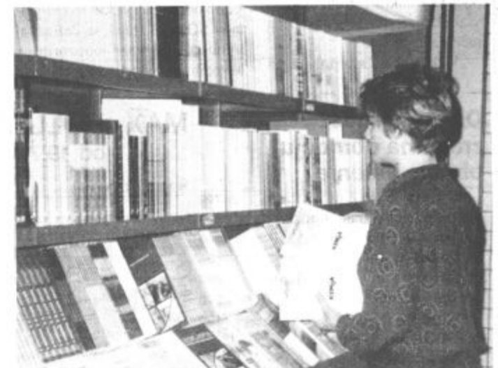
V Mladinski knjigi v Velenju že imajo vse knjige za osnovno šolo in večino za različne srednješolske programe. Počitnic tu ni čutili, saj se jih je že veliko odločilo, da se bodo gneči v prvih šolskih dneh izognili s pravočasnim nakupom knjig in drugih potrebščin.