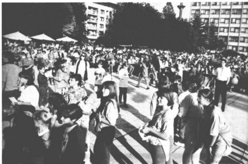
Prihajali so in prihajali... Ko je sonce zašlo, je bila gneča okoli odra in na vsem Titovem trgu popolna. Ljudje so se spraševali, kdo je nazadnje tako napolnil to prizorišče. Se vi spomnite?