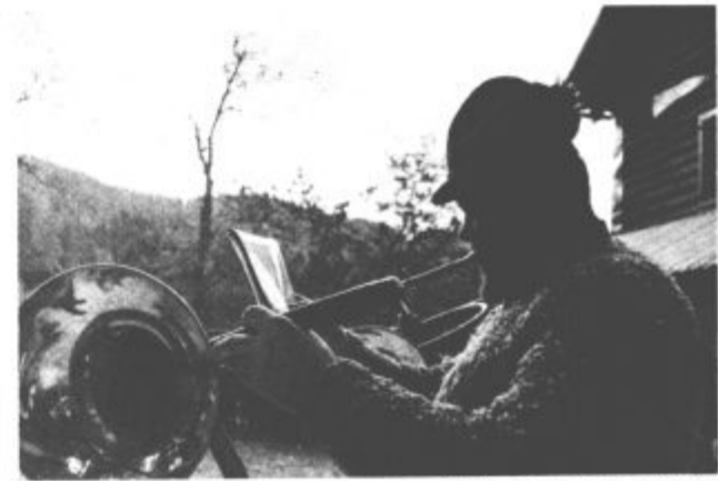
Adijo, pa zdravi ostanite

Strpnost je eden najbolj znanih političnih pojmov, ki je v preteklosti (tudi stoletja nazaj) zanetil marsikak medrasni spopad. Danes se poleg izrazito državljanske poze do Neslovencev pojavlja pravzaprav nov fenomen v slovenskih medetničnih odnosih: to je odnos do muslimanskih beguncev. V občini Žalec so nastanjeni v Letušu, veliko več jih je privatno pri "slovenskih" sorodnikih. Če človek nima dosti problemov sam s sabo, potem tudi problemov z begunci ne zaznava. Seveda je situacija drugačna pri (po E. Frommu) slovenskih zajedljivejših nekrofilnega karakterja in večino, sicer poraznega standarda med domačimi štirimi stenami, ki pa jim radi prisluhnejo.