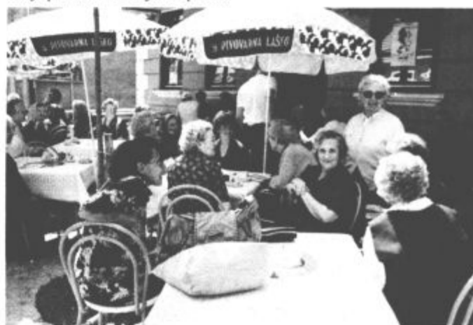
Varovanci doma za varstvo odraslih na izlet niso odšli daleč. Pa vendar je bil obisk Starega Velenja za njih dogodek.