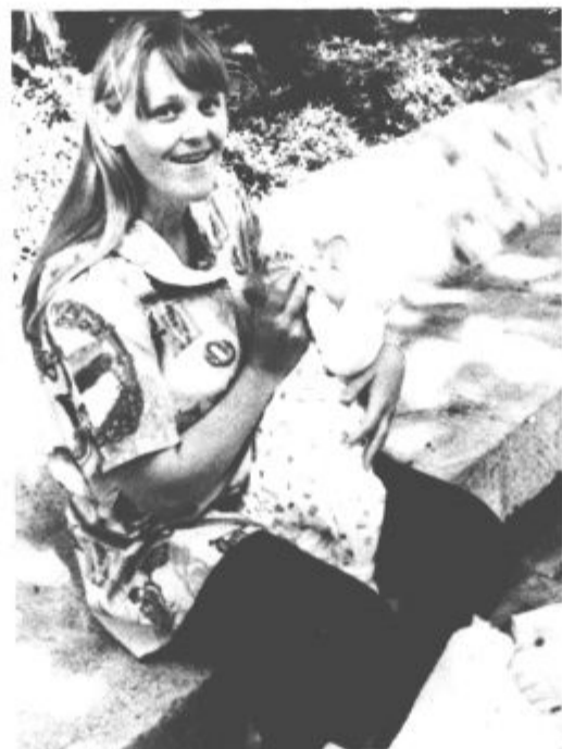
Seveda je žejen, kaj pa misliš. Ti mogoče nisi?