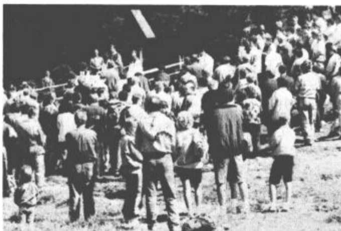
Ob vsej slovesnosti je imela maša tudi kanček druge vsebine

Sicer je pa vseeno, tudi v Moravi niso zganjali politike, čeprav je bil ob pašni skupnosti Hleviške uradno organizator sre-