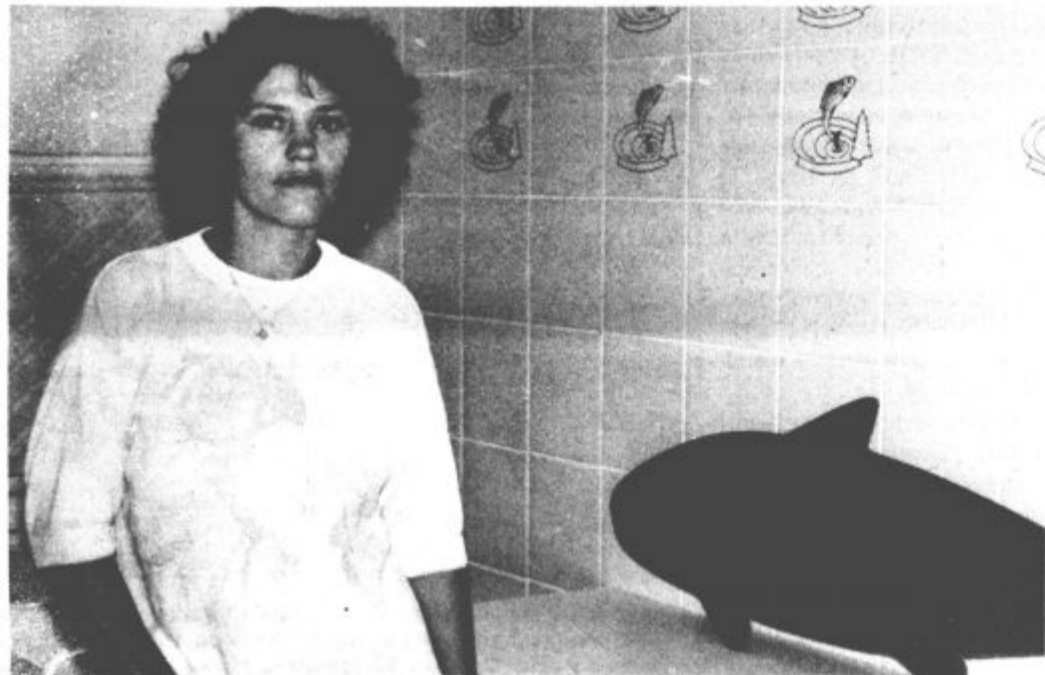
Če Ribarnica bo, potem bo v tem objektu le z začasnim dovoljenjem.