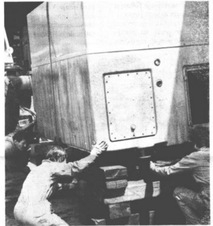
V programu Hladilno - zamrzovalni aparati zaradi posodobitvenih del predstavljajo stroje in naprave tudi v obratu Hladilniki. Od tam so v obrat Zamrzovalne omare postavili tudi 300- tonsko stiskalnico, delo pa so zaupali mariborski Hidromontaži