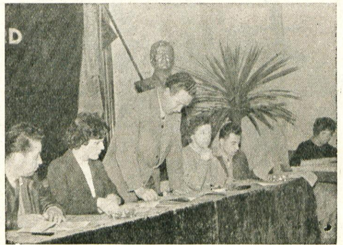
Delovno predsedstvo občnega zbora

V razpravi je govoril o nagrajevanju po učinku in o vplivu nagrajevanja na večjo proizvodnjo delegat iz tovarne PEKO: V Peko so že lani septembra začeli nagrajevati po enoti proizvoda in dober učinek stimulativenega nagrajevanja se je odražal v večji proizvodnji. Letos so že v prvih treh mesecih dosegli za 26 % večjo proizvodnjo, kot lani v istem obdobju. V podjetju tekmujejo posamezni oddelki za čimvečji ekonomski uspeh. Prejemki posameznih ekonomskih enot so odvisni od količine proizvodnje, od ekonomičnosti (varčevanja z elektriko, čim manjši izpad materiala in kar najnižji režijski stroški) in od rentabilnosti oziroma od končne cene proizvoda. Tako je z novim načinom nagrajevanja zelo zaostrena kontrola po oddelkih. Delavci se ne zanimajo več samo le za svoje delovno mesto, ampak za poslovanje celega oddelka. Z