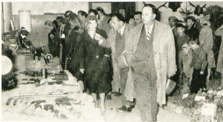
Gostje si z zanimanjem ogledujejo razstavo