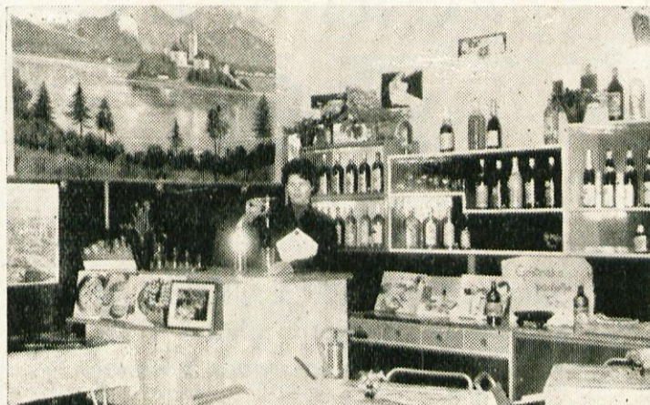
Za gostinski poklic se je po ogledu razstave prav gotovo odločilo marsikatero mlado dekle