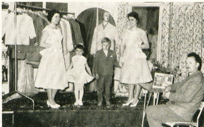
Gorenjska oblačilnica je prikazala najnovejše modele svojih izdelkov