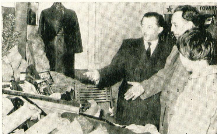
Predstavniki RUNO razkazuje izdelke gostom

Teh nekaj mnenj nam pove, da je razstava skupaj s prikazom filma in z obiskom gospodarskih organizacij dosegla svoj namen.