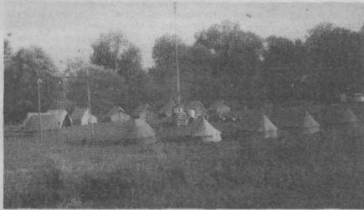
Tabor v vasi Podzemelj — pogovor s članom ZZB NOV