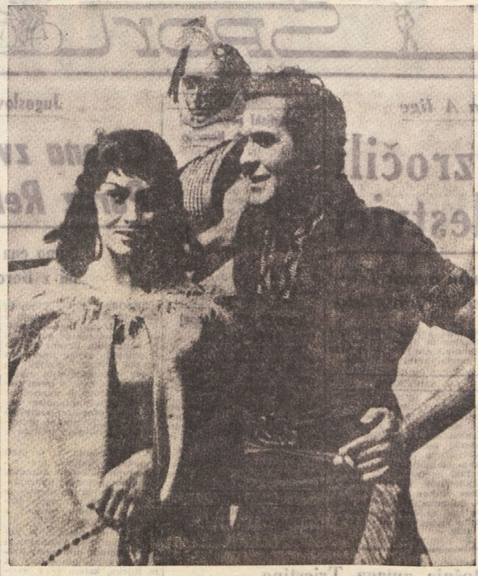
Kot smela poročal že v nedeljo je slavnega filmskega igralca Tyrona Powerja v soboto zdelo kapal z neznanim filmu, v katerem je igral vlogo Salomona, Gina Lollobrigida pa kraljico Sabo. Oba igralca vidimo na gornji sliki pred Tyronovo smrtjo.

Članek je bil napisan za "Mednarodno politiko, ki ga objavlja v današnji številki".