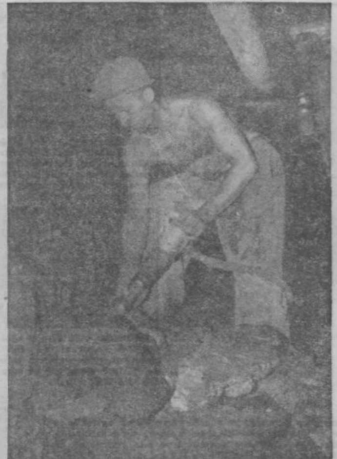
V rudarskem oknu