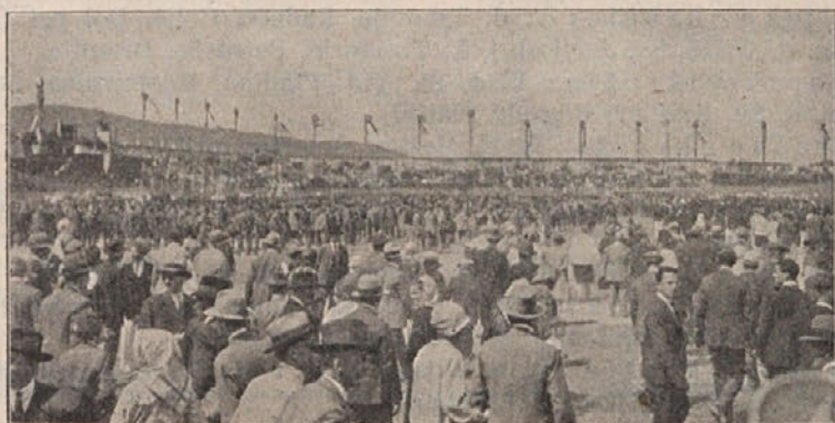
Stadion: Občinstvo se zbira k sv. maši.

Zato se pravi Orel zaveda vedno resnice: telovadba in izobrazba sta dva predmeta orlovskih tekem, a nikakor še ni popolen Orel zato, ker bi v teh