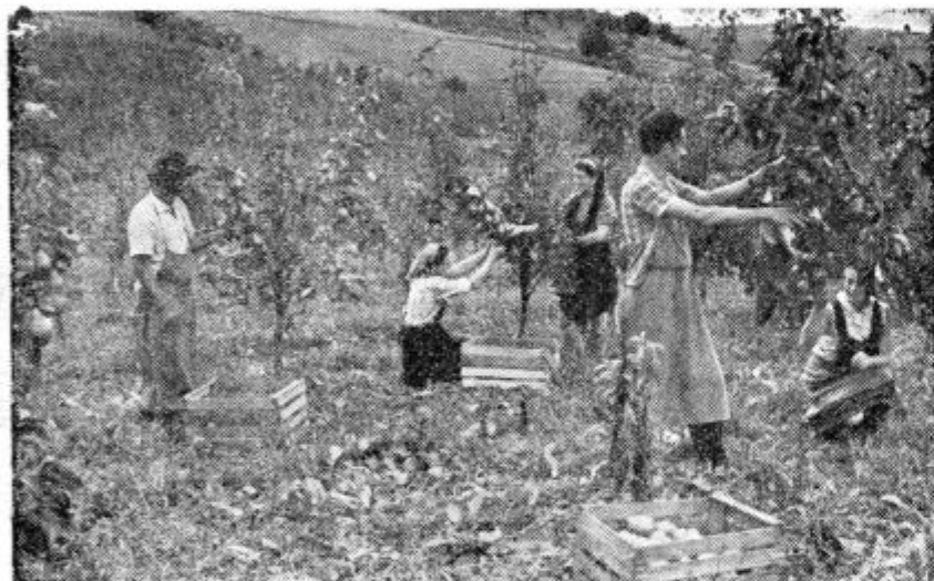
Delavci pri obiranju hrušk na Kmetijskem gospodarstvu Selce

Na posestvu so nam zagotovili, da pričakujejo tudi dober pridelek hrušk — okrog 3 vagone, pa tudi jabolk. Hruškam se cena vrtili okrog 60 din za kg. Sadje v glavnem pro-