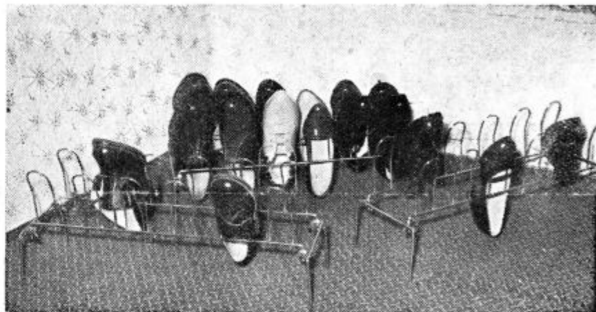
Na sliki: Stojala za čevlje, ki jih izdeluje podjetje »Žica« Ljutomer. Stojalo je za šest parov čevljev in zavzame le 60 cm prostora. Cena je okrog 700 dinarjev. Čevlji na takem stojalu obdržijo prvotno obliko.