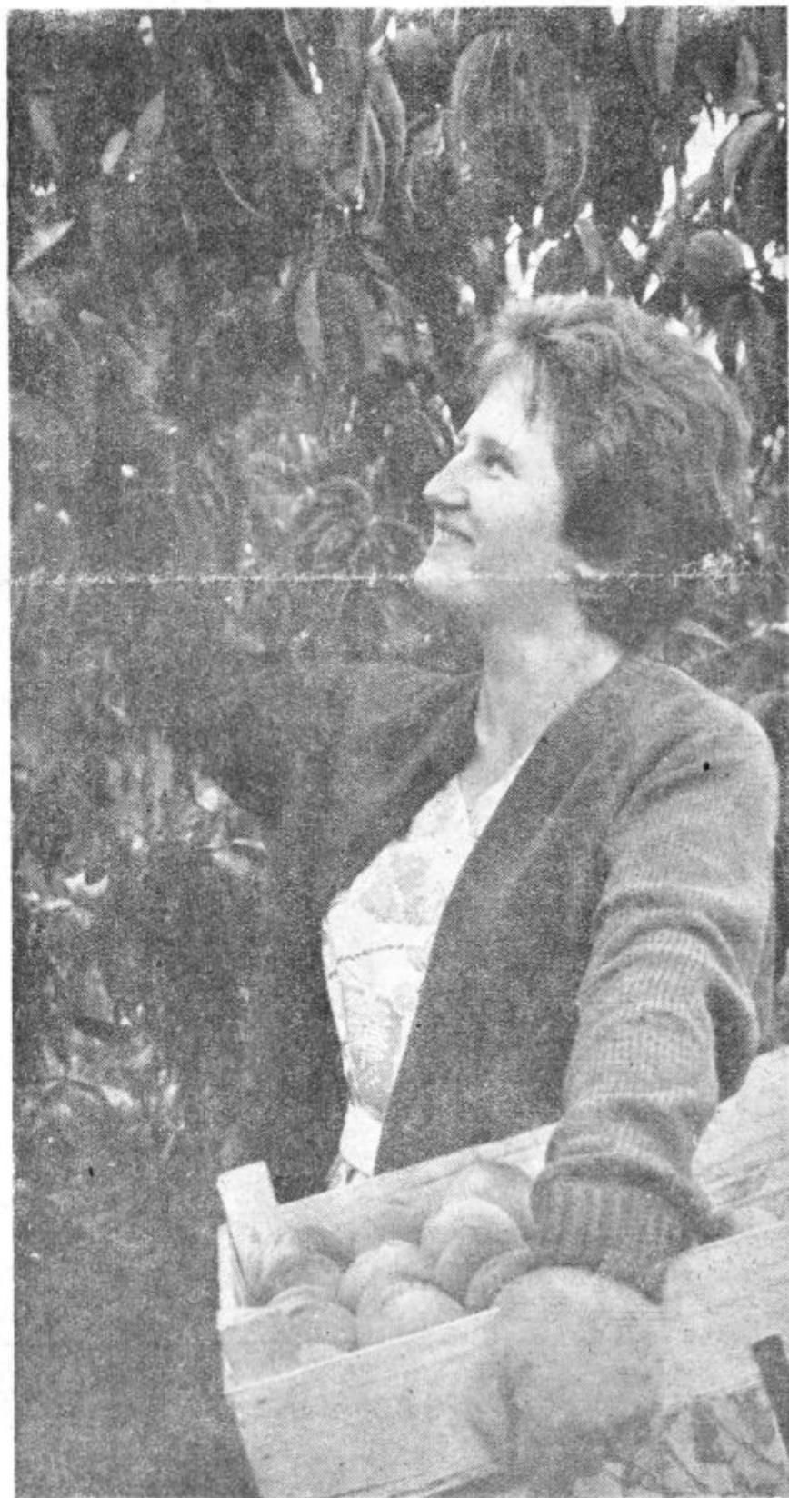
Se nekaikrat bo segla z roko in na drevesu, prej polnem velikih in okroglih breskev, bo ostalo le še zele o listje. Članek o KG Selce berite na 2. strani.

predavanja v zvezi s tem zgodovinskim dogodkom; predavanja so bila v vseh večjih krajih občine dobro obiskana. Tokrat so predvajali tudi nekaj filmov o poteh prijateljstva in miru.