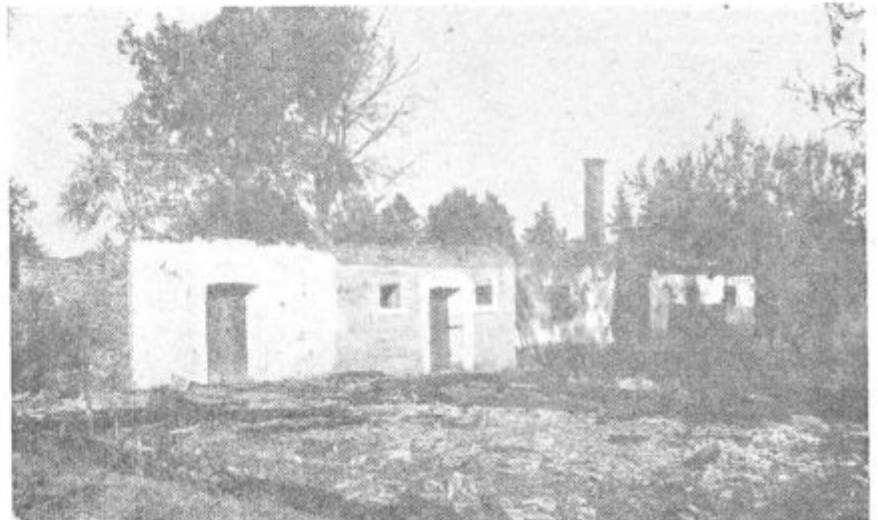
Očrneli zidovi, polomljena opeka, napol zgorelo pohištvo in od ognja porumenela drevesa v okolici so le še ostanki tega, čemur so nekoč rekli lepa kmečka hiša.

spomnili vse tiste, ki se radi vdajajo alkoholu, kam lahko privede pretirano uživanje tega strupa. SZDL bo morala pomagati reševati tudi take primere, zlasti preko sekcij za zdravstvo.