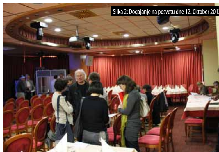
Slika 2: Dogajanje na posvetu dne 12. oktober 2013.