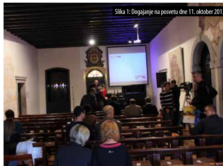
Slika 1: Dogajanje na posvetu dne 11. oktober 2013.