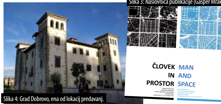
Slika 3: Naslovnica publikacije (Gašper Mrak).