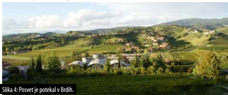
Slika 4: Posvet je potekal v Brdih.

Inadequate living conditions are also expressed by stress indicators of individuals or the society as a whole, directly affecting the response of the immune system and leading to unnecessary deterioration of a person's health. In parallel, we have to consider factors such as growing patient expectations, aging population, new insight into unhealthy lifestyles, and medical and technological breakthroughs. All of these indirectly affect the system of integral health services and a person's attitude to the sustainability of the living environment.