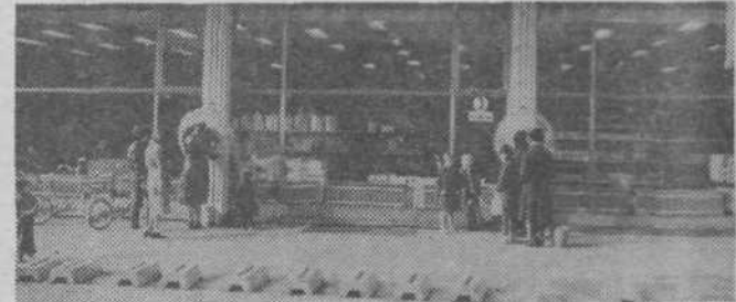
Telefonski govornici pred Namostva sta vedno zasedeni

Pa smo pri vzdrževanju govornic, ki so kar prepogosto pokvarjene. Od 276 javnih telefonskih govornic PTT podjetja Ljubljana jih je na področju mesta čez 200 in prav te so najpogostejša tarča izživljanja posameznikov. Če pogledamo žalostno statistiko poškodb, ki smo jih zabeležili do septembra in ki že prekašajo število poškodb v lanskem letu, moramo povedati, da je bilo letos odnesenih že 37 slušalk (lani 33), ukradena je bila kasetna z denarjem, dva medkrajniva telefonska aparata sta bila močno poškodovana, dve govornici povsem uničeni, trije dušilniki pa so zgoreli. Telefonskih imenikov bi nam se-